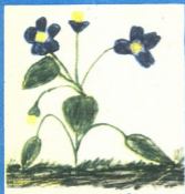
„ია“—ნახატი ნონა ფირანიშვი- ლისა, 6 წლის, ყაზბეგი.