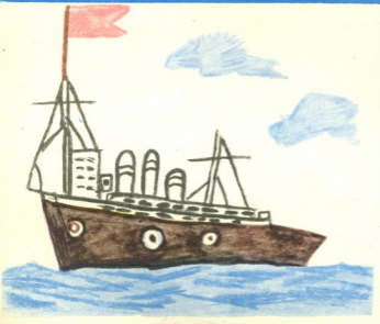
„გემი“—ნახატი შალიკო ლუდუშაურისა, 6 წლის, ყაზბეგი.