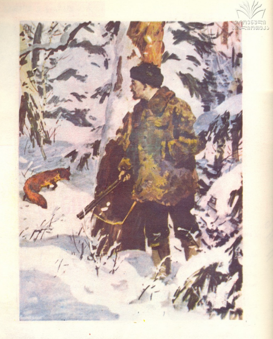
– ტეე იეო ძალიან ლაძაზი და ჩუმი. გამოჩნდა- მიისეღ-მოიხედა, კისერი . მოულოდნელად პატარა ნაძვთან მელია წაიგრძელა, — ალბათ ჰავრი დაენოსა