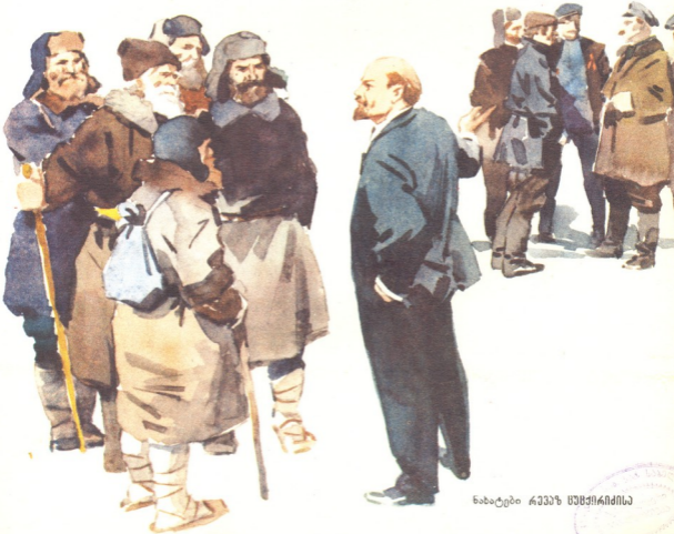
ნახატები რეჟისორ სემენოვს

შემობრუნდნენ კოსტრომელები. ვერ გაიგეს, რა ხდებდა; დერფთანში ჯარისკა- ცები და მატროსები ირევიან. მოშორე- ბით გლეხები ღგანან და მასლათობენ. მათაც ქალაშნები და თბილი ჯუბები