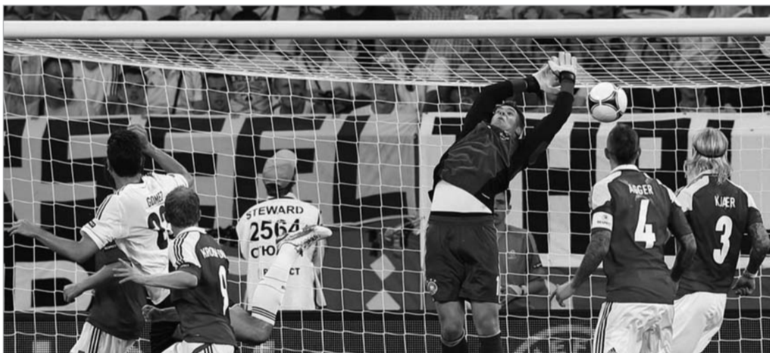
კრონ-დელიმ ევროპის ჩემპიონატზე მეორე გოლი გაიტანა

ჰოლანდიაში ცუდი სიტუაცია იყო. ბერტ ვან მარვიკი ნორმალური მწვრთნელია. ამ ნიჭით და ქარიზმით ჰოლანდიას დანია და პორტუგალია უნდა დაეშალა, გერმანიასთან პირველი ნომრით ეთამაშა და ბევრი ბონუსი დაესვა. ჰოლანდია იდგა და ვან მარვიკი არ რისკავდა. იყო რამდენიმე ტაქტიკური იაღლიმიც, მაგრამ რთულია არ ენდო ინგლისის ჩემპიონატის საუკეთესო მოთამაშეს, მისტერ ვან პერსის. რთულია არ ენდო სტაბილურ და ცოტა დადლილ სენიდერს. რთულია არ ენდო საკუთარ სიძეს (ვან ბომელს) და რთულია, პირველ თერთმეტ კაცში ოთხი ნომინალური ფორვარდი დააყენო. რთულია რაფაელ ვან დერ ვარტის გარეშე. ვან მარვიკმა ბოლო ტესტში გარისკა, ნიჭიერი პერსონაჟი ეგ-