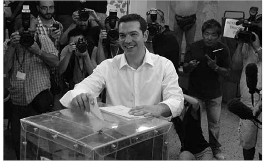
ალექსის ციპრასი ("სირიზა")

არჩევნების შედეგებს მოუთმენლად ელის ევროპაც, რომელზეც დიდ გავლენას იქონიებს ბერძნული ელექტორატის მიერ გაკეთებული არჩევანი. როგორც გერმანიის კანცლერმა ანგელა მერკელმა ჯერ კიდევ შაბათს განაცხადა, საბერძნეთის არჩევნებს უდიდესი მნიშვნელობა აქვს, რათა ის