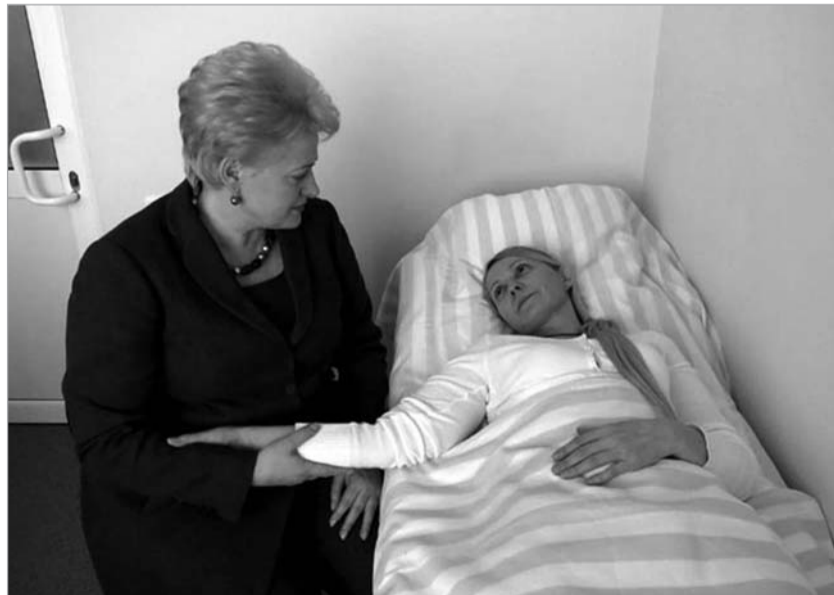
ტიმოშენკო ლიგვის პრეზიდენტმა დღია კრიმზაუსკაიტემ მოინახულა

ხუთი დღის წინ სააგენტო «ბლუმბერგისთვის» მიცემულ ინტერვიუში, კვირის ბოლოს კი ჟურნალ "ტაიმთან" საუბარში მან განაცხადა, რომ შეიძლება შეინწყოს ექსპრემიერი და თავისი პოლიტიკური კონკურენტი, მაგრამ ეს კანონის დარღვევა იქნება. პრეზიდენტის განსახილველად ეს საკითხი მხოლოდ მაშინ დადგება, როდესაც სასამართლო სისტემაში, სტრასბურგის ჩათვლით, ტიმოშენკოს საქმეების განხილვა დამთავრდება. ამით მან ფაქტობრივად აღიარა, რომ უკრაინაში ტიმოშენკოს გამართლების შანსი არ არის. პარალელურად, პრეზიდენტი იანუკოვიჩი არღვევს უდანაშაულობის პრეზუმპციას და აცხა-