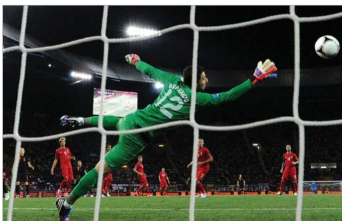
ვან დერ ვაარტის გოლი ლამაზი და უსარგებლო იყო