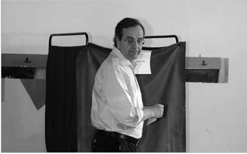
ანტონის სამარასი ("ახალი დემოკრატია")