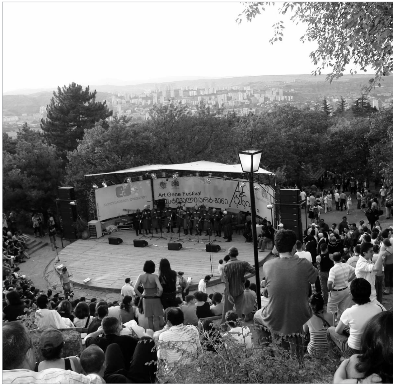
საქართველოს რეგიონებიდან მოს 7 საათიდან დაიწყება, მაგრამ ლის კარი ამ დრომდე ჩარაზულია. ჩამოსულთა ღონისძიებები საღამოს არ ნიშნავს, რომ ეთნოგრაფიულ ტრადიციისამებრ "არტგენი" მთელი

ვინც არტგენის ბიოგრაფიას ადევნებს თვალს, ისიც ემასხვრება, რომ ცხრანლიანი ისტორიის მქონე ფესტივალი თბილისის ფარგლებს გარეთ რამდენიმე წლის წინ გავიდა - აღმოჩნდა, რომ იმ კუთხეებს, რომლებიც ჩვენი ფოლკლორის პატარ-პატარა სამშობლოებად მიიჩნევა, დედაქალაქზე არანაკლებად სჭირდება მისი სცენიდან მოსმენა. ასეც ხდება - საქართველოს სხვადასხვა კუთხე ერთმანეთს ჯერ ხელოვნების გზით ეცნობა, შემდეგ კი ყველა ერთად თბილისის ეთნოგრაფიული მუზეუმისკენ მოემართება. თბილისის საფესტივალო დღეების პროგრამის პირველი ნაწილი სწორედ მათ ეთობა: 21 ივლისიდან 25 ივლისის ჩათვლით ფესტივალის სტუმრების წინაშე წარსდგებიან ფოლკლორული კოლექტივები და სახალხო რენვის წარმომადგენლები გურიიდან, კახეთიდან, იმერეთიდან, სამეგრელოდან, რაჭიდან, ქართლიდან, სამცხე-ჯავახეთიდან, აჭარაიდან, ქვემო და შიდა ქართლიდან, მცხეთა-თიანეთიდან, იმერეთიდან, ლეჩხუმიდან, თუშეთიდან, სვანეთიდან და პანკისიდან.