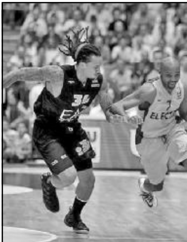
ში საოცარი გარდატეხა მოახდინა - პირველი ტაიმის 33:43 დათმობის შემდეგ მეტოქე 86:66 დაბობმა და სერია 3:1 მოიგო. ამით იტალიელებს საკუთარ ქომაგთა