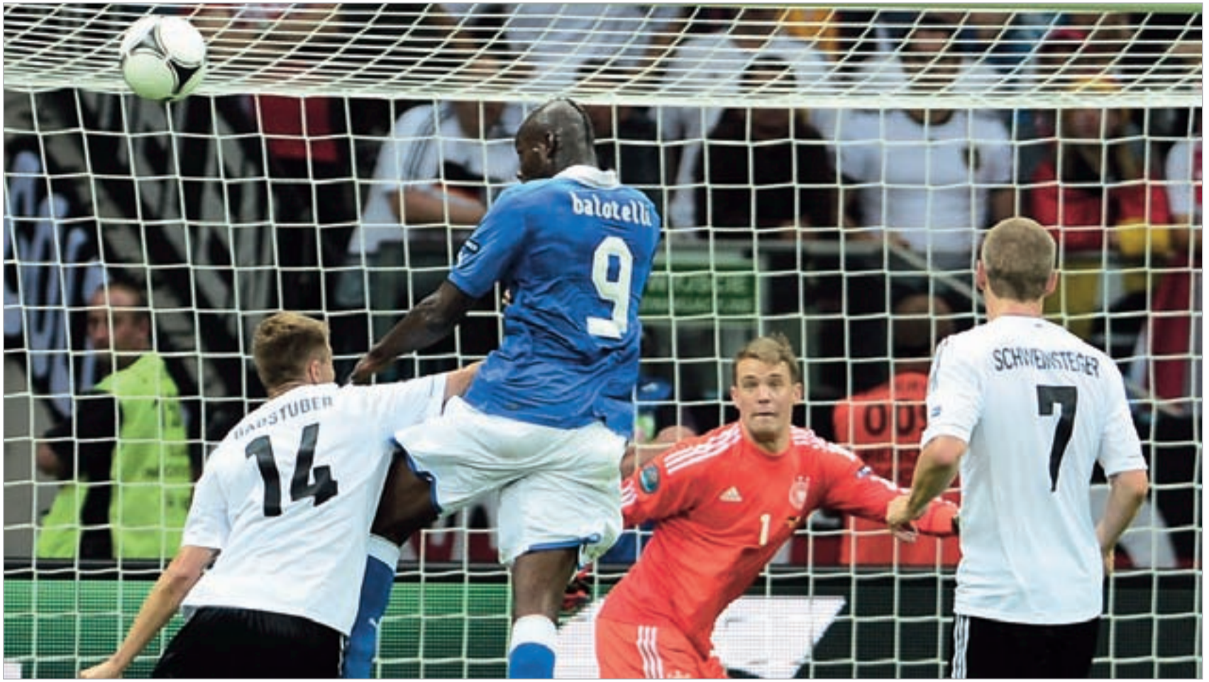
მარიო ბალოტელიმ დუბლი გაიფორმა

- ჯერ არა. "სიტის" ფანებს ვუყვარვარ და მათ არ დავალაპტებ. დარწმუნებული ვარ, "სიტის" კომპეტს ისევე ვუყვარები, მიუხედავად იმისა, რომ ინგლისის ნაკრები გამოვთიშეთ ევროპის პირველობას.