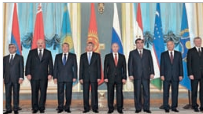
პრეზიდენტების ბოლო შეხვედრა მისში

სუთმაბთს, გვიან სალამოს კოლექტიური უსაფრთხოების ხელშეკრულების ორგანიზაციის წარმომადგენლებმა დაადასტურეს, რომ უზბეკეთისგან მიიღეს ოფიციალური ნოტა, რომლის თანახმადაც, ეს ქვეყანა გადის ამ სამხედრო-პოლიტიკური კავშირიდან. თავისთავად ამ ცნობაში მოულოდნელი და საკვირველი არაფერია, უზბეკეთი ხშირად იცვლის პოლიტიკურ ორიენტაციას და ამ სახელმწიფოს ერთხელ - 1999 წლიდან 2006 წლამდე - უკვე ჰქონდა დეტოვირებული კოლექტიური უსაფრთხოების ხელშეკრულება. მისი წევრობის ამ ბო-