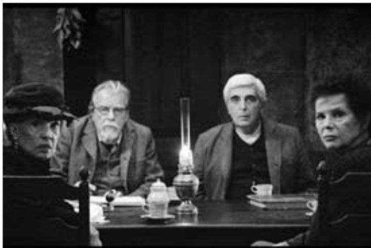
კადრი ფილმიდან "გელო და ჩრდილი"

ოს შემოქმედებიდანო. სამაგიეროდ, პრესის მონონება დაიმსახურა პორტუგალიელი რეჟისორის მანუელ დი ოლივეირას არასაკონკურსო ფილმმა "გელო და ჩრდილი". არა მხოლოდ იმიტომ, რომ ამ 103 წლის რეჟისორს უკვე უფლება აქვს, რაც უნდა ის გადაიღოს. ფილმი აბსოლუტურად გამართულია აზრობრივად და დრამატურგიულად, თუმცა კი სტატიკური მიზანსცენებით იფარგლება, რის გაგებაც და მიღებაც მაყურებელს არ გასჭირვებია. ოლივეირა რეალობასთან კავშირს არ კარგავს: იგი ლაპარაკობს იმაზე, რაც დღეს პორტუგალიაში და ზოგადად, ევროპაში მტკივნეულია და პრობლემატური. ლაპარაკობს მათხოვრების თემაზე, რაც იმდენად თვალსაჩინოა უკვე, რომ მათ უსაქმურებს, ანდა მარგინალებს ვეღარ უწოდებ. ფილმის გმირები უბრალო ადამიანები არიან, რომელთაც დიდი ფული გვერდს უვლის: მისი გამოუმუშავება შეუძლებელია პატიოსანი შრომით, ის შეიძლება მხოლოდ მოიპარო. ამავე