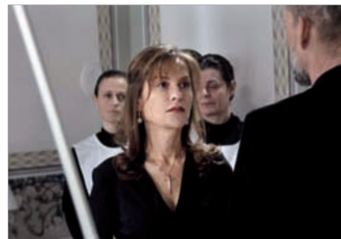
კადრი ფილმიდან "მძინარე მზეთუნახავი"

ვენეციის 69-ე კინოფესტივალი დღეს მთავრდება და ფინალის მოლოდინის რეჟიმში მყოფი კინომოყვარულები გამარჯვებულის გამოცნობას ცდილობენ. ხუმრობენ, რომ წლევედელი საერთაშორისო კინოფესტივალების გამარჯვებულად რატომღაც საპენსიო ასაკს მიტანებული რეჟისორები გვევლინებიან: ძმები ტვიანები - ბერლინში, მიხაილ ჰანეკე - კანში, ჟან-კლოდ ბრისო - ლოკარნოში. ხოლო მას შემდეგ, რაც ვენეციაში ტერენს მალიკის ფილმი ფაქტობრივად ჩავარდა, ფესტივალის მონაწილე ცოცხალ კლასიკოსთა შორის, ლომის მოპოვების პრეტენდენტად შეიძლება მარკო ბელოჩიო ჩაითვალოს. მის "მძინარე მზეთუნახავი"