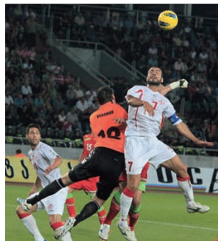
ვერემკოს კართან საქართველოს ნაკრებს რამდენიმე საკლდე მომენტი ჰქონდა