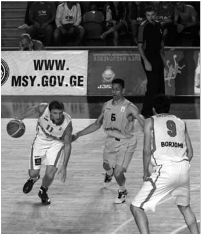
მანუ ერთ თამაშში საშუალოდ 2.9 ჩაჭრას აკეთებს