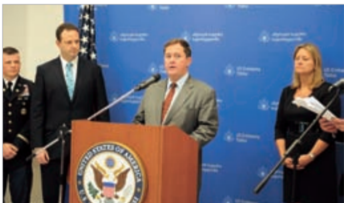
გაზრძალვა მე-3 გვერდზე

აშშ-ს უწყებათაშორისმა დელეგაციამ, რომელსაც დემოკრატიის, ადამიანის უფლებათა და შრომის საკითხებში ამერიკის სახელმწიფო მდივნის მოადგილე თომას მელია ხელმძღვანელობდა, საქართველოში სამდღიანი ვიზიტი დაასრულა.