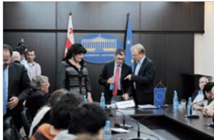
გაზრძალვა მე-2 გვერდზე

ევროსაბჭოს საპარლამენტო ასამბლეის წინასწარჩვენო დელეგაცია საქართველოს 1 ოქტომბრამდე დაემშვიდობა. დელეგაციის ხელმძღვანელმა ლუკა ვოლონტემ პარლამენტში მედიას უთხრა, რომ არჩევნების დღეს საქართველოში გაფართოებული შემადგენლობით იქნებიან.