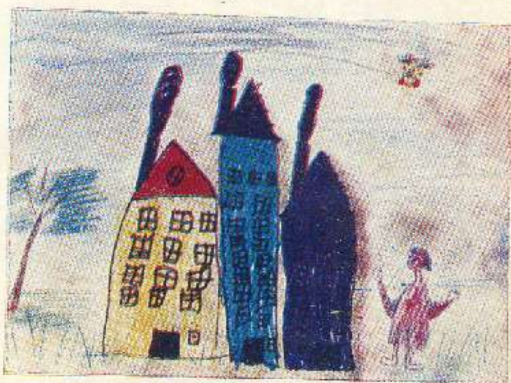
ნინო ფარაძე. „სახლი“. 6 წ.