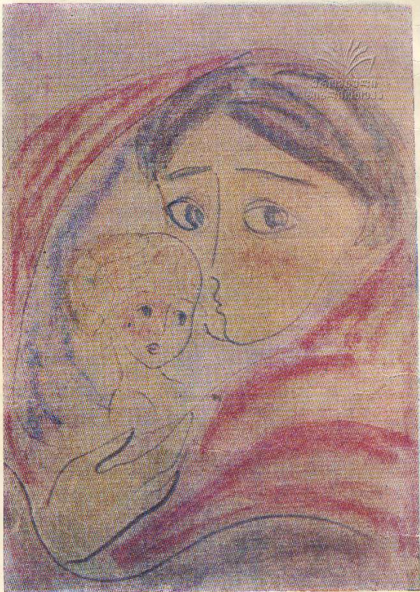
ნადია კუჩუბა. „სტოვლის დედა“ — შვედეთისათვის.