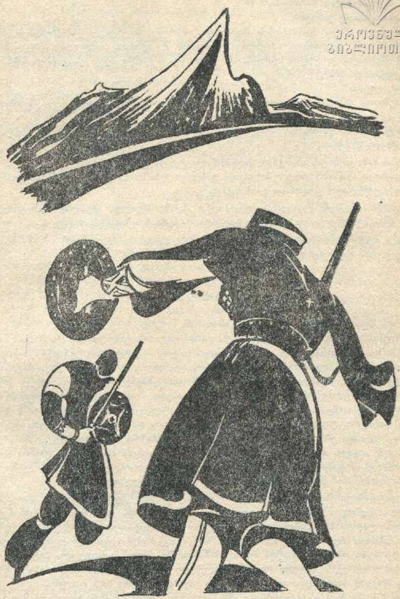
მხატვარი ტარიელ ვარტაგავა

საქართველოს საბავშვო ლიტერატურის საქართველოს