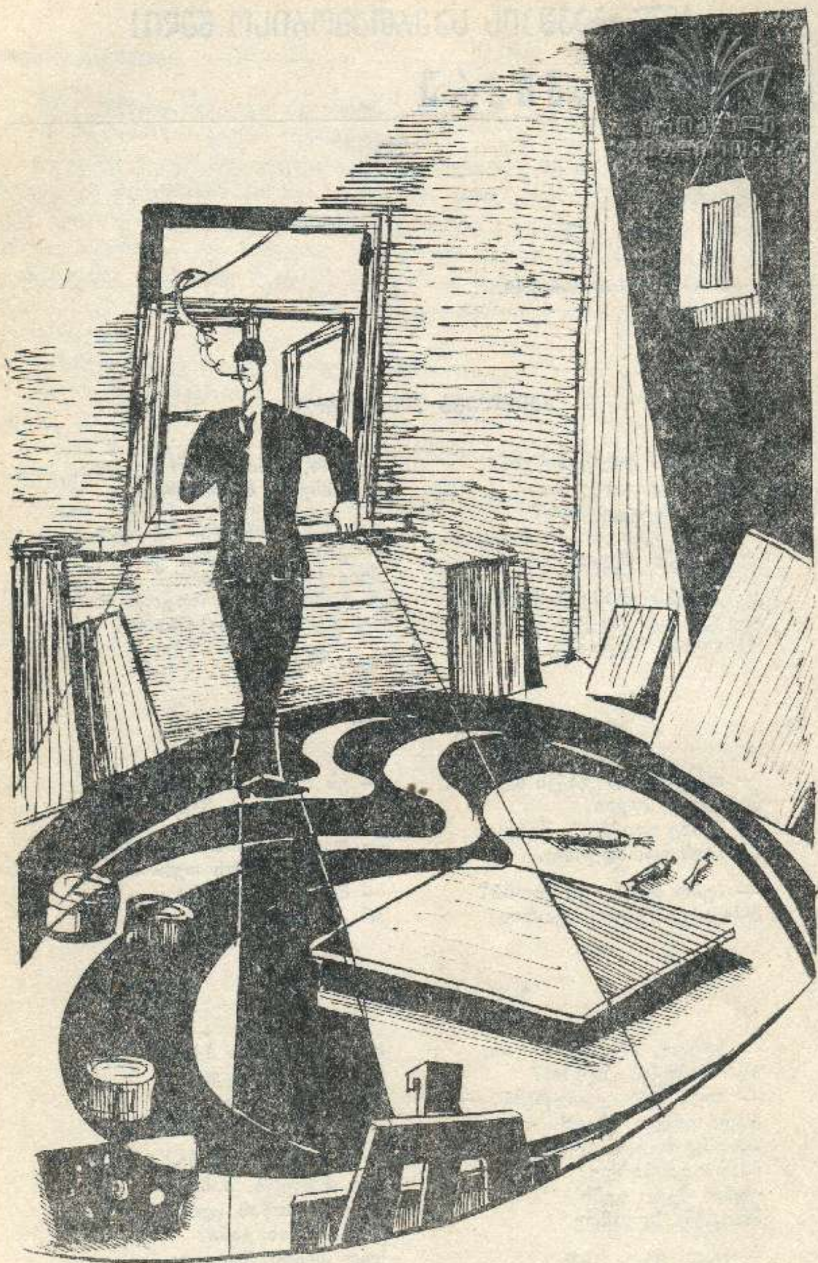
მხატვარი ავთანდილ ვერტაგაძე