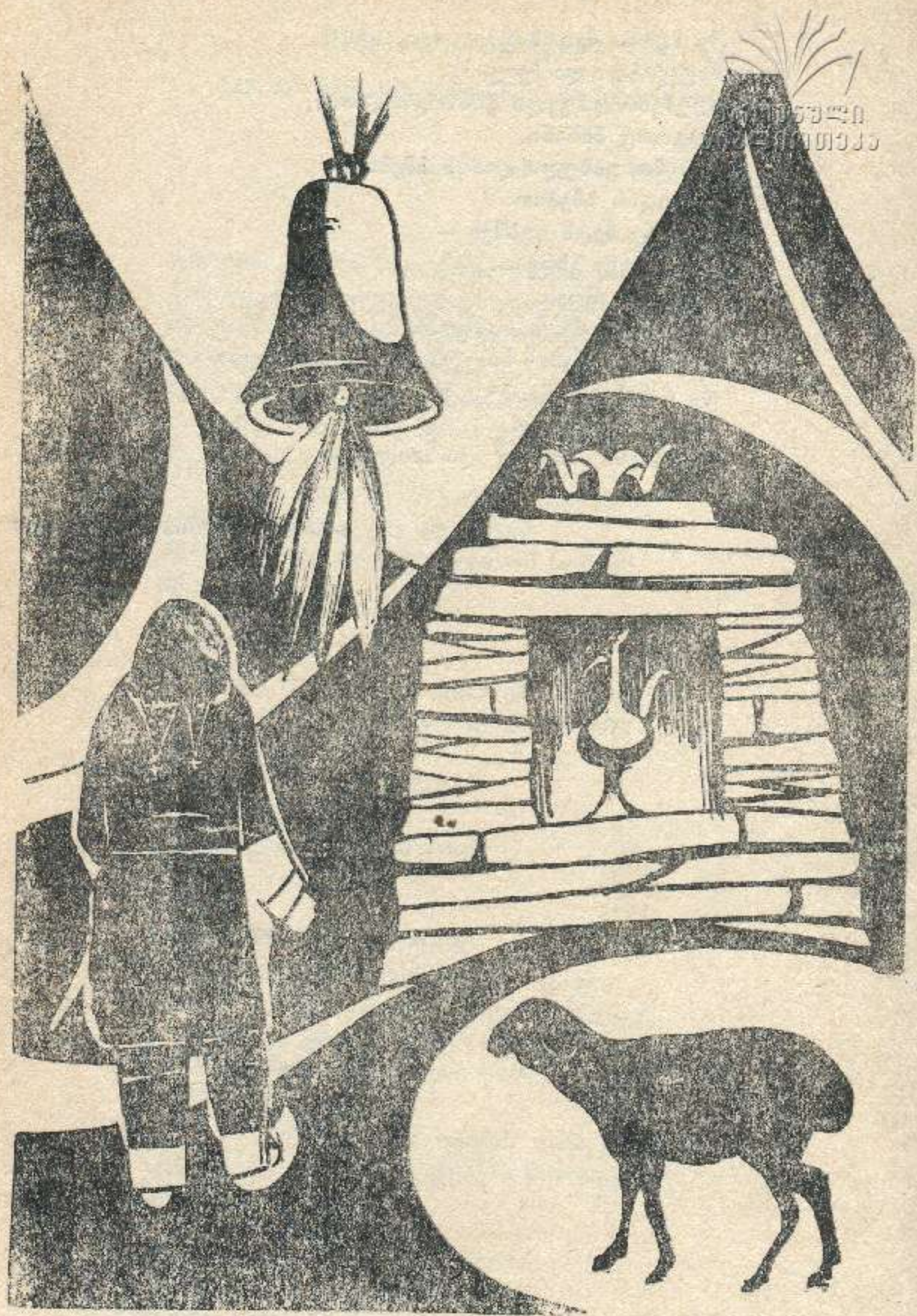
მხატვარი ტარიელ პარტაგაძე