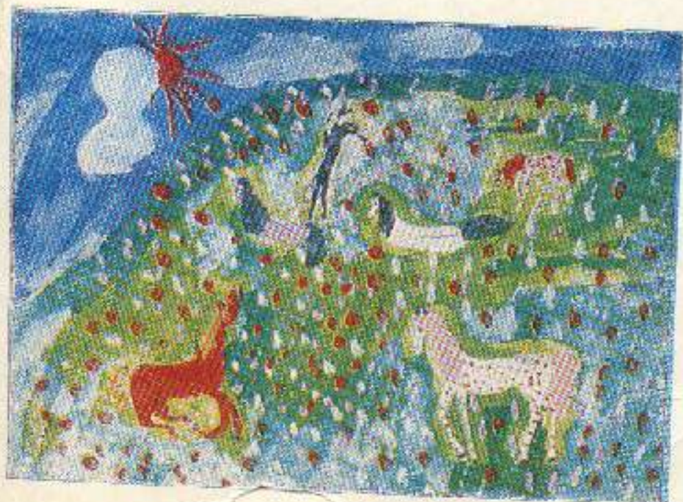
ხათუნა ხოშტროძე. „ცხვები“. 8 წ., 57-ე ხაზ. ხკ.