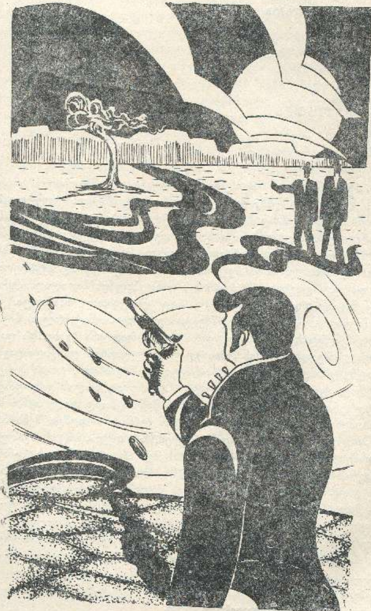
მხატვარი ბ. ვართაგავა. ა. კუზბინი. „გასკოლა“