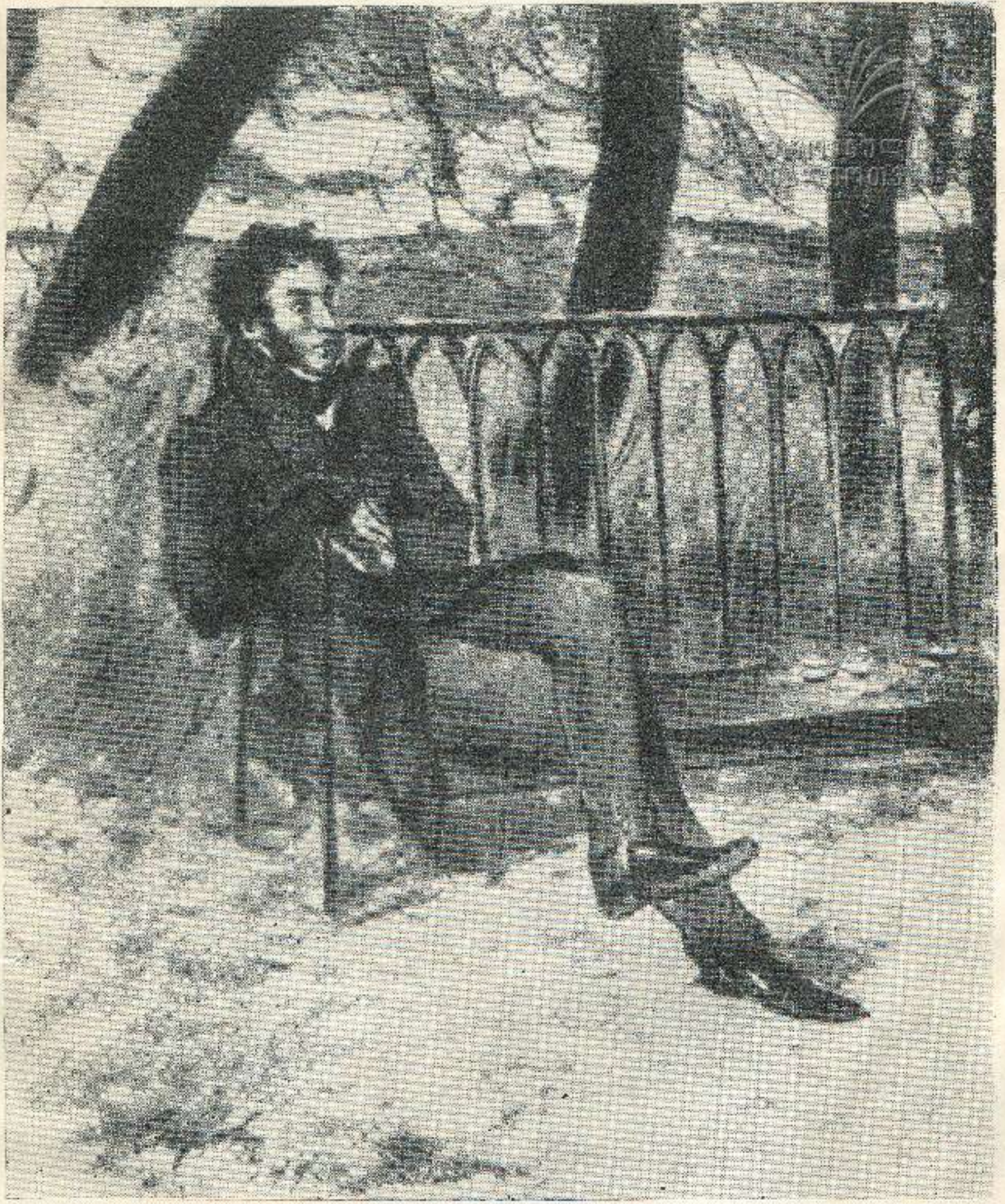
3. სპარსი, პუშკინის სომხლში, 1899 წ.