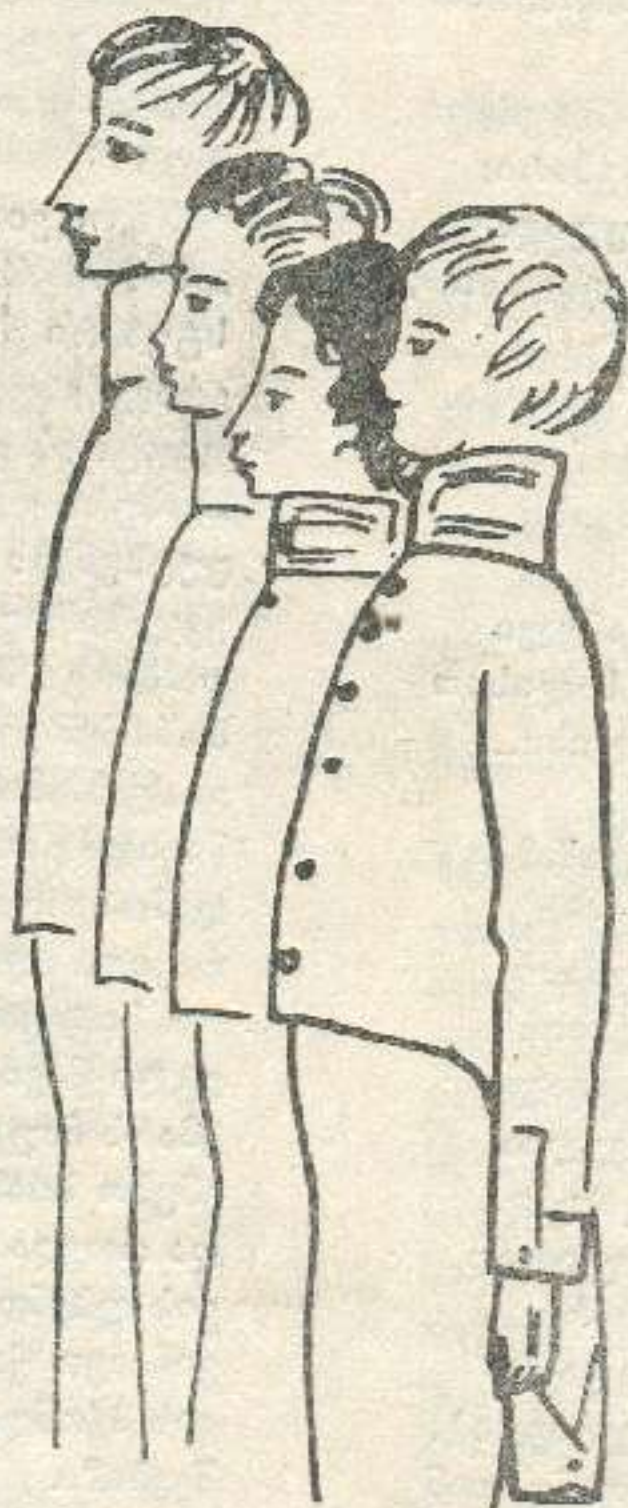
ნადია რუხივა. „თავისუფლად მოაზროვნე ლი- ცინისტები — კიბეალებიკირი, კუზაკინი, კუზაკინი, დელვიგი“. 1969