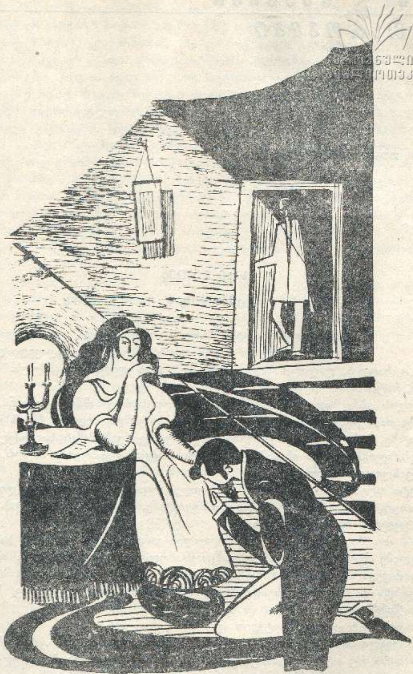
მხატვარი ბ. ვართაგავა. ა. კუზკინი. „კალგატონი-გლდისის გოგო“.