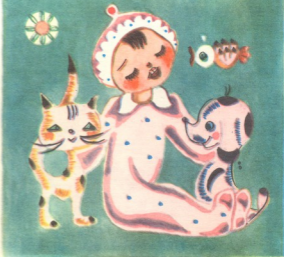
ნახატი ღარეჯან შილ აშვილისა

სიცოცხლის ლურჯი თვალია, — უნდა იცნობდეთ სოფიოს!