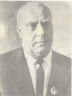
ილიო მიჩახელიძე (1903—1978)