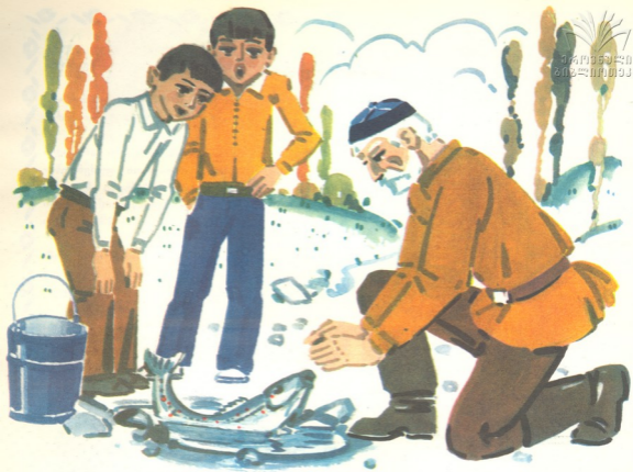
ნახატი ელშარდ აგოშაძისა

ბავშვებმა პაპას დაუჯერეს და ორაგული წყალში შეაცურეს.