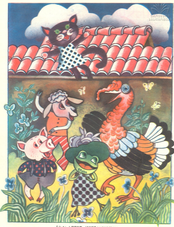
ნახტი სოფიო კინწურაშვილისა