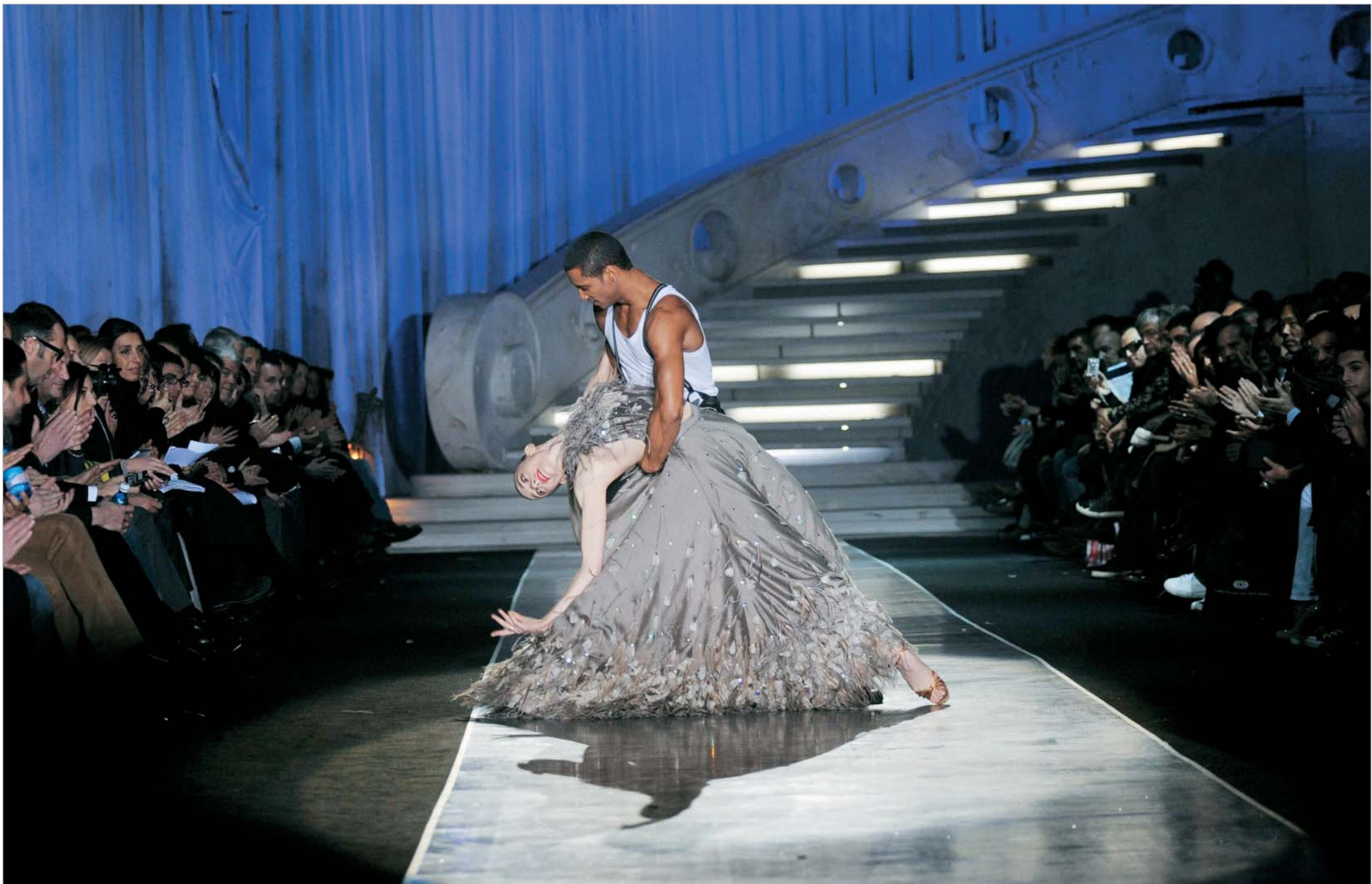
მილანში მამაკაცის ტანსაცმლის მოდის ყოველწლიური კვირეული მიდინარეობს. ამჯერად კვირეულის ორგანიზატორებმა სანახაობის გამალაზება მოინდომეს და შოუ ბალეტის მოცეკვავეებმა გახსნეს. ეს პერფომანსი დეფილეს სტუმრებს ძალიან მოეწონათ. პრესამ კი ნოვაცია დადებითად შეაფასა. ამრიგად გამორიცხული არაა, რომ ამიერიდან მაღალი მოდის კვირეულები მსგავსი წარმოდგენებით გაიხსნას ხოლმე.