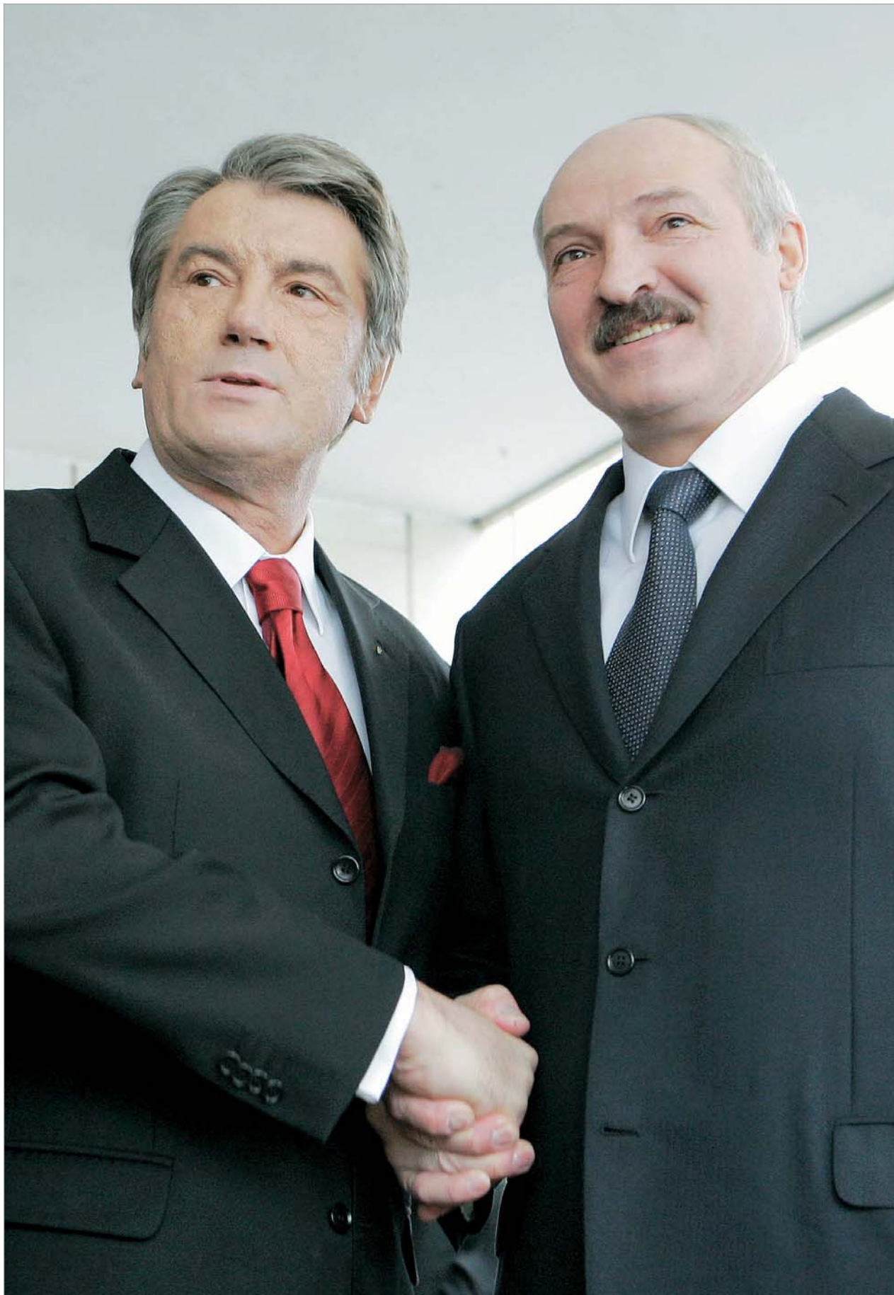
იუშჩენკომ და ლუკაშენკომ ერთმანეთის მიმართ რევერანსები არ დაიშურეს.

კო ერთგვარად შეიცვალა. მან მაქსიმალური გააკეთა იმისთვის, რომ ანტიდასავლური განდევნილი პრეზიდენტის იმიჯი გამოეწმორებინა. მან დაიწყო ევროკავშირთან ურთიერთობების დალაგება, უფრო მეტ დროს უთმობდა ევროპულ მედიასთან ურთიერთობებს და თითქმის მთლიანად თქვა უარი ანტიდასავლურ განცხადებებზე. ალექსანდრე ლუკაშენკომ სექტემბერში, საპარლამენტო არჩევნებამდე ცოტა ხნით ადრე, ევროკავშირის სურვილების შესაბამისად, ცნობილი ბელარუსი ოპოზიციონერები პატიმრობიდან გაათავისუფლა. ამის სანაცვლოდ ევროკავშირმა ბელარუსის პრეზიდენტსა და მაღალჩინოსნების ნაწილს ევროკავშირის ქვეყნებში შესვლაზე შეზღუდვები მოუხსნა. მიმდინარე თვეში კი საერთაშორისო სავალუტო ფონდმა ეკონომიკის მხარდასაჭერად მინსკს 2,5 მილიარდი დოლარის კრედიტი გამოუყო.