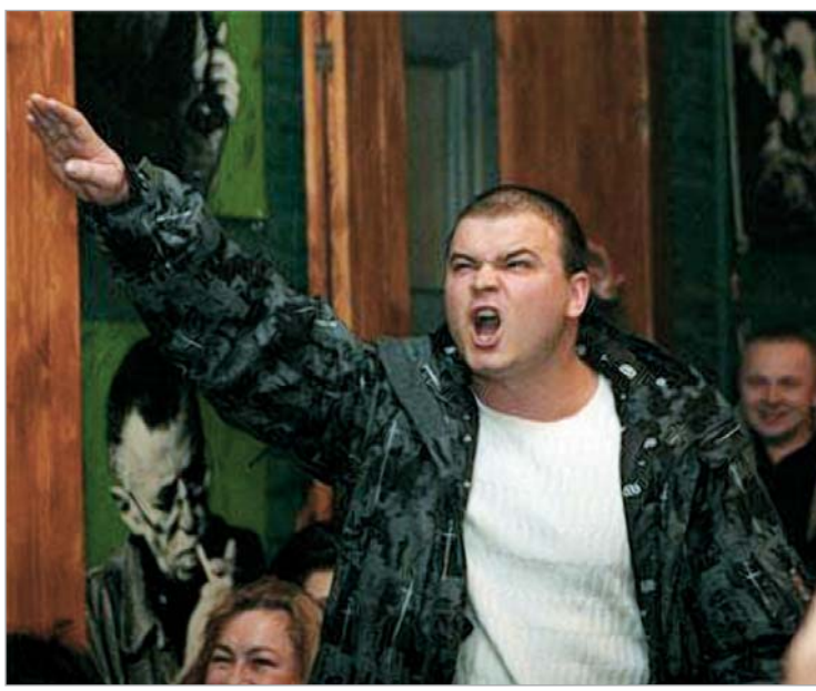
ნეონაციისტური ორგანიზაცია "ფორმატ 18"-ის ლიდერს სასამართლომ განაჩენი გამოუტანა.