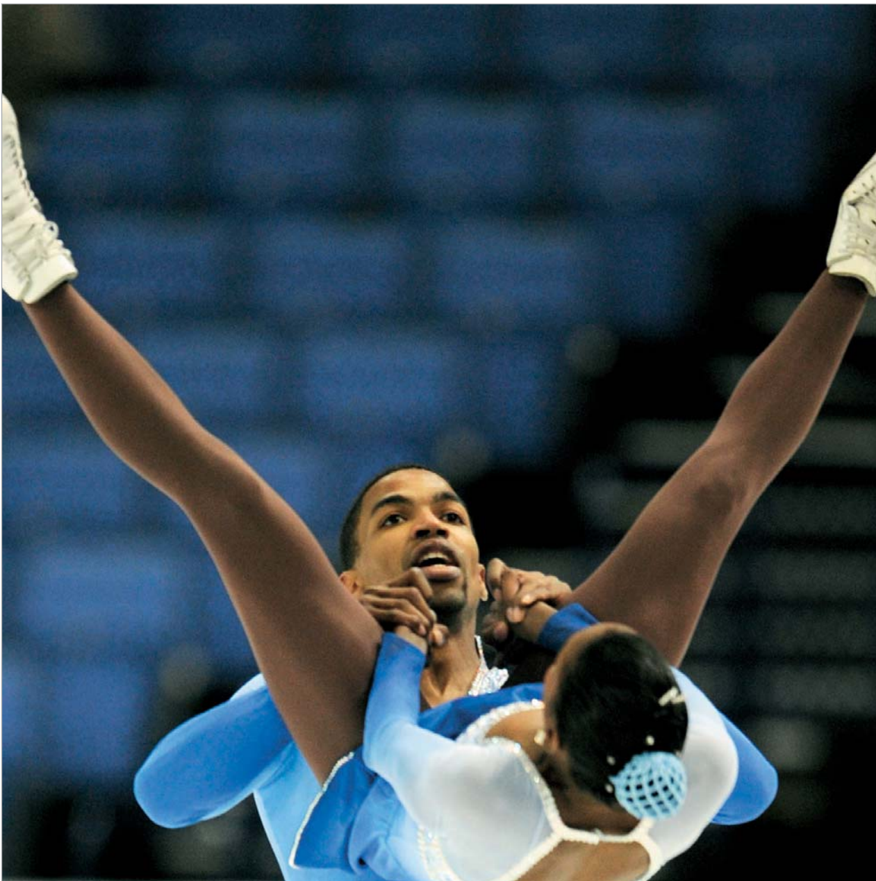
AFP - 2009

From January 2009, "24 Saati" newspaper is a corporate partner of "The New York Times" and enjoys the right to use information, photo and graphic base of "The New York Times".