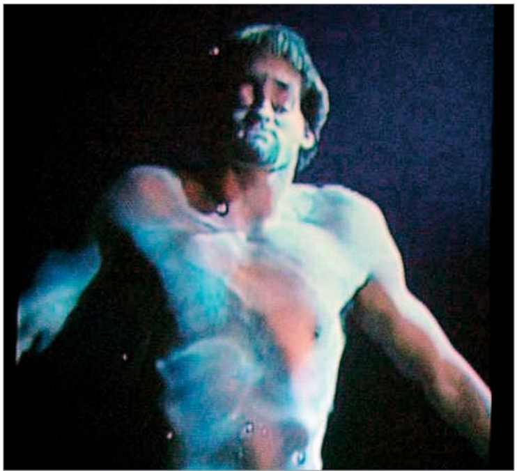
კადრი ვიდეოდან "მესიები"

ბილ ვიოლა თანამედროვე ვიზუალური კულტურის ერთ-ერთი დიდი პერსონაა. სიტყვა "დიდი" მის შემთხვევაში სულაც არ გახლავთ გადაჭარბებული შეფასება. ის უკვე კლასიკა ვიდეოხელოვნებისა და მისი ნამუშევრები - ერთგვარი ხატებანი ამ მიმართულებაში. ბილ ვიოლამ ვიზუალური ხელოვნების ერთ-ერთი ყველაზე ახალი მიმართულება მხატვრული ინტელექტით, ესტეტიკური კრიტერიუმებითა და ნოვატივებით გაამდიდრა. მისი