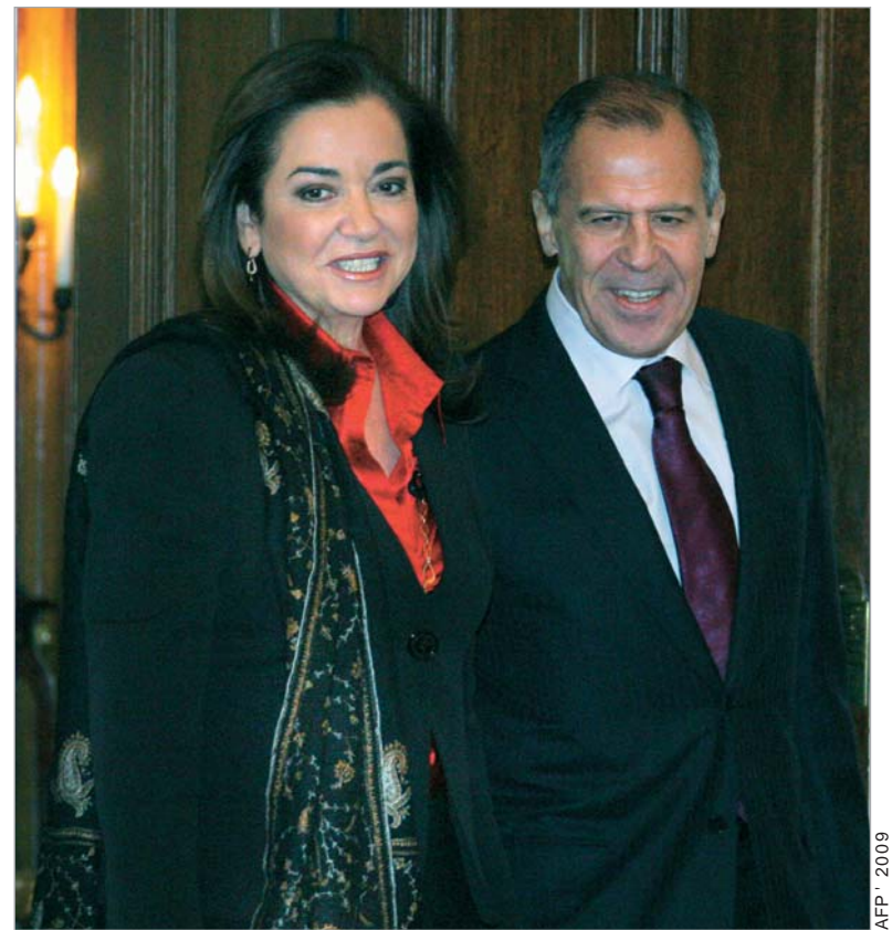
ბაკოიანისი და ლავროვი