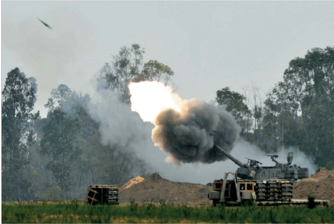
ისრაელის არმიის აკრძალული ჭურვების გამოყენებაში ედება ბრალი.

ისრაელის არმიის სარდლობა კი ამ დრომდე ამტკიცებდა, რომ ლაზაში სამკვირიანი სამხედრო ოპერაციის მსვლელობისას მხოლოდ საერთაშორისო სამართლით დაშვებული იარაღი გამოიყენებოდა. თუმცა, ჯერჯერობით ისრაელის სამხედრო სარდლობას არ მიუ-