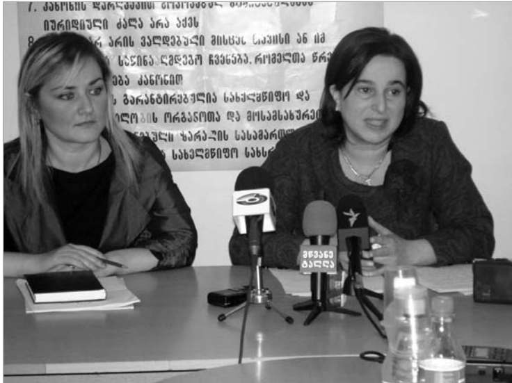
სტრასბურგის სასამართლოში "კონსტიტუციის 42-ე მუხლის" იურისტებმა ორი საქმე მოიგეს.