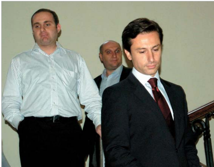
"ქრისტიან-დემოკრატები" სადაზღვევო პოლიტიკას აკრიტიკებენ.