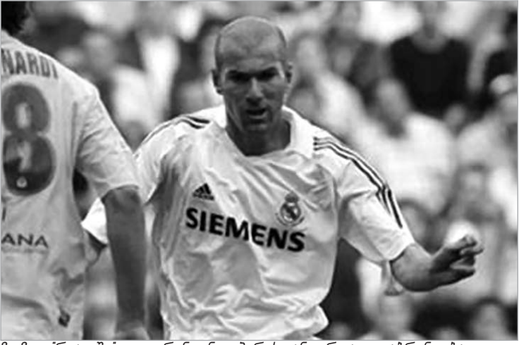
ზიზუ "რეალში" ფლორენტინო პერესთან ერთად დაბრუნდება

გავრცელებული ინფორმაციის მიხედვით, პერესი ზიდანს "სამეფო კლუბის" ახალგაზრდული შემადგენლობის მწვრთნელობას შესთავაზებს. ამ თანამდებობის დაკავების სურვილი თავად ზიდანმაც გამოთქვა. ახლა ზიზუ მადრიდში ცხოვრობს და მისი შვილები