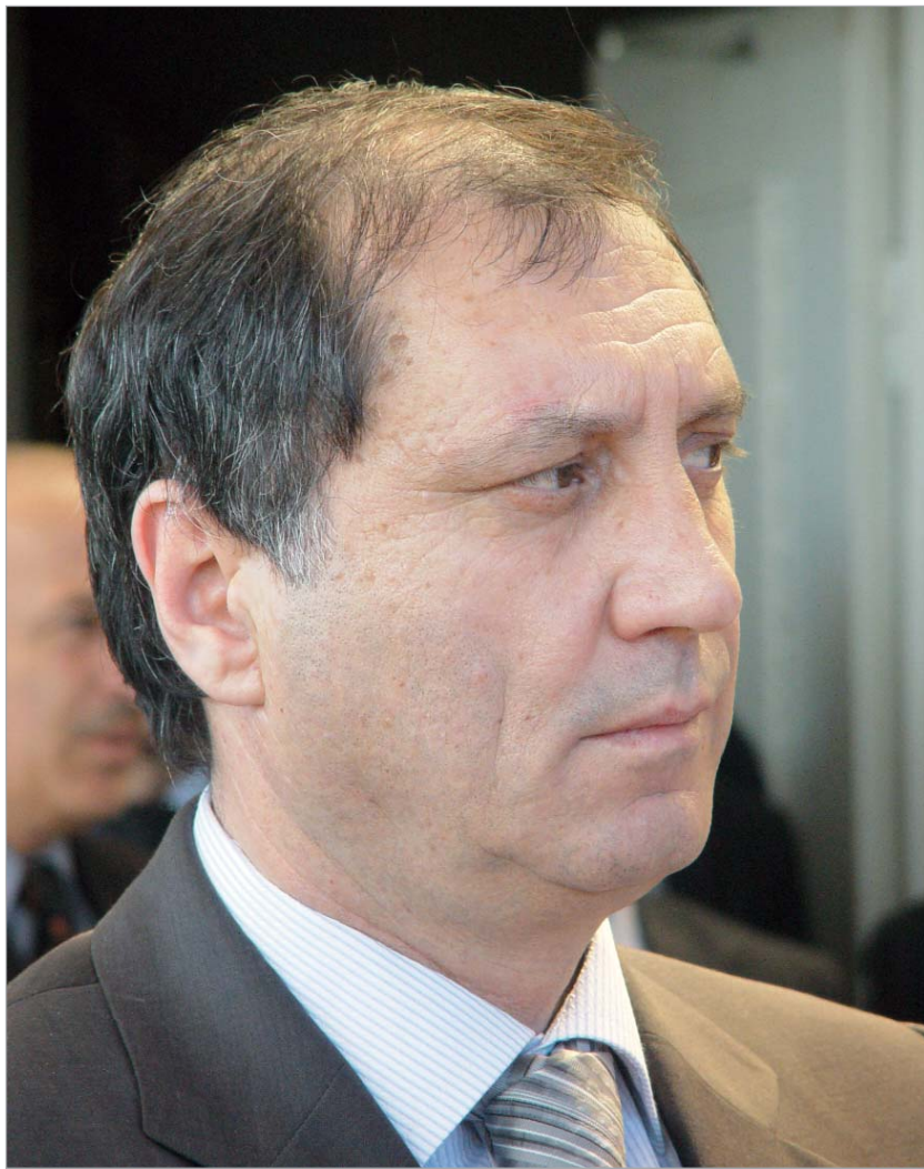
სერგეი შამბა ვარდისფერი მოლოდინები უკვე შავ ფერებში გადადის.

"ამის ნიშნები კი ჯერ არ შეინიშნება. მართალია, პატარ-პატარა სასიკეთო სიმპტომები გამოიკვეთა, მაგრამ ძნელი სათქმელია, როგორ განვითარდება მოვლენები," - სერგეი შამბა გუშინდელ განცხადებას დავით დარჩიაშვილი დიდი ოპტიმიზმით არ შეხვედრია.