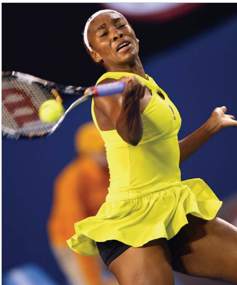
ვინუს უილიამსი ავსტრალიის ღია პირველობას გამოეთიშა

ქალთა ტურნირში განსაკუთრებული სხვა არაფერი მომხდარა. ფავორიტებმა იოლად გაიმარჯვეს და აგრძელებენ ასპარეზობას. თუმცა ყველამ იოლად როდი მოიგო. სერენა უილიამსი ბენჯზე გადაურჩა მარცხს. ჟიზელა დულკოსთან მატჩში სერენა პირველ სეტს 0:3 აგებდა, თუმცა ძალები მოიკრიბა და სეტი მოი-