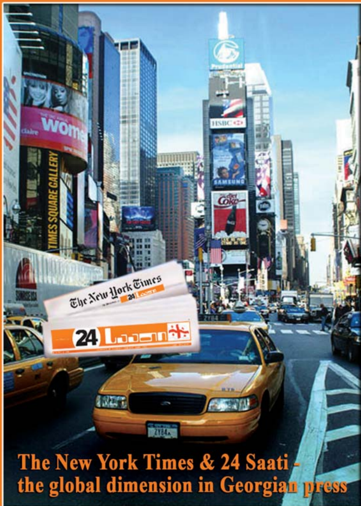
The New York Times & 24 Saati - the global dimension in Georgian press