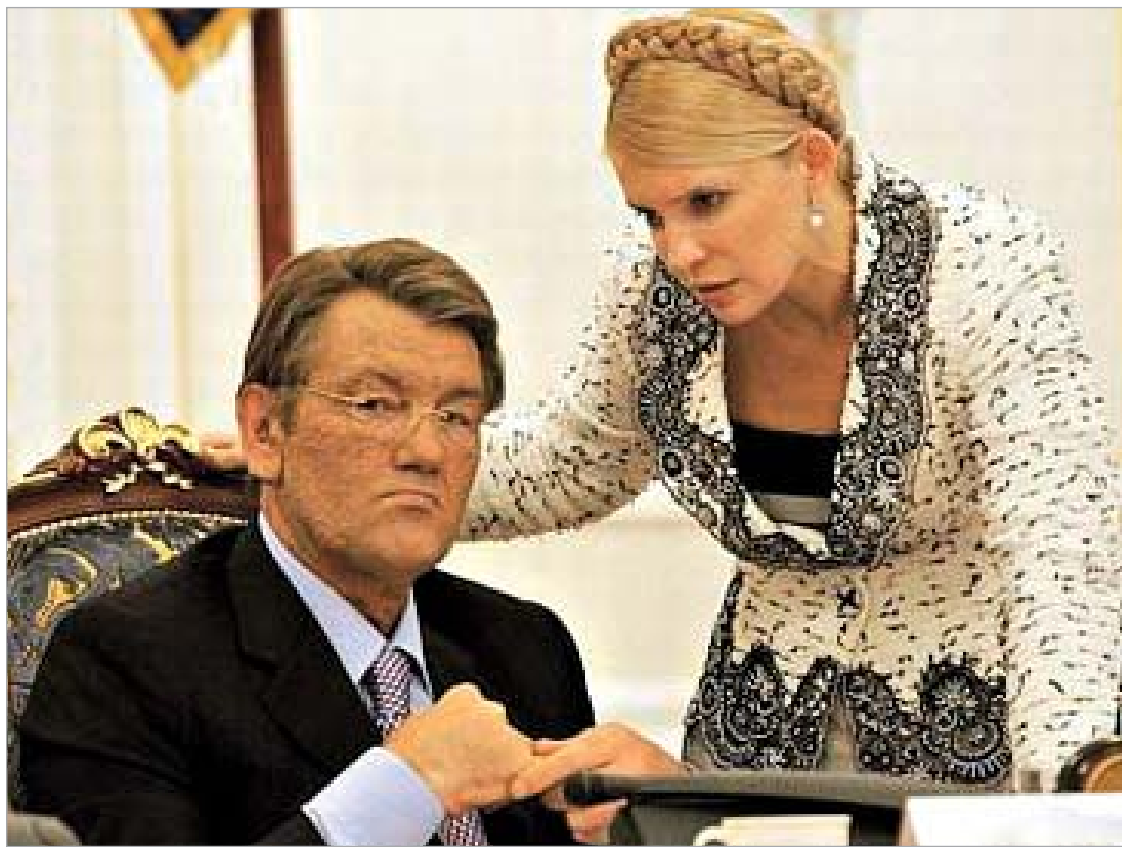
იულია ტიმოშენკო რუსეთთან მიღწეულ შეთანხმებას კბილებით იცავს.

ტიმოშენკო არ გამოიციხავს, რომ მასზე ზეწოლას საბჭოს დღევანდელ სხდომაზეც განახორციელებენ. "კარგად მოგეხსენებათ, როდესაც გაზის კრიზისი იყო, ეროვნული უშიშროებისა და თავდაცვის საბჭოს სხდომა არავის მოუწვევია. მაგრამ, როდესაც მოცემული მომენტისთვის ყველა კორუფციული შუამავალი გვყავს ჩამოშორებული, პარა-