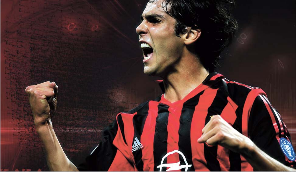
კაკა - "მილანის" პატრიოტი თუ პრაგმატულად მოაზროვნე ვარსკვლავი?

დავიწყეთ პირველი. ამ შემთხვევაში ორი მაგალითი გვაქვს. პორტუგალიელმა კრიშტიანუ რონალდუმ ყველანაირ შეთავაზებაზე უარი თქვა, არ მიიღო "რეალის" სარფიანი წინადადება და "მანჩესტერში" დარჩა. იგივე გააკეთა კაკამ, როდესაც უარი თქვა "სიტის" გადასვლაზე და "მილანის" ერთგულება დაამტკიცა. ამ ორ შემთხვევაში რონალდუ უფრო ადეკვატურად იქცევა. პორტუგალიელი პატროსნად ასრულებს კონტრაქტით დაკისრებულ მოვალეობას, გულისამაჩუყებელი გამოსვლებით არ ეფიცება "მანჩესტერს" ერთგულებას