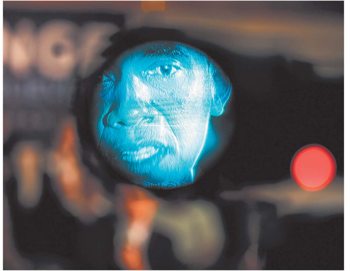
Barack Obama, seen in a television camera's viewfinder, has had to recalibrate his focus as events like the financial crisis supervened.