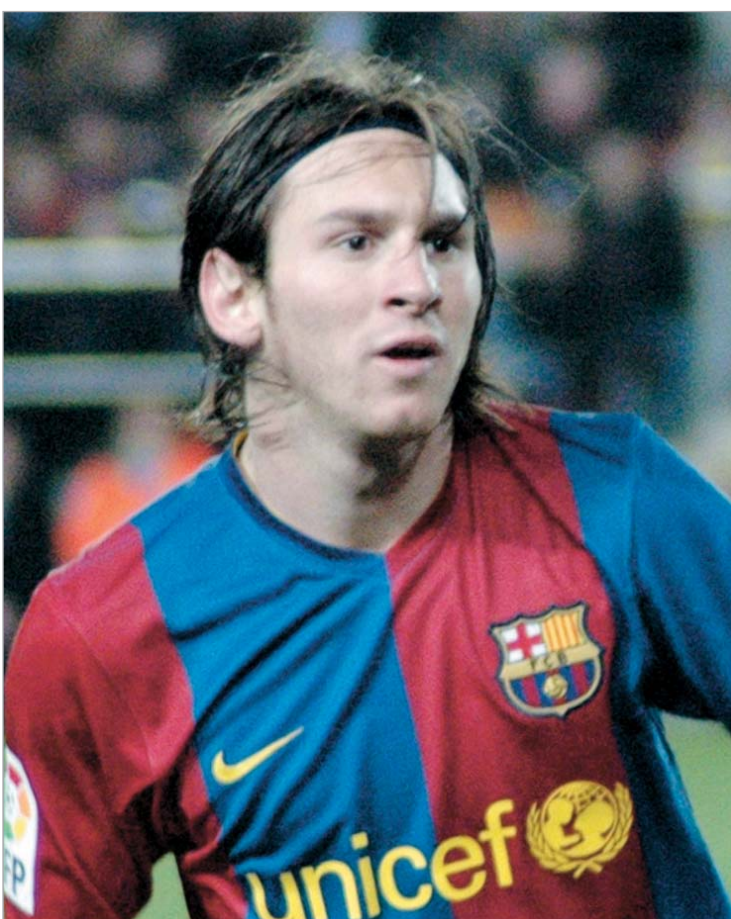
"ბარსელონა" ჩემი სახლია; - ამბობს მესი

არ დავტოვებ. არსებობს ერთადერთი შანსი იმისა, რომ მე "ბარსელონა" წავიდე. ეს მხოლოდ მაშინ მოხდება, თუ კლუბიდან გამავდები. "ბარსელონა" ჩემი სახლია", - აცხადებს 21 წლის არგენტინელი, რომელსაც ამ სეზონში კატალონიური გრანდის შემადგენლობაში 14 გოლი აქვს გატანილი. მათ შორის ორი შაბათის მატჩში "ნუმანსიას" კარში გაიტანა.