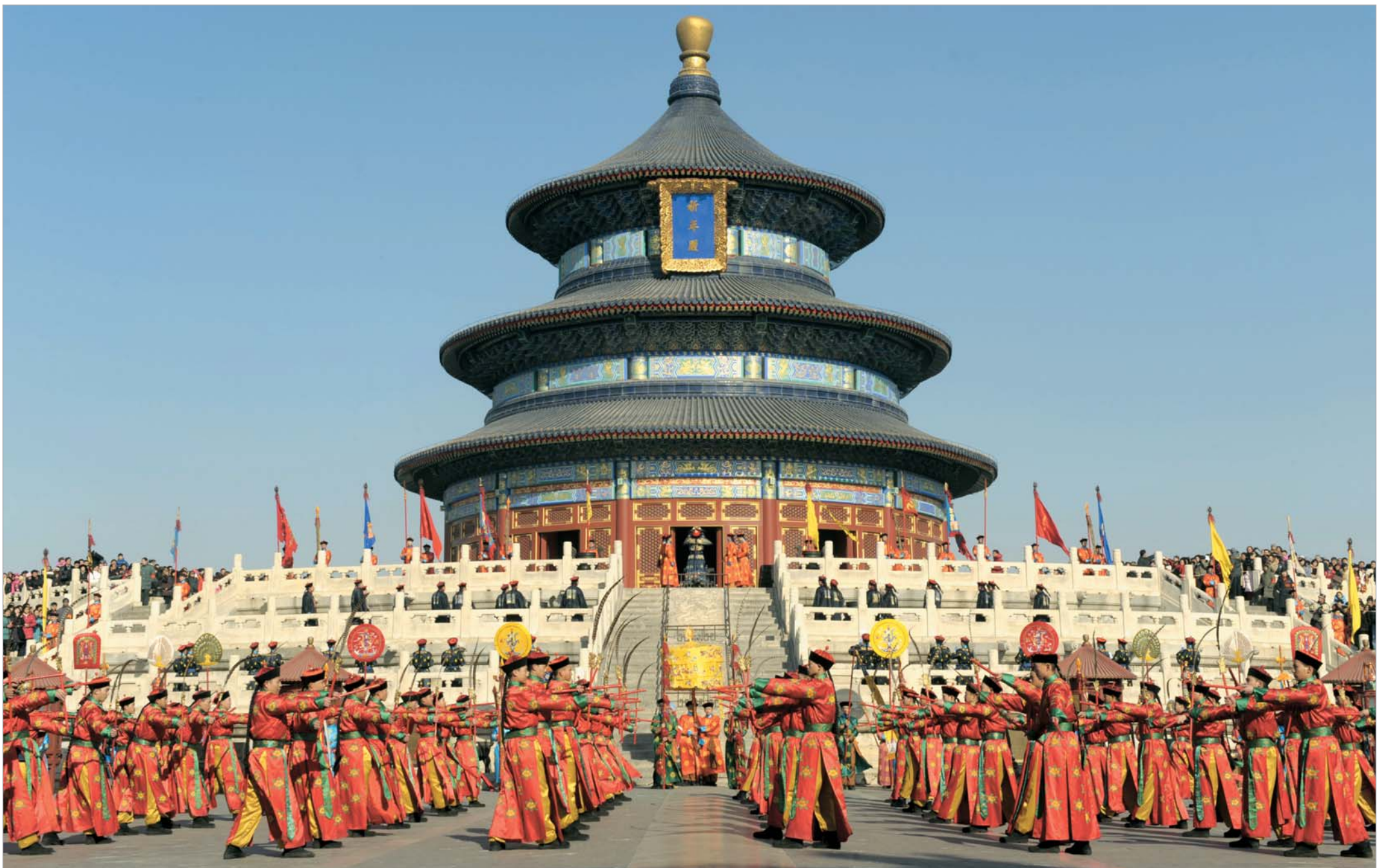
გუშინ სრულიად ჩინეთი ახალ წელს ზეიმობდა. ღამით, ზუსტად თორმეტზე ახალ ხარის წელიწადს შაშხანებით შეხვდნენ. დღისით კი ქალაქებში დიდი საზეიმო პროცესიები დაიწყო. ტრადიციულ სამოსში გამოწყობილი ათასობით ჯარისკაცი, მოცეკვავე და ჟონგლიორი ჩინეთის იმპერიის სიდიადეს აგონებდა მნახველს.