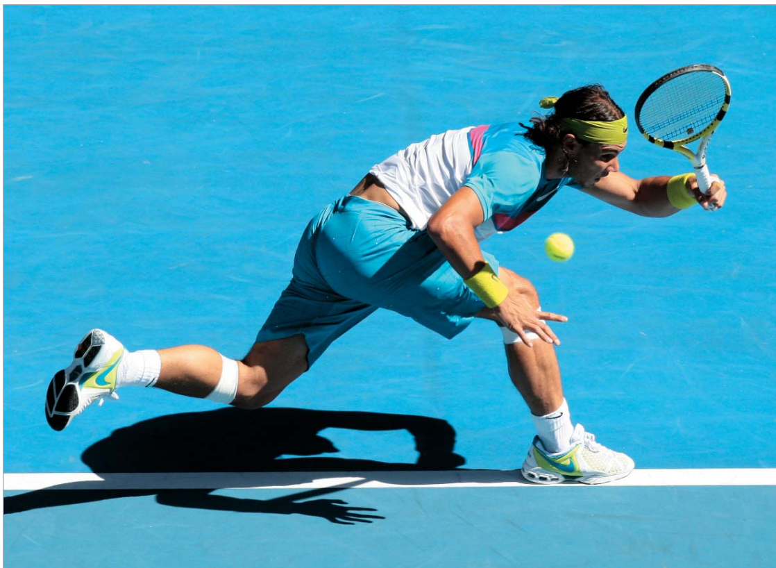
ნადალი წინ მიიწევს

გუშინდელი დღის მთავარ მატჩად კი ენდი მიურეისა და ფერნანდო ვერდასკოს დაპი-