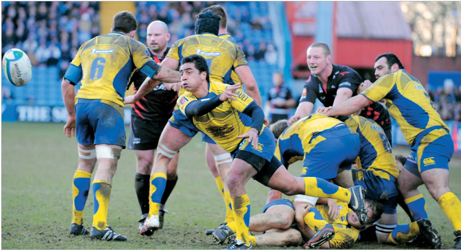
ზირაქაშვილის "კლერმონისის" მოგებას წარუმატებელი აღმონიონი

"ჩელენჯ ქაფს" კი მხოლოდ ხინჩაგაშვილმა უნია