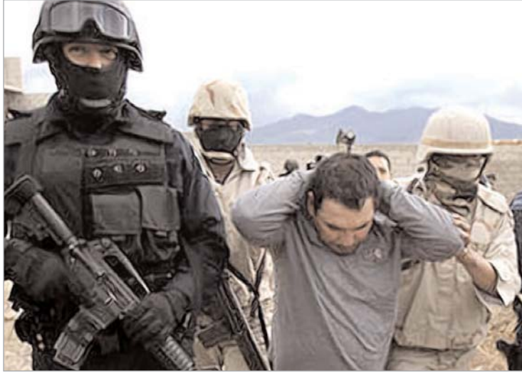
დააკავეს მსხვილი ნარკობარონის დამხმარე, რომელმაც 300 ადამიანზე მეტი მკვლელობა აღიარა.

მექსიკელმა სამართალდამცველებმა დააკავეს მსხვილი ნარკობარონის დამხმარე, რომელმაც 300 ადამიანზე მეტი მკვლელობა აღიარა. მისივე თქმით, მოკლულთა ცხედრებს ის მყავას ასხამდა.