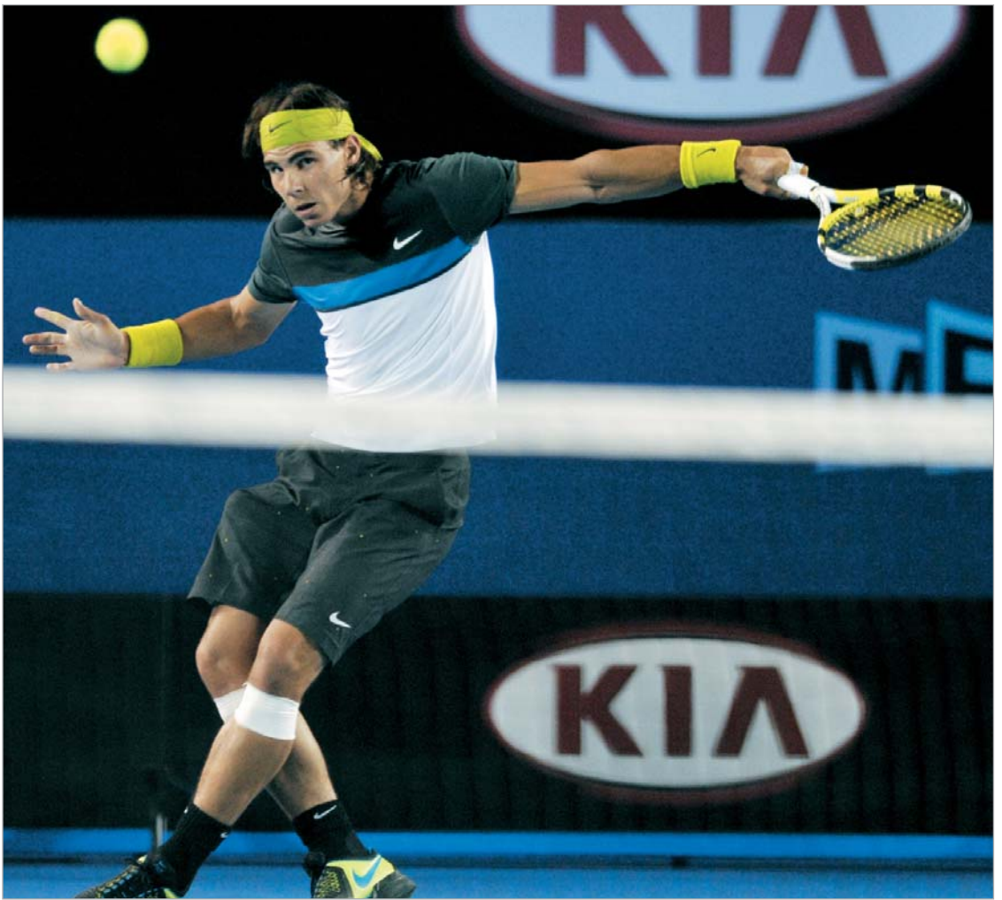
ნადალი ტურნირის ფავორიტია

სერენამ და დემენტიევამ სწორედ გუშინ მოიპოვეს ნახევარფინალში თამაშის უფლება. თუ რუსს მეოთხედფინალის მოსაგებად ოფიცირ არ დაუღვრია, სერენამ ბევრი იბრძოლა და სამსეტიანი მატჩის გამართვაც დასჭირდა. დემენტიევას მეტოქე იყო ესპანელი კარლა სუარეს ნავარო, რომელიც წლებადელი ავსტრალიის ღია პირველობის აღმორჩენადაც უნდა ჩავთვალოთ. ესპანელმა ტურნირს გამოთმა ანა ჩაკევატაძე და ვენუს უილიამსი, თუმცა დემენტიევას წინააღმდეგ ვერაფერს გახდა. მშვენიერ ფორმაში მყოფმა რუსმა ჩოგბურთელმა სუარეს ნავარო თითქმის უშანსოდ დატოვა - მეტოქეს ორ სეტში მოუგო (6:2, 6:2). ამის შემდეგ კუზნეცოვასა და სერენა უილიამსის ჯვრიც დადგა. თამაში დაძაბული გამოდგა. პირველი სეტი რუსმა 7:5 მოიგო და მცირე უპირატესობას მეორეშიც ფლობდა,