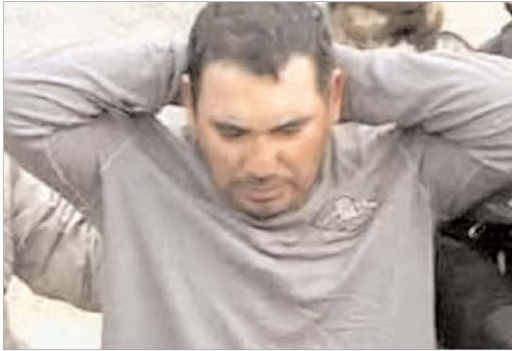
დააკავეს მსხვილი ნარკობარონის დამხმარე, რომელმაც 300 ადამიანზე მეტი მკვლელობა აღიარა.

CNN-ის ინფორმაციით, დაპატიმრებულმა სანტიაგო მეზა ლოპესმა დეტალურად მოყვა, თუ როგორ ასრულებდა მისი ბოსის, მექსიკის ყველაზე გავლენიანი ნარკობარონის - ტეოდორო გარსია სიმენტალისა, მეტსახელად "თოს", დავალებებს. "მე ვასრულებდი "თოს" ყველაზე ცხელ საქმეებს," - განუცხადა სამართალდამცველებს ლოპესმა. მისივე თქმით, ბოსის შეკვეთით ის კლავდა იმ პირებს, რომლებმაც "გაყიდეს" ან წინააღმდეგობა გაუწიეს "თოს".