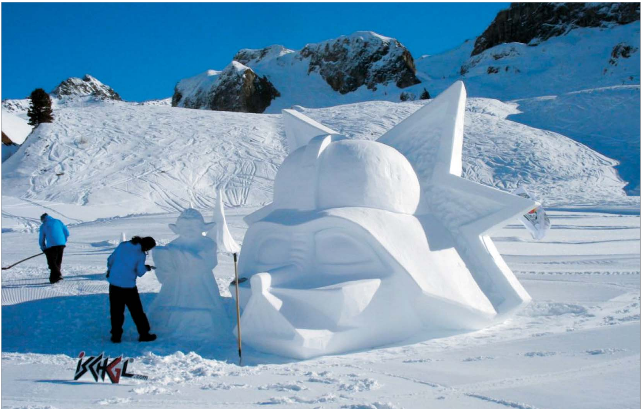
ავსტრიაში მსოფლიოს ყველაზე დიდი და სახელგანთქმული თოვლის არტფესტივალი მიმდინარეობს. ამჯერად დევიზი შემდეგია: "გამოსახე და გამოხატე თეთრში". ავსტრიულ სითეთრესა და სიცივეში მხატვრები მთელი მსოფლიოდან თუ არა, მთელი ევროპიდან მაინც ჩადიან. ოღონდაც ის მხატვრები, რომელთათვისაც სითეთრე უფორმოებს არ წარმოადგენს და არც სიცივეს, და კიდევ ის მოქანდაკეები, რომლებსაც მოცულობებთან ჭიდილი სიცივესა და აქსტრემულ გარემოშიც არ კარგავს აზარტს.