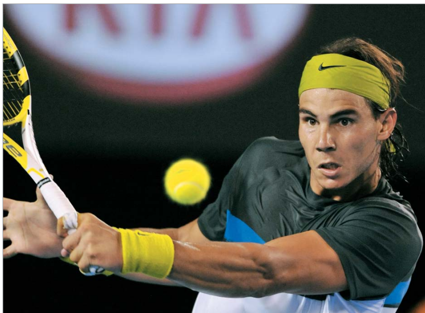
ნადალს ნახევარფინალში ძალიან გაუჭირდა

შეგახსენებთ, რომ ნახევარფინალამდე ნადალი ისე მივიდა სეტიც კი არ ქმონდა ნაგებული და ცხადია ვერდასკოსთან დუპირისპირებაში ფავორიტადაც მსოფლიოს პირვე-