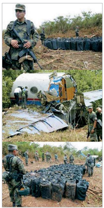
Gulfstream II ჩამოვარდნის ადგილი.

გაზეთის ინფორმაციით, ნარკოსკანდალში ჩართული გაერთიანებული ერების ორგანიზაციაც აღმოჩნდა. როგორც გამოცემა ირწმუნება, გამოძიებამ აჩვენა, რომ გაეროს ნარკოტიკების წინააღმდეგ ბრძოლის სააგენტო, რომ-