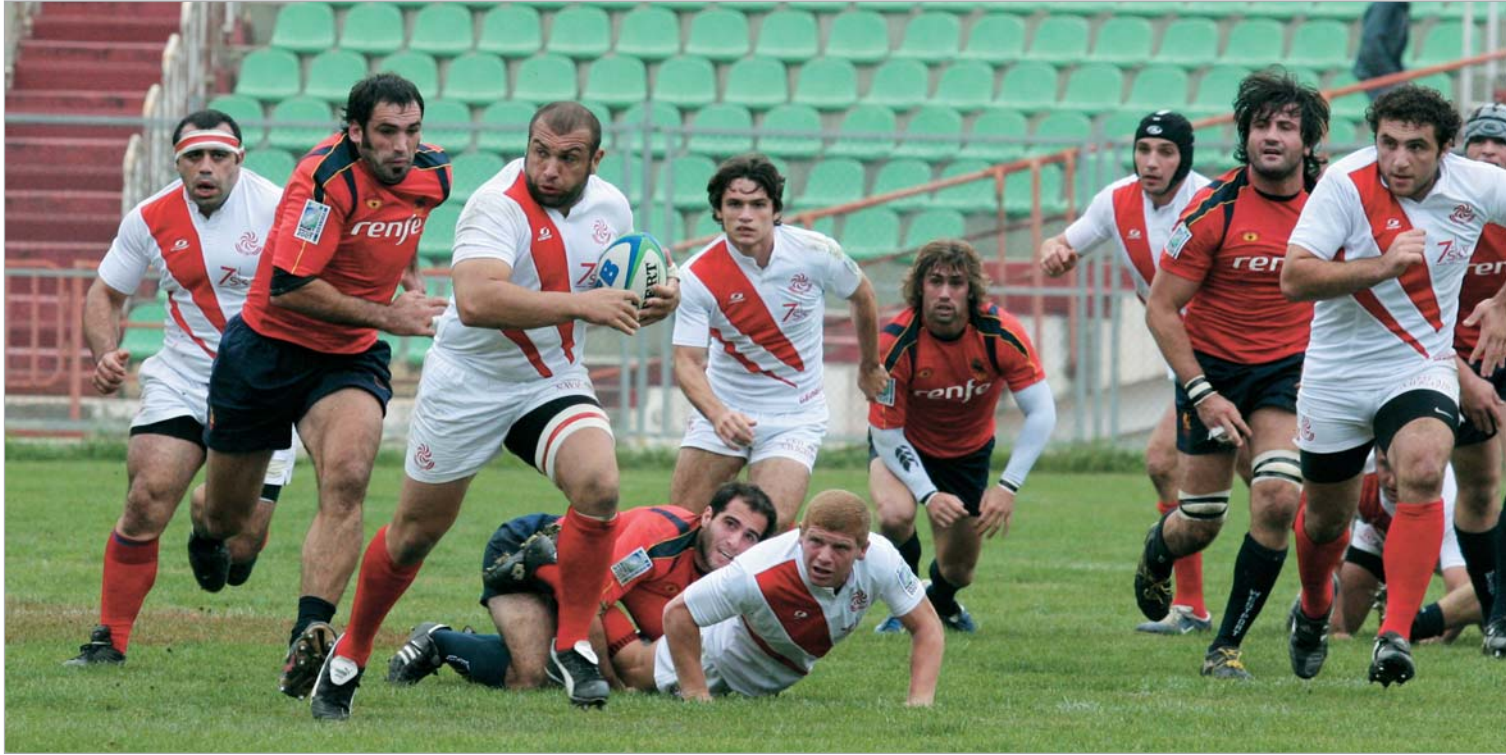
მარტო ნიურნბერგიდან, 7 თებერვალს ჰაიდელბერგში 250 ქართველი გულშემატკივარი აპირებს ჩასვლას.

გერმანიაში მცხოვრები ქართველობა 7 თებერვლის გერმანია-საქართველოს მატჩზე დასასწრებად ირაზმება. გერმანიის რაგბის კავშირში მთელი ქვეყნის მასშტაბით მცხოვრები ქართველი ემიგრანტებისგან შედის განაცხადები ბილეთების გამოყოფასთან დაკავშირებით. მარტო ნიურნბერგიდან, 7 თებერვალს ჰაიდელბერგში 250 ქართველი გულშემატკივარი აპირებს ჩასვლას. "ისინი მოდი-