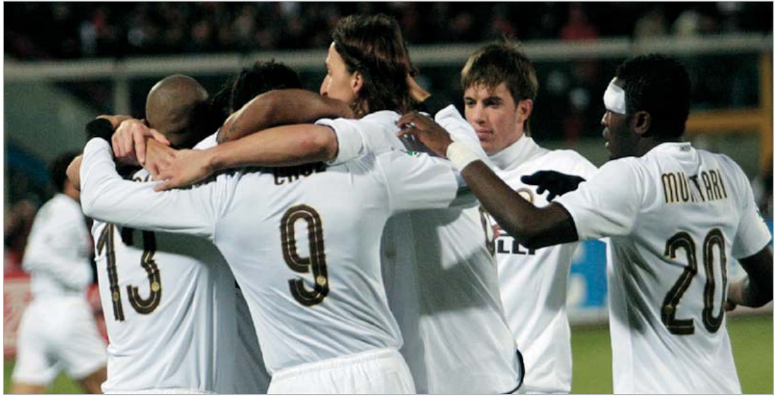
"ინტერი" თამაშებს განგებ აგებდა

არც ისე დიდი ხანია, რაც დაცხრა ვენეციის "კალჩოპოლისთან" დაკავშირებით. იტალიურმა საფეხბურთო სკანდალმა დიდი აურზაური გამოიწვია. მსოფლიო ფეხბურთის ორმა გრანდმა - "იუვენტუსი" და "მილანი" დიდად დაზარალდნენ, "ბებერი ქალბატონის" ყოფილ ბოსი ლუჩანო მოჯი კი გისოსებს მიღმა აღმოჩნდა. რამდენიმე წლის წინ აგორებულმა სკანდალმა კინალამ იტალიური ფეხბურთი დაასამარა. თუმცა აპენინელებმა ეს დარტყმა გადაიტანეს. თითქოს ყველაფერი მოგვარდა, იმ სკანდალით ყველამ იზარალა, მილანის "ინტერის" გარდა. მასიმო მორატის გუნდმა სწორედ იმ აურზაურის წყალობით მოიპოვა ჩემპიონის ტიტული, რომელიც მაშინ "იუვენტუსს" ჩამოართვეს.