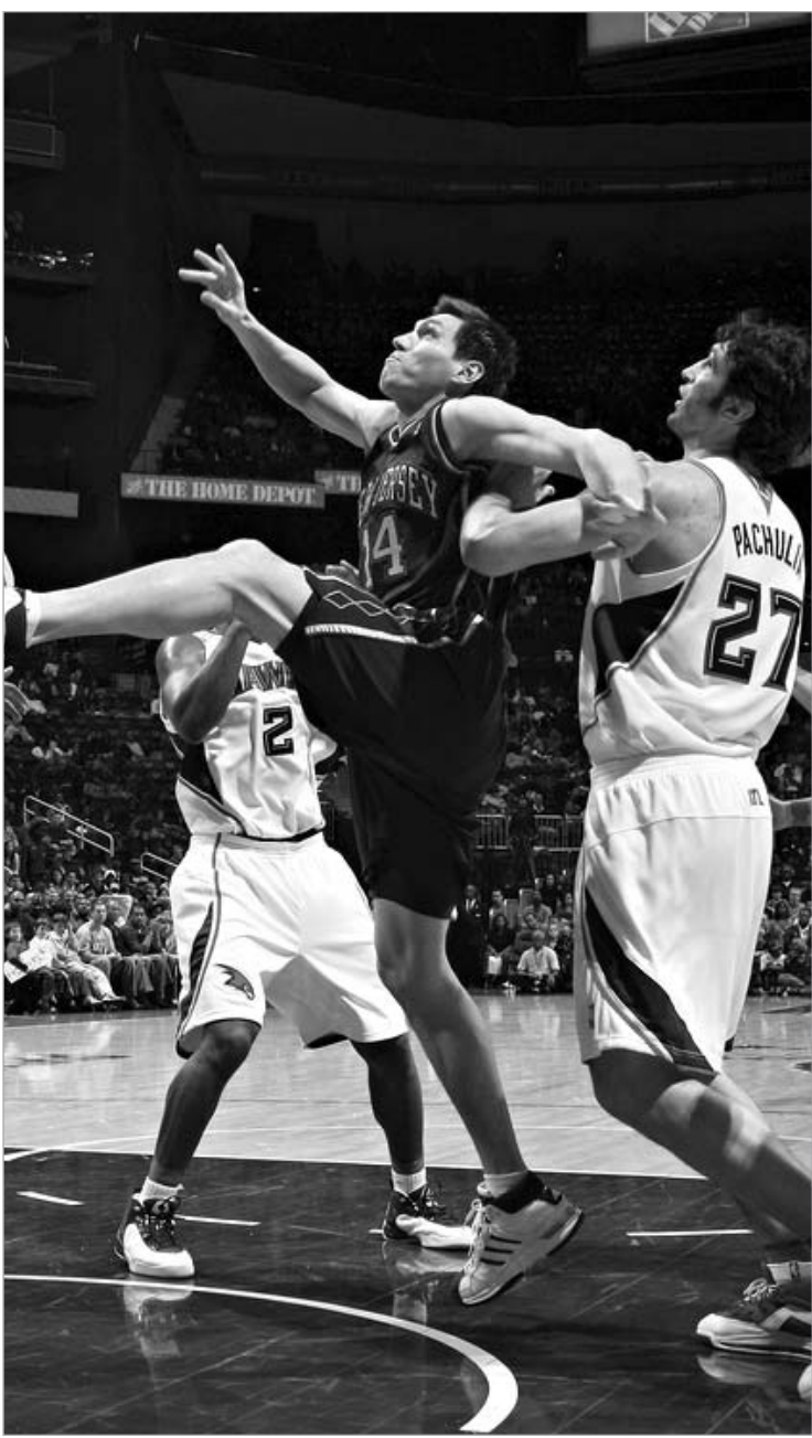
ფაჩულიამ კარტერის გუნდი დაამარცხა.