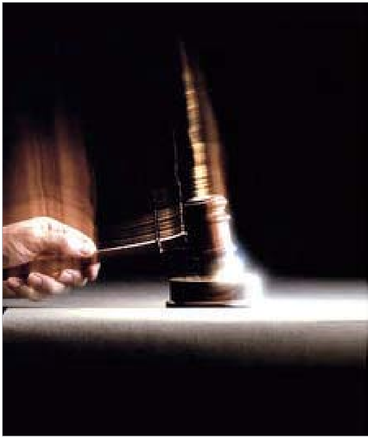
საერთაშორისო არბიტრაჟს 100-120-წლიანი გამოცდილება აქვს.

"ნებისმიერ განვითარებულ ქვეყანაში ბიზნესმენებსა და სახელმწიფოს შორის არსებული დავების ეფექტურად მოსაგვარებლად არბიტრაჟის ინსტიტუტი არსებობს. ძალზე პრე-