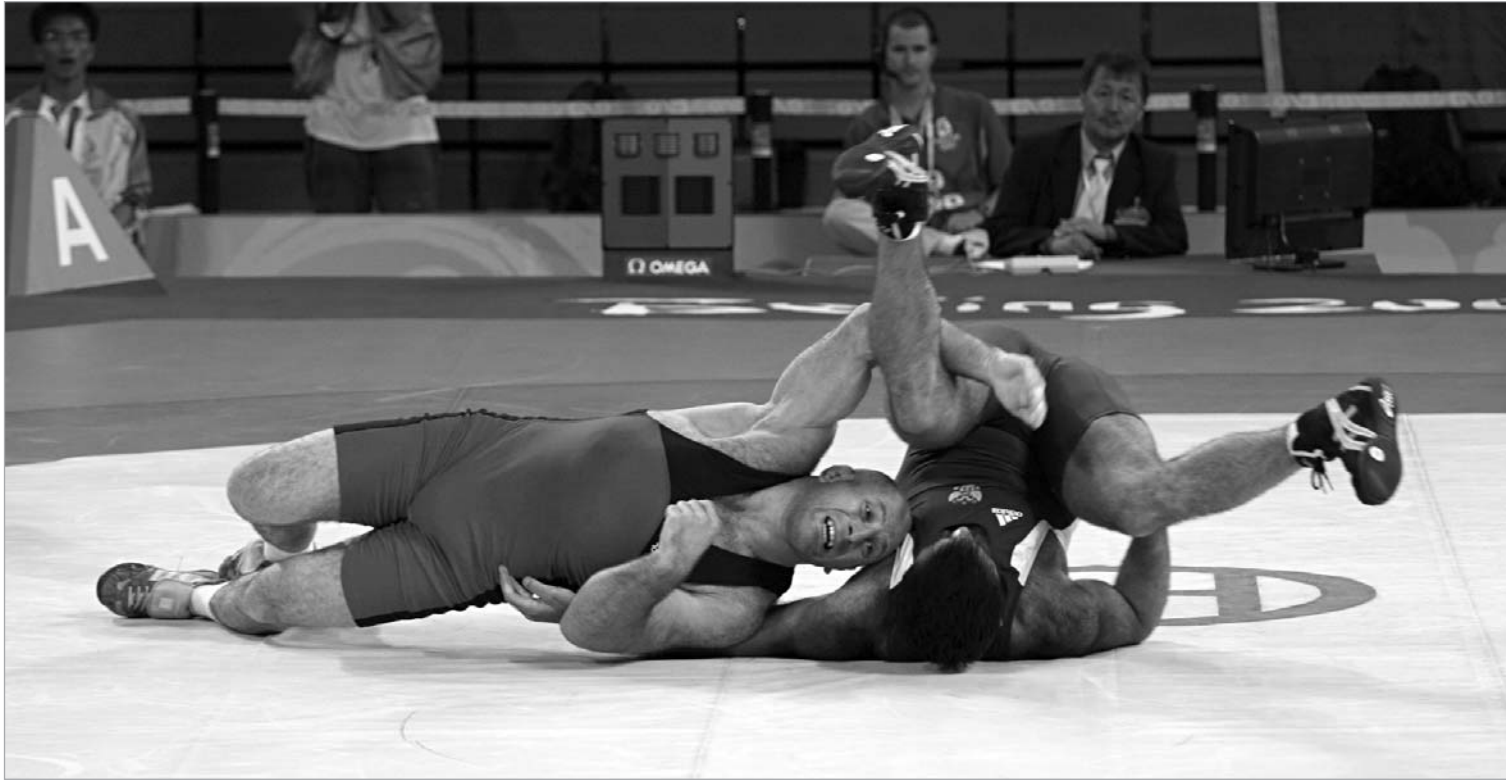
მინდორაშვილი და კომპანია ევროპისთვის მზადებას წახკაძორით იწყებს.

თავისუფალი სტილით მოჭიდდავითა ნაკრების გაფართოებული შემადგენლობა ვილნიუსის ევროპის ჩემპიონატისთვის სამზადისს და იმავდროულად სეზონის პირველ შეკრებას წახკაძორით შეუდგა. აი, ნაკრების კანდიდატებში შემდგარ გუნდს კი ანკარას საერთაშორისო ტურნირში (7-8 თებერვალი) მონაწილეობა დაუგეგმავს.