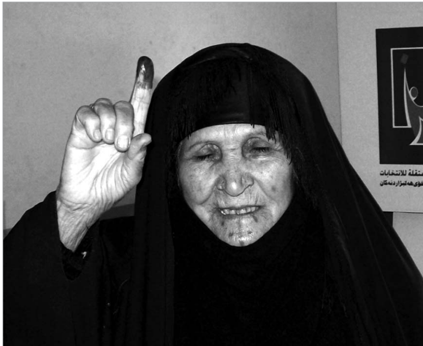
“ნითელი თითები ერაყის ასაშენებლად დაბრუნდნენ.”

ჯარმა ქუჩაში ტრანსპორტის გადაადგილება აკრძალა, რაც ერაყელი ბავშვებისთვის დიდი საჩუქარი აღმოჩნდა. მაშინ, როდესაც მშობლები რეგიონულ საბჭოებს ირჩევდნენ, მოზარდები ფეხბურთს პირდაპირ გზის საველ ნაწილზე თამაშობდნენ. კარის მაგივრობას კი მათ სამხედროების მიერ მოწყობილი ბარიერები უწევდათ. ქუჩებში მოთამაშე ბავშვები, მოსიერე უფროსები, ერაყელები, რომლებიც მოქალაქეობრივი ვალის მოსახდელად საარჩევნო უბნებზე ოჯახებთან ერთად მიდიოდნენ - შექმნილი ატმოსფერო დიდ სახალხო დღე-