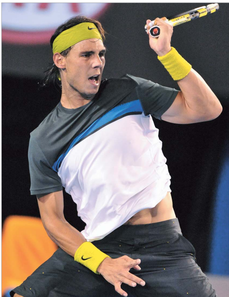
ნადალმა ფედერერი ავსტრალიაშიც გატყდა.

"ბოდიშს ვიხდი, რომ სულ ერთი საათი ვითამაშე, - სიმწარენარევი ხუმრობა სცადა საფინამ, - სერენას ვულოცავ და მსახურებულ გამარჯვებას. სწორედ ის არის დამნაშავე, რომ ფინალი ასე მალე დამთავრდა. სერენა მართლაც შესანიშნავად თამაშობდა. როცა ბურთს ვანვდიდი, ისეთი განცდა მქონდა, თითქოს ბავშვი ვი-