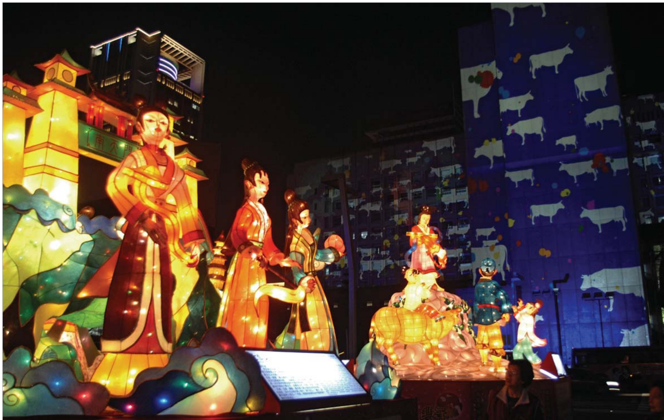
ჩინეთის სხვადასხვა ქალაქებში უკვე ტრადიციულ ფესტივალს მართავენ. "სინათლის ფესტივალი", ბევრისთვის პირდაპირ თარგმანში "განათების ფესტივალია". ამას დიდი მნიშვნელობა არ აქვს. მთავარი ისაა, რომ შეზინდდება თუ არა ჩინეთის, დიდ ქალაქებში წარმოდგენები იმართება, ამ წარმოდგენებში მთავარი ეფექტი სწორედ განათებას და ფერად შუქებს ენიჭებათ. ასევე საინტერესოა თუ როგორ ეჭიბრებიან ერთმანეთს გუნდები სხვადასხვა არქიტექტურული ნაგებობების განათებაში. შუა ღამით, ამ ფერადოვან მართონს ფოიერვერკები ასრულებენ.