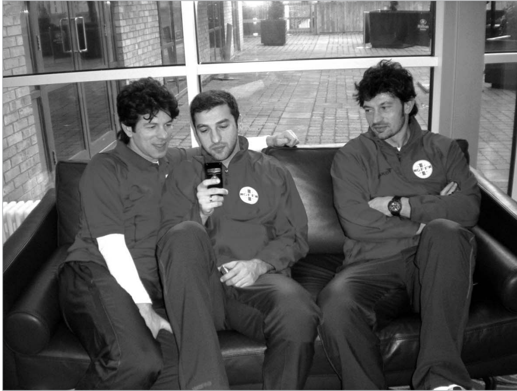
ქართველი ფეხბურთელები "კორკ პარკზე" ითამაშებენ.