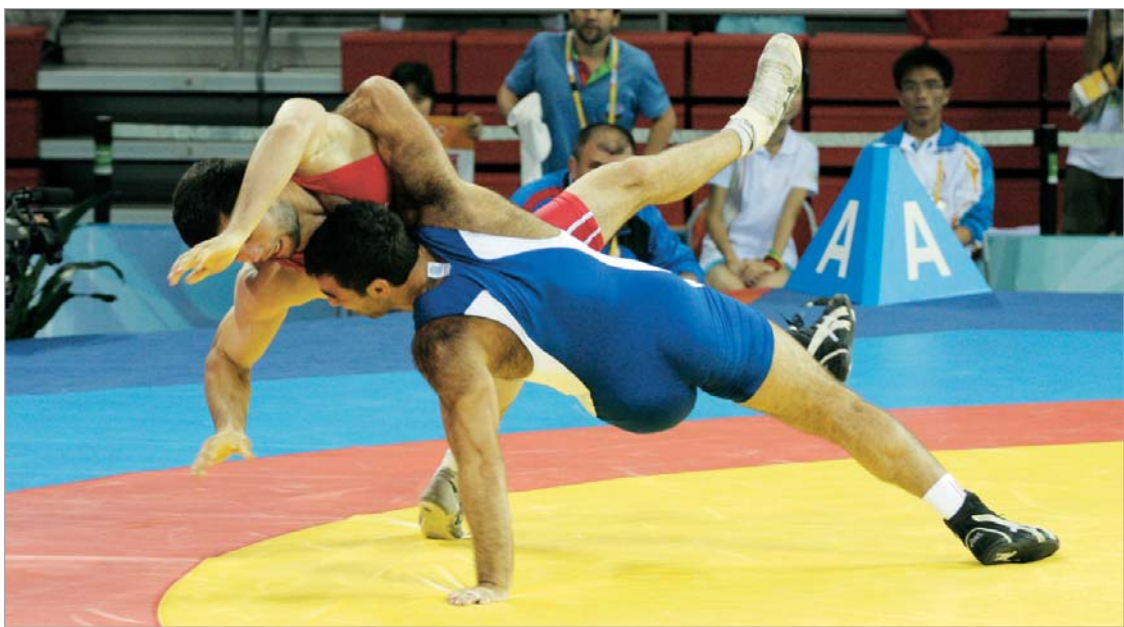
ბერძენ-რომაელები საევროპოდ თბილისში შეიკრიბნენ

თბილისური შეკრების დასრულების შემდეგ, საქართველოს ნაკრები უნგრეთში "ოქროს გრან პრიზე" სასპარეზოდ გაემგზავრება. იქიდან დაბრუნებულები კი მარტში ორ შეკრებას გაივლის