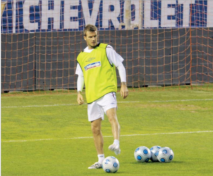
დევიდი ნაკრებში ვარჯიშისას

დევიდ ბექჰემის "მილანში" დარჩენა არდარჩენის საკითხი ალბათ მარტის ბოლომდე იქნება აქტუალური. ინგლისელი იტალიურ გრანდს საოცრად სწრაფად შეეწყო და "როსონერის" დატოვება აღარ უნდა, თანაც სწორედ "მილანში" გადასვლის წყალობით შეძლო დევიდმა ინგლისის ნაკრებში ადგილის დაბრუნება.