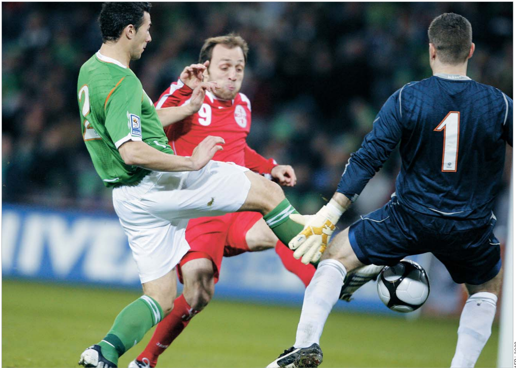
იაშვილის ამ დარტყმით ანგარიში გაიხსნა

ექტორ რაულ კუპერი: "ვერ ამისხნია, რა დარღვევა დააფიქსირა მსაჯმა. მე მართო ის დავინახე, რომ გვერდით მსაჯს ანეული ჰქონდა