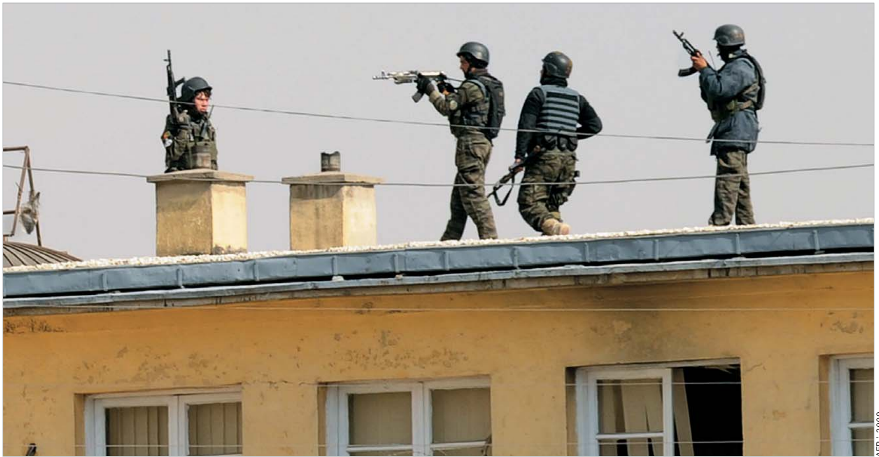
ტერორისტული თავდასხმების შედეგად ქაბულში 19 ადამიანი გარდაიცვალა, 50 კი დაიჭრა

იუსტიციის სამინისტროს ერთ-ერთი თანამშრომელი ჰყვება, რომ ნახა მამაკაცი, რომელსაც ხელში ავ-