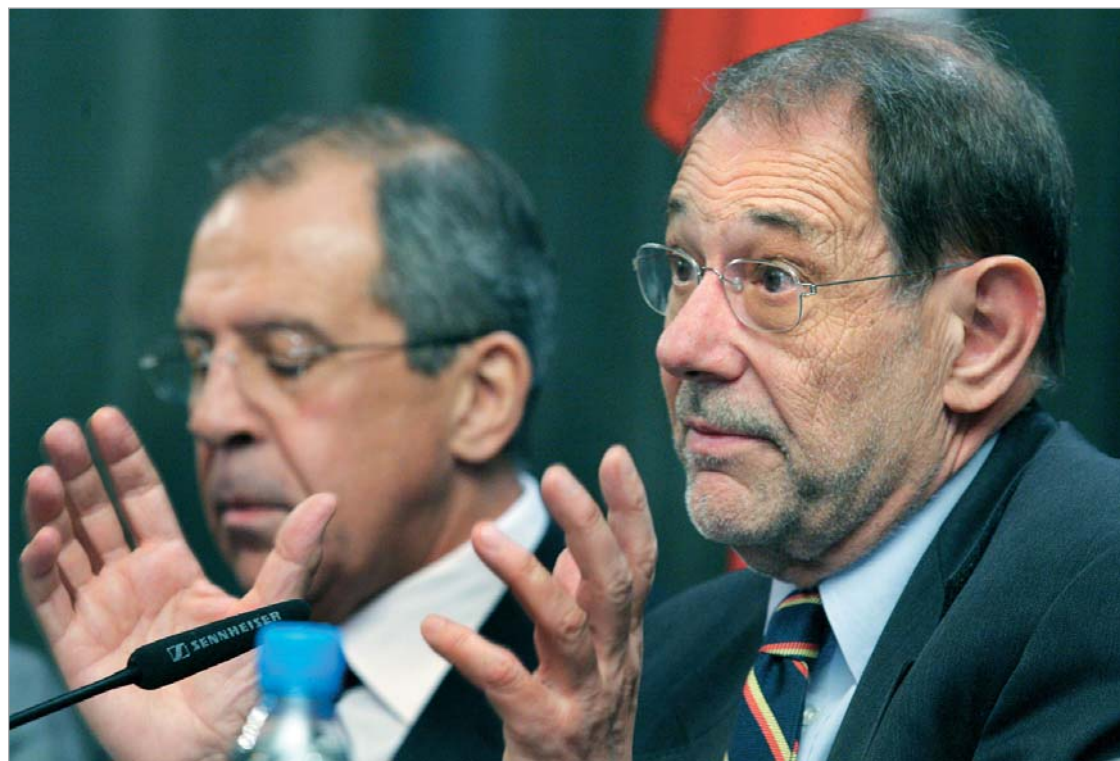
სერგეი ლავროვი და ხაიერ სოლანა

ლავროვის მხრიდან ასეთ განცხადებას კიდევ უფრო დიდი მნიშვნელობა ენიჭება იმის გათვალისწინებით, რომ გასულ წელს რუსეთმა დაბლოკა ევროკავშირის დამკვირვებელთა მისიის მანდატის გაგრძელება ე.წ. სამხრეთ ოსეთის მარიონეტული რეჟიმის ტერიტორიაზე.