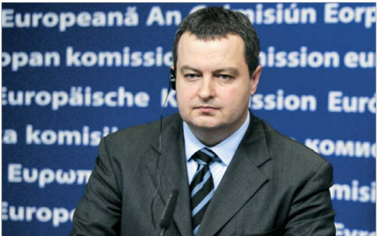
სერბეთის ვიცე-პრემიერი და შინაგან საქმეთა მინისტრი ივიცა დაჩიჩი

20-ზე მეტი დაპატიმრებული ჩინოვნიკი - ასეთია წმენდის შედეგი, რომელიც სერბეთის ხელი-სუფლებამ სამინისტროებში ჩაატარა. სერბეთის პოლიციამ, ქვეყნის სპეცსამსახურებთან ერთად, დანაშაულებრივ დაჯგუფებათა წევრები დააკავა. მათ შორის რამდენიმე მაღალი რანგის თანამდებობის პირიც. სერბეთის ვიცე-პრემიერ და შინაგან საქმეთა მინისტრი ივიცა დაჩიჩის ცნობით, სპეცოპერაციის შედეგად 24 ადამიანი დაპატიმრებული. მათ შორის თავდაცვისა და ეკონომიკის სამინისტროების წარმომადგენლები და ვაჭრობის სამინისტროს ყოფილი თანამშრომლებიც არიან. მხოლოდ თავდაცვის სამინისტროდან პოლიციამ 17 ადამიანი დააკავა. მათ თაღლითობაში, გაფლანგვასა და თანამდებობრივი უფლებამოსილების გადაჭარბებაში ედებათ ბრალი. ჩინოვნიკები ქვეყნის შეიარაღებული ძალების კუთვნილი საცხოვრებელი ფართების შესახებ დოკუმენტაციის