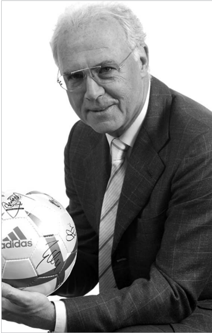
ბეკენბაუერს ფავორიტი არ ჰყავს

ასეთი თამაშით ვერც ბუნდესლიგაში გავალთ ფონს და