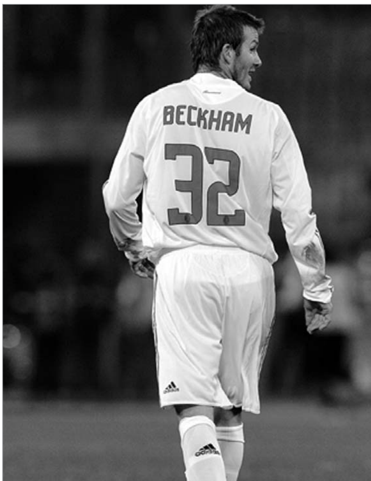
ბექჰემი სრულფასოვანი მილანელი იქნება

გასულ კვირას ამერიკელებმა განაცხადეს, რომ მილანთან ყოველგვარი მოლა-