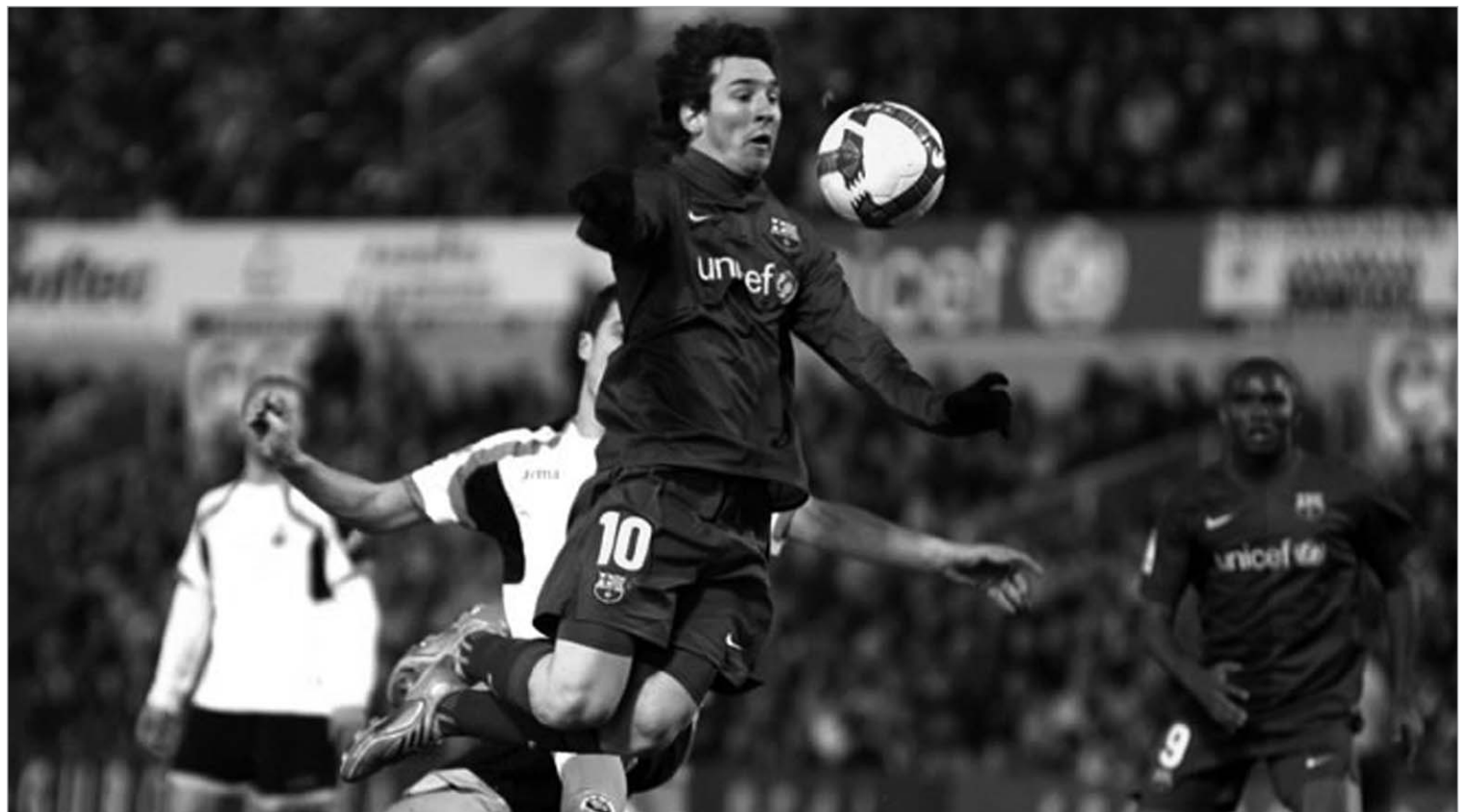
კაკას შემდეგ “სიტომ” მესის ყიდვა მოისურვა

კომიკური ვითარება იქმნება მანჩესტერ სიტის გარშემო. ამ კლუბის არაბი მფლობელები ლამის იხვეწებიან, ვინმეში ასი მილიონი გადაგვხდევინეთო.