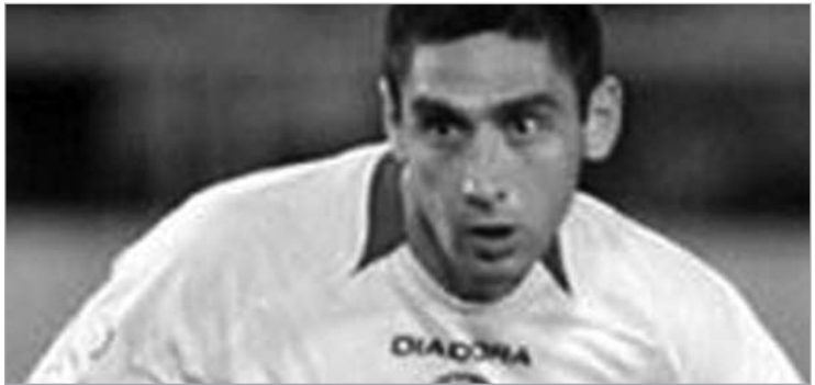
მუჯირი გოლების გატანას დაეჩვია.

განვლილ მატჩში მუჯირი გუნდის ძირითად შემადგენლობაში იყო და მე-5 წუთზე გახსნა ანგარიში.