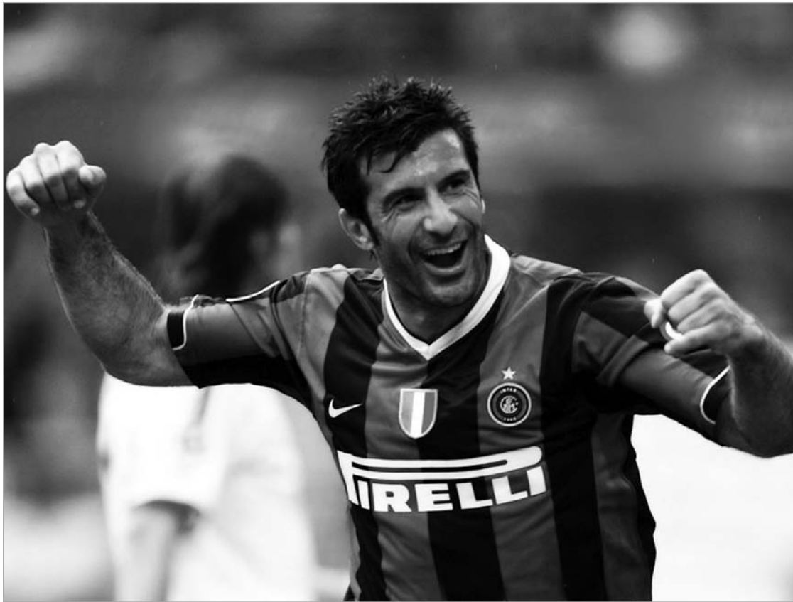
ფიგუ წარსულს იხსენებს და თავს იმართლებს.

"თავის დროზე არ ვიტყუებოდი, როცა ვამბობდი, "ბარსელონაში" დარჩენა და კარიერის აქ დასრულება მინდა-მეთქი. ჩემი სურვილის შესახებ პრეზიდენტმაც მშვენივრად იცოდა. ამის მიუხედავად, კლუბის ხელმძღვანელობამ ჩემი ნების საწინააღმდეგო გადაწყვეტილება მიიღო. ერთადერთი შეცდომა მაშინ დაფიქსირდა, როცა ინტერვიუში განაცხადე, აქედან არსად წამსვლელი არ ვარ-მეთქი. მაგრამ ეს დიდი ხნის წინ მოხდა და, რაც