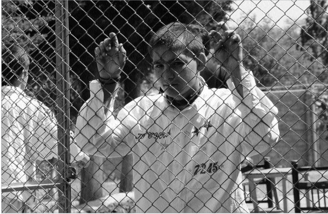
რეფორმის მიზანი - საზოგადოებას სრულფასოვანი წევრად დაუბრუნდება.

საქართველოში არასრულწლოვანთა მართლმსაჯულების სისტემის რეფორმის მიზნით ორწლიანი პარტნიორული პროექტი იწყება - "სასჯელაღსრულებისა და პრობაციის სისტემის რეფორმირება არასრულწლოვანი მსჯავრდებულებისათვის საქართველოში". პროექტის პრეზენტაცია გუშინ სასტუმრო "ვერატონ მეტეხი პალასში" გაიმართა.