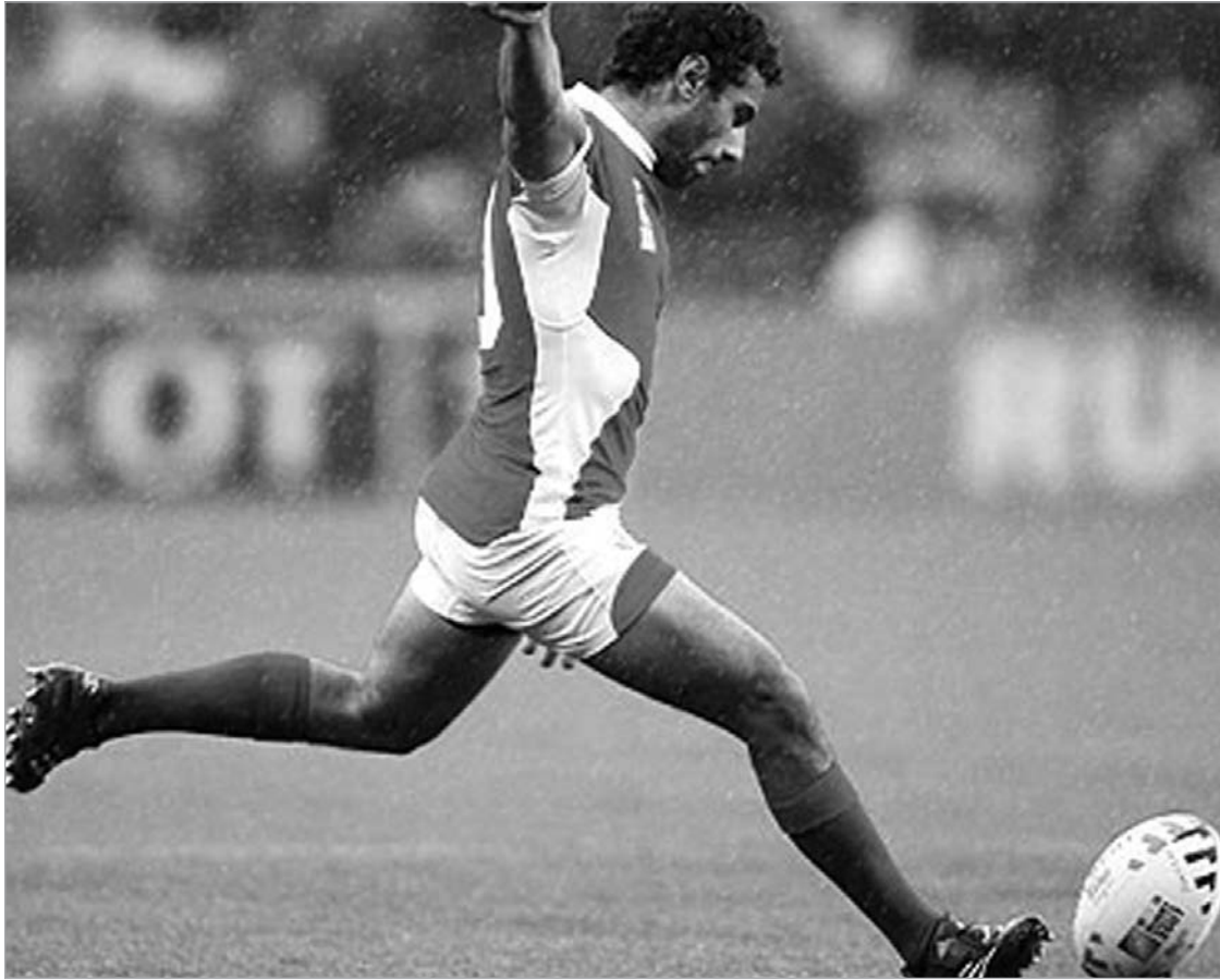
კვირიკაშვილმა ფიჯის ორი ლელო გაუტანა.

მომდევნო შეხვედრებს საქართველოს ნაკრები დღეს, საფრანგეთისა და აშშ-ის გუნდებთან გამართავს და წარმა-