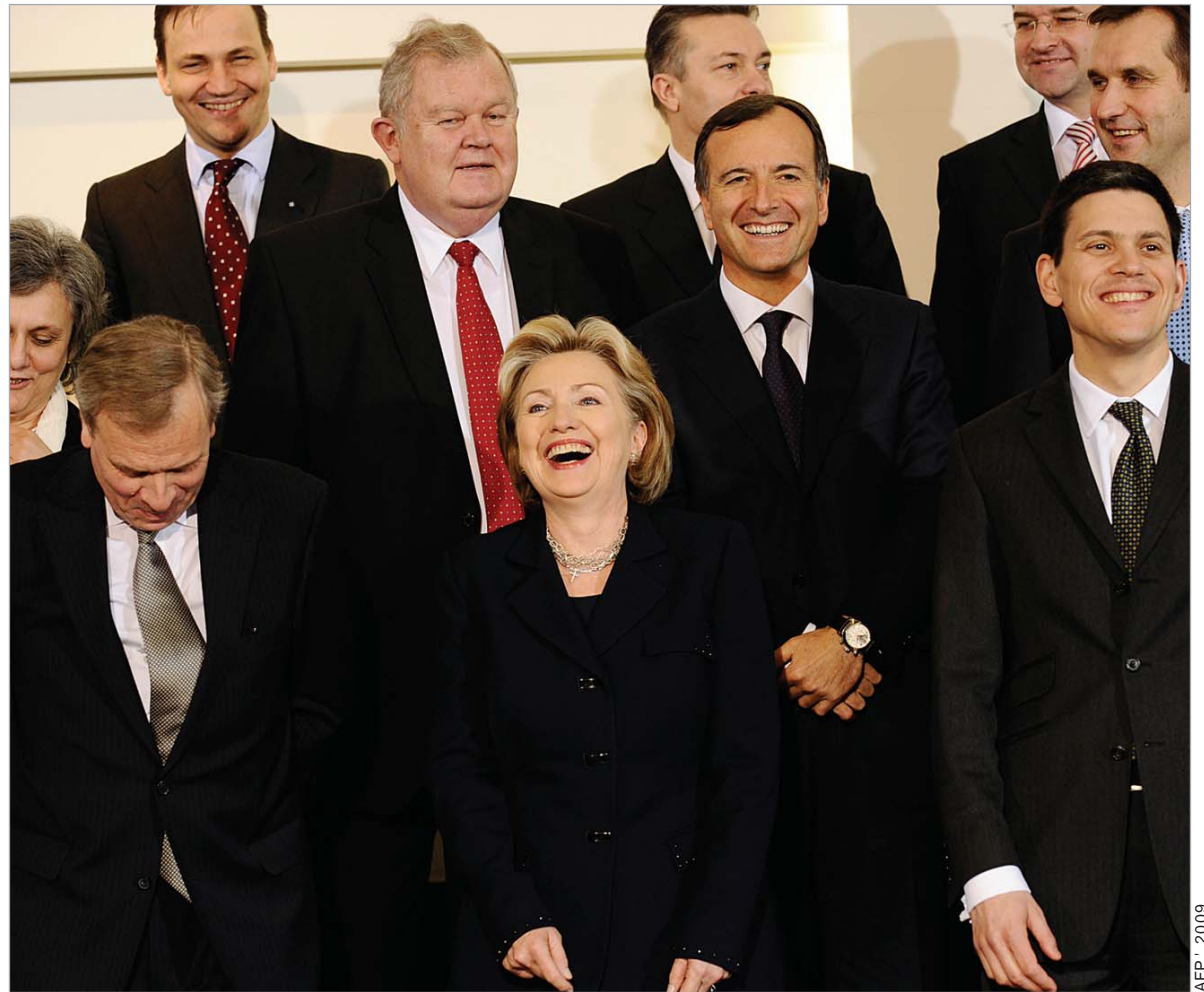
AFP - 2009