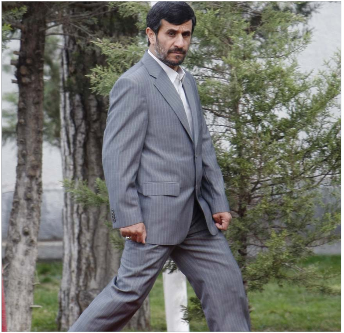
ირანის პრეზიდენტ მაჰმუდ ახმადინეჟადის მთავრობა შესაძლოა თავდასხმის მოგერიებისთვის მზადაა

ჯაფარის გამოსვლებამდე ცოტა უფრო ადრე, განცხადებები გააკეთა ირანის უშიშროების მინისტრმა გოლამ-ჰოსეინ მოჰსენი ეყიმი. მისი თქმით, თერანი თელ-ავივის მუდმივ მუქარებს იმის თაო-