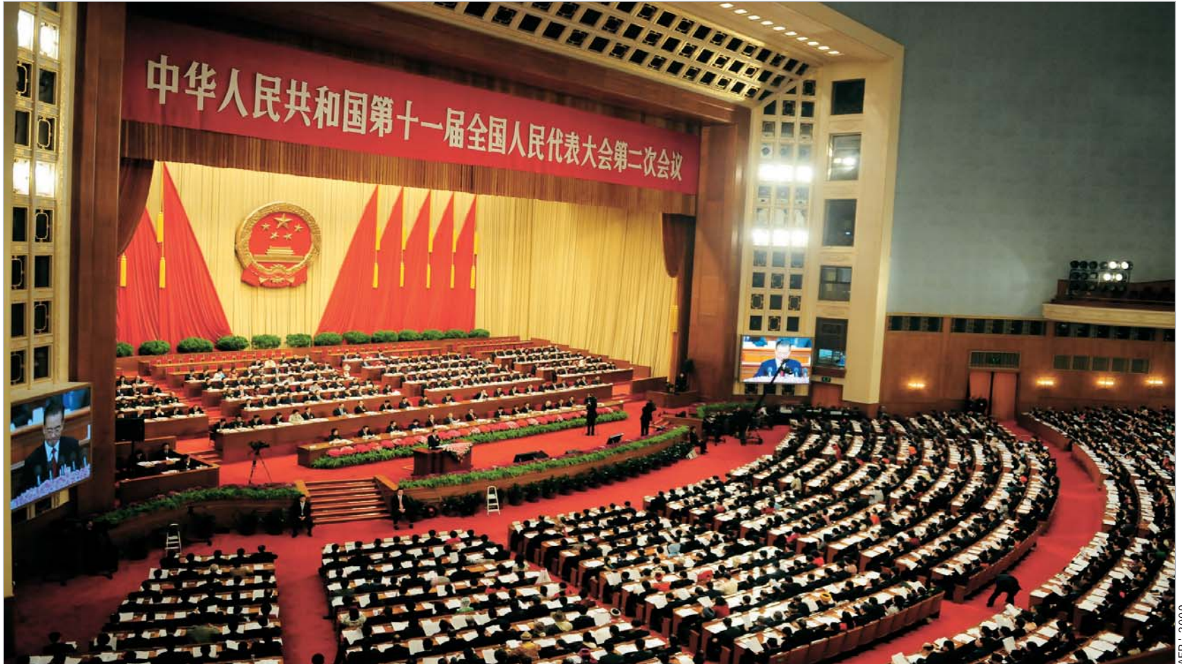
მსოფლიოში ყველაზე მრავალრიცხოვანი პარლამენტი სრული შემადგენლობით წელიწადში მხოლოდ ერთხელ იკრიბება.

მისი მემკვიდრე კი კომუნისტური პარტიის ზედა საფეხურებზე ხელისუფლების შეცვლამდე ხუთი წლით ადრე უნდა გამოჩნდეს, რათა მისი არსებობა ჩინელებისა და დანარჩენი მსოფლიოსთვის მოულოდნელი არ იყოს და ამავე დროს, თავად მან გამოცდილების მიღება მოასწროს.