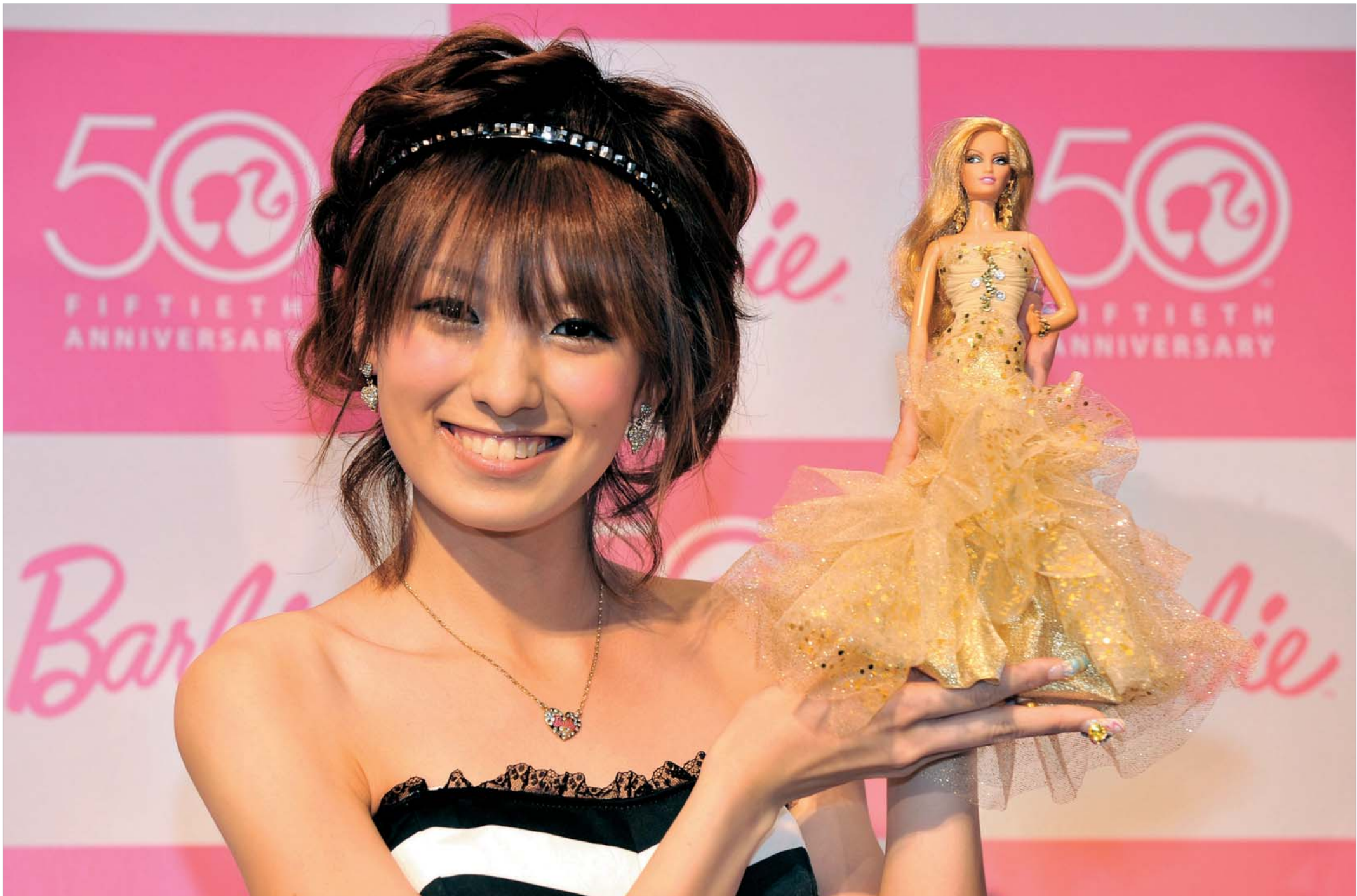
ზუსტად 50 წლის წინ - 1959 წლის 9 მარტს მსოფლიომ ბარბი გაიკვნო. თოჭინა, რომელმაც ამ წლების განმავლობაში მრავალჯერ შეიცვალა იმიჯი და პირადი ცხოვრება, რომელსაც მსოფლიოს სახელგანთქმული დიზაინერები აცმევდნენ, ხოლო საუკეთესო არქიტექტორები მის სახლს აპროექტებდნენ. მილიონობით გოგონას საყვარელი სათამაშოა. ხოლო თოჭინების კოლექციონერებისთვის ძვირფასი ექსპონატი. ბარბის იუბილე მსოფლიოს რამდენიმე ქვეყანაში აღინიშნა. მათ შორის ავსტრალიაში, გერმანიაში, საფრანგეთსა და იაპონიაში.