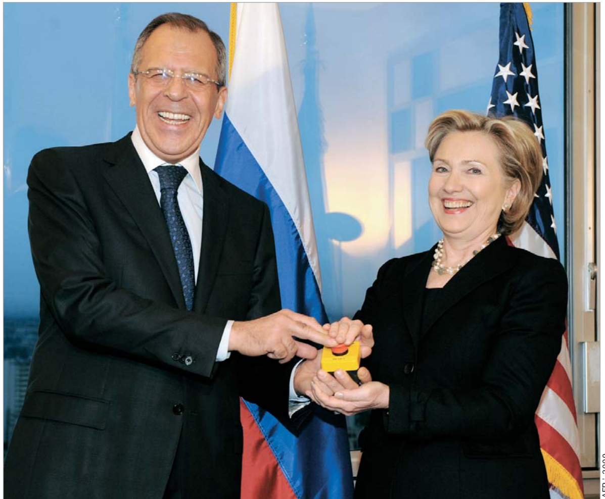
AFP - 2009