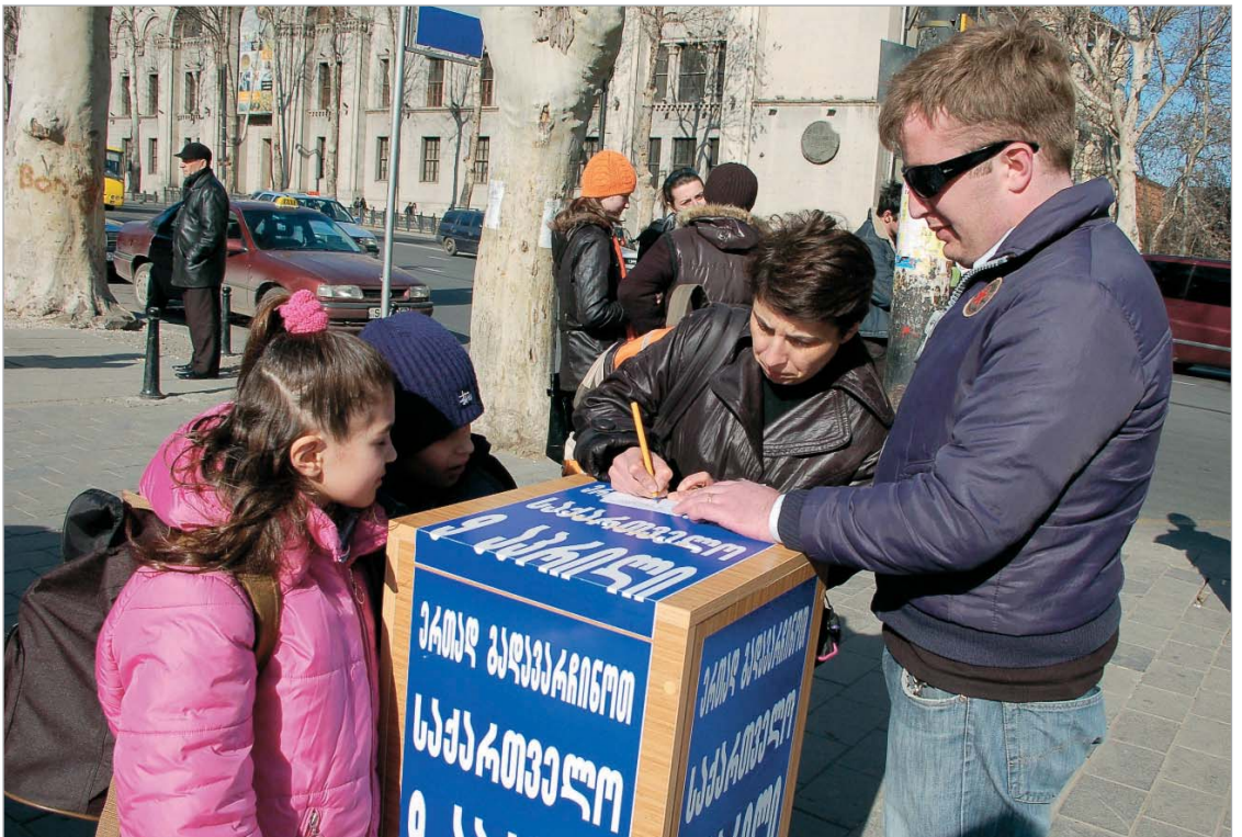
"ყუთების აქცია" რეგიონებში გადინაცვლებს

არასაპარლამენტო ოპოზიციამ საქართველოს პრეზიდენტ მიხეილ სააკაშვილის გადადგომისა და რიგგარეშე არჩევნების დანიშნის მოთხოვნით თბილისში ჩატარებული "ყუთების აქციის" შედეგად უკვე 48 ათას 347 ხელმოწერა შეგროვა. თბილისის 16 მეტროსადგურთან, ბაზრობებთან და ავტოსადგურთან ზუთი დღის განმავლობაში მიმდინარე აქციაში 9 აპრილის აქციის ორგანიზაციაში ჩართული ცხრა ოპოზიციური პარტია მონაწილეობდა - "კონსერვატორები", "ხალხის პარტია", "დემოკრატიული მოძრაობა ერთიანი საქართველოსთვის", "თავისუფლება", "ტრადიციონალისტები", "ქალთა პარტია", "საქართველოს გზა", "მოძრაობა ერთიანი საქართველოსთვის" და "მრეწველები". 9 აპრილის აქციის ორგანიზატორთა მტკიცებით, საზოგადოების მხარდაჭერა მაღალია და მოკლე დროში სააკაშვილის ხელისუფლება კონსტიტუციური გზით შეიცვლება. "შეგროვებული ხელმოწერები ადასტურებს მოსახლეობის მზადყოფნას, რომ მიზნის მისაღწევად 9 აპრილიდან დღე და ღამე რუსთაველის გამზირზე იდგეს," - აღნიშნა "კონსერვატორების" ერთ-ერთმა ლიდერმა კახა კუკავამ.