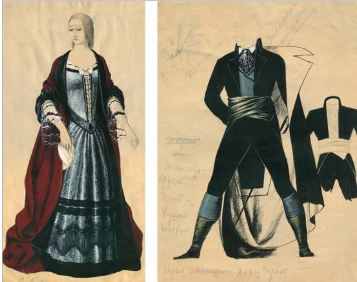
ს. კობულაძის "ყაჩაღები".

მეტად საინტერესოა რამდენიმე მხატვრის მიერ ერთი სპექ-