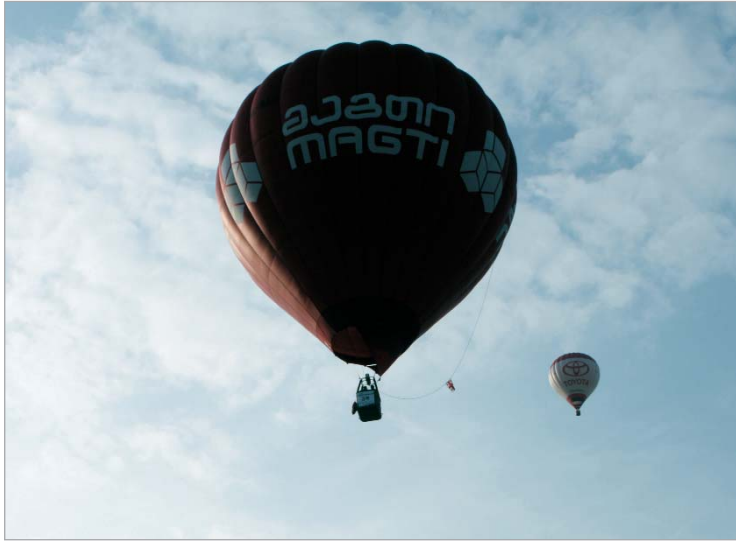
"გაბთის" სითბური აეროსტატის მეშვეობით შორს ფრენასა და ჰაერში ყოფნის ხანგრძლივობის ეროვნული რეკორდი დამყარდა

ბევრი იფრინეს თუ ცოტა, საქართველოს რეკორდი დაამყარეს. რეკორდულმა ფრენამ მთიანი ადგილისა და ჰაერის ცვალებად დინებათა რთულ პირობებში ჩაიარა. ამასთან ამგვარი მაჩვენებელი მნიშვნელოვნად გაართულა საომარმა ვითარებამ, ვინაიდან ფრენამ ჩვენი ქვეყნის ოკუპირებული ნაწილის თავზე და მის სიახლოვეს ჩაიარა. მიუხედავად ამისა, ჰაერნაოსნობის ეროვნულმა ფედერაციამ შეძლო საქმის ბოლომდე მიყვანა.