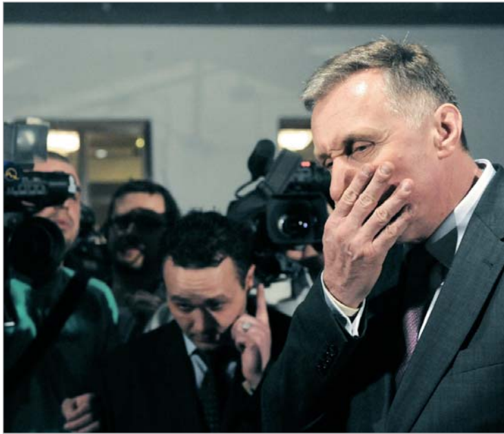
მიროსლავ ტოპოლანეკი: "მე ვემორჩილები კონსტიტუციურ წესრიგს"

ბულნი არიან, რომ ჩეხეთი მომავალშიც შეძლებს ევროკავშირის თავმჯდომარე ქვეყნის ფუნქციისთვის ეფექტიანად თავის გართმევას, როგორც ეს დღემდე ხდებოდა. შიდა პოლიტიკური საკითხების გადაწყვეტა ჩეხეთის დემოკრატიული პროცესების პრეროგატივაა კონსტიტუციის გათვალისწინებით," - აღნიშნულია ევროკავშირის ხელმძღვანელობის ოფიციალურ განცხადებაში.