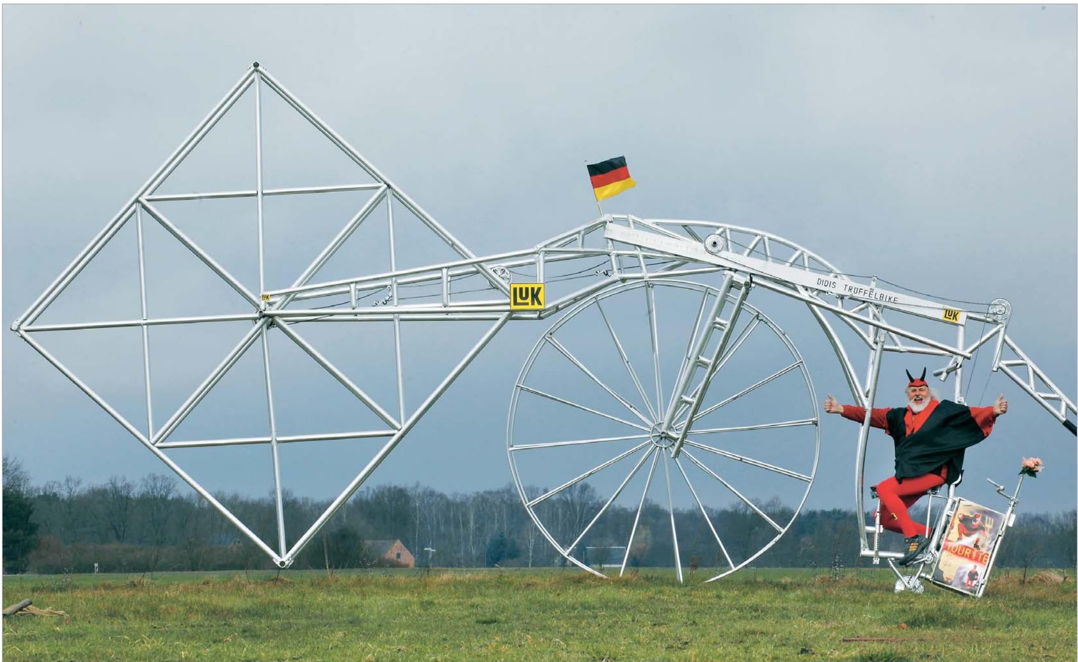
ვინ თქვა, რომ ბორბალი მაინც და მაინც მრგვალი უნდა იყოს. ამ საყოველთაოდ მიღებულ წესს დიდი ხანია არღვევს გერმანელი დიზაინერი დიდი სენტფი. რომელსაც ელ დიაბოლოს სახელი- თაც იცნობენ. მას ძალიან უყვარს უცნაური კონსტრუქციის მქონე ველოსიპედების გამოგონება. ერთ-ერთ მათგანს კი ამ ფოტოზეც ხედავთ. ელ დიაბოლოს გამოგონებები გინესის რეკორდების ნიგნშიცაა შეტანილი. როგორც ყველაზე უცნაური კონსტრუქციები.