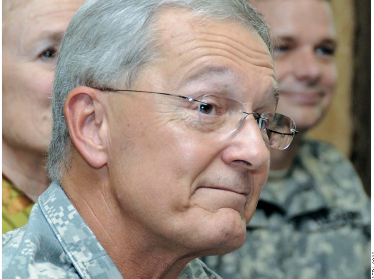
კრედოკის განცხადებით, აშშ-ს რუსეთთან ურთიერთობა მომავალ წლებში უფრო რთული იქნება. ვიდრე ოდესმე ცივი ომის შემდეგ.