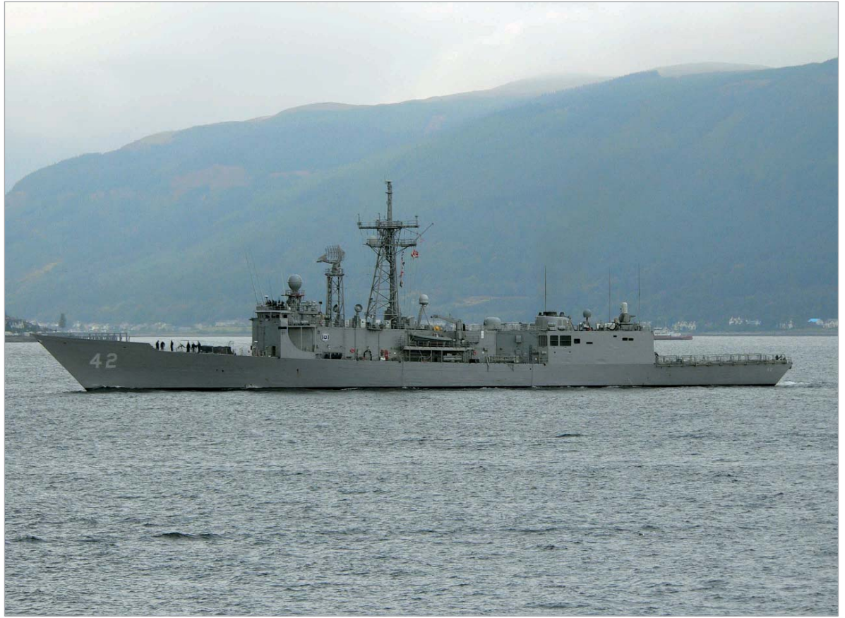
პირველ აპრილს, როდესაც ობამა და მედვედევნი ლონდონში პირველად შეხვდებიან ერთმანეთს, ამერიკული "კლაკინგი" უკვე ბათუმის პორტში იდგება.