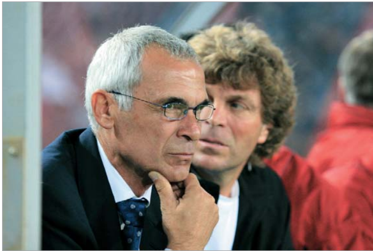
უნდა დაამარცხოვნი, თუ არა და, ამის შემდეგ რეალურად მოგებაზე ფიქრი ძნელი იქნება. კვიპროსთან მატჩში მიღე-

პირველ აპრილს საქართველოს ეროვნული ნაკრები 2010 წლის მსოფლიო ჩემპიონატის შესარჩევ ტურნირში მორიგ ოფიციალურ მატჩს ჩაატარებს: ჩვენი გუნდი თბილისში, ბორის პაიჭაძის სახელობის ეროვნულ სტადიონზე, მონტენეგროს ნაკრებს უმასპინძლებს. მართალია, კუპერის გუნდმა კვიპროსთან მარცხის შემდეგ ფინალურ ეტაპზე გასვლის თეორიული შანსიც კი დაკარგა, მაგრამ პირველი აპრილის მატჩს ჩვენთვის მანძი დიდი მნიშვნელობა აქვს. ჯერჯერობით ქართველებს ამ შესარჩევ ციკლში თამაში არ მოუგიათ და თუ კუპერის შეგირდები არ აპირებენ ეს ციკლი მოგების გარეშე დაამთავრონ, სწორედ მონტენეგრო