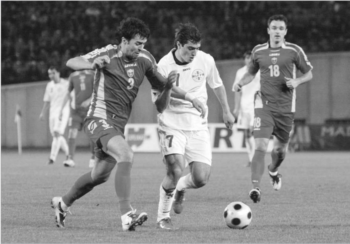
მერნაშვილის ყველა მცდელობა უშედეგოდ დასრულდა

უნდა აღინიშნოს, რომ კვიპროსულ მატჩთან შედარებით კუპერმა გარკვეული ცვლილებები განახორციელა და სცადა ჩვენი გუნდის შემტევი პოტენ-