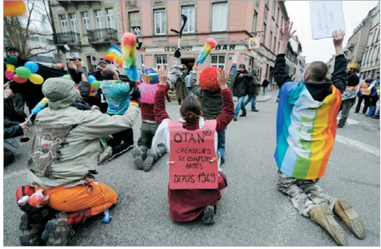
სტრასბურგში ნატოს სამიტს ანტიგლობალიზტები პროტესტით ხვდებიან

ხვალ სტრასბურგში ნატო-ს საიუბილეო სამიტი გაიხსნება. აპრილის უმაღლესი დონის შეხვედრები გაიმართება გერმანიისა და საფრანგეთის საზღვრისპირა ქალაქებში - სტრასბურგში, კიოლნსა და ბადენ-ბადენში. გერმანიის კანცლერ ანგელა მერკელთან და საფრანგეთის პრეზიდენტ ნიკოლა სარკოზისთან ერთად, ნატო-ს გაერთიანებული მდივნის რანგში ალიანსის სამიტის უკანასკნელად გახსნის იაპ დეპუტატი სხეფერი, რადგან მისი უფ-