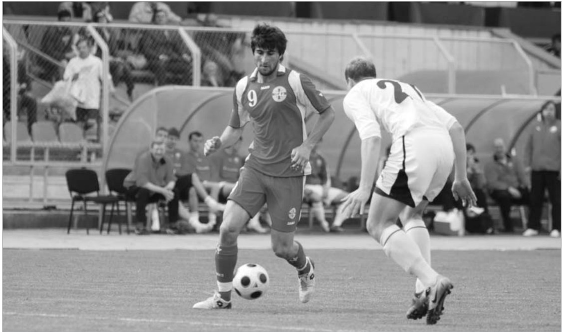
ბელორუსს გოლი ვერ გაუვტანეთ

ბელორუსებთან მატჩის წინ ექტორ რაულ კუპერმა ცხადაძეს სამი წამყვანი ფეხბურთელი "წაართვა". სხვადასხვა მიზეზის გამო ჩერნოგორიის წინ ეროვნულ გუნდს სამი მცველი დააკლდა და ეს დანაკლისი არგენტინელმა მწვრთნელმა ახალგაზრდული გუნდიდან სანაიას, დაუშვილისა