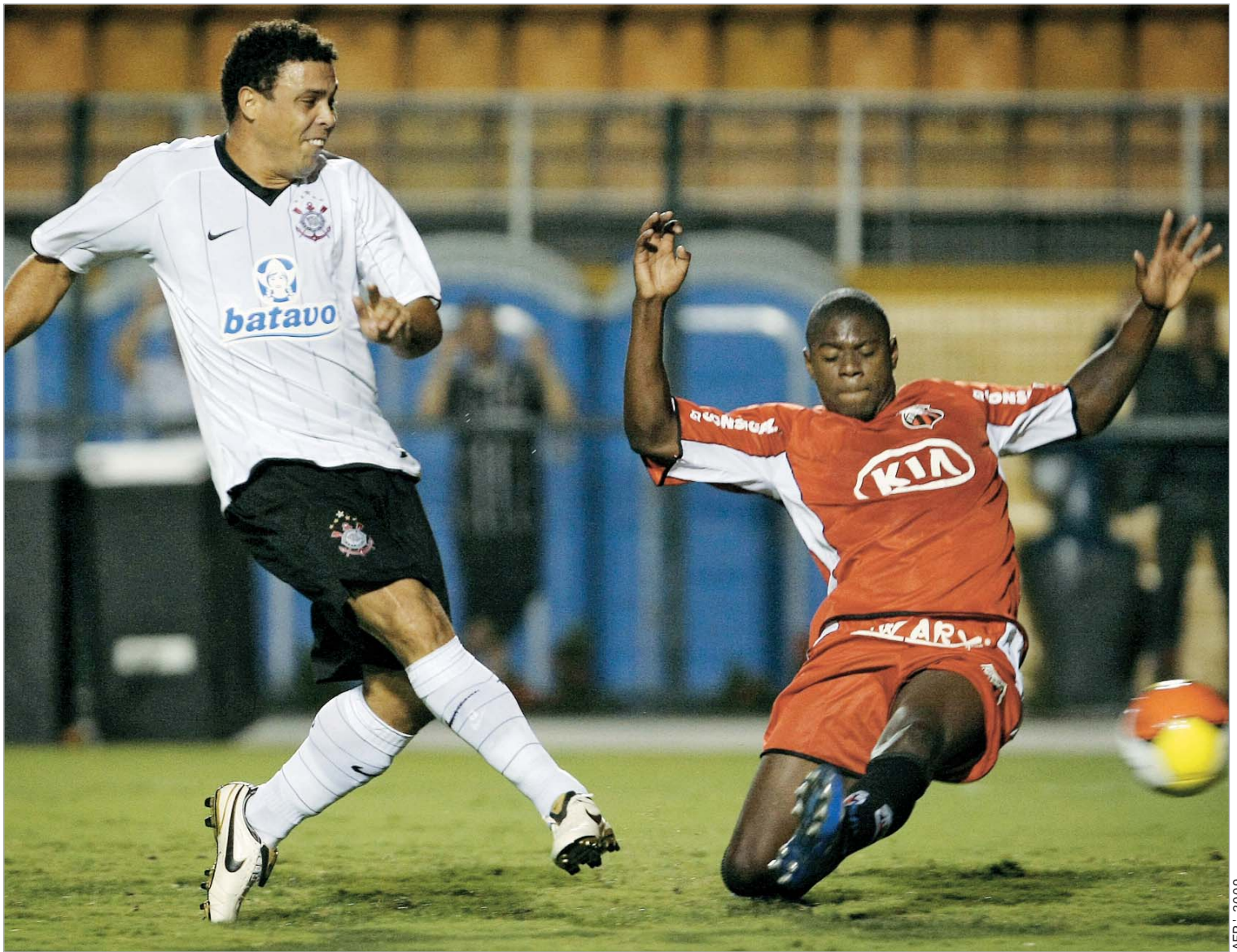
კიჭამ "კორინთიანსში" აიშვა

თანამედროვე ფეხბურთის ერთ-ერთმა თვალსაჩინო ვარსკვლავმა, 1000 გოლზე მეტის გამტანმა რომარიომ განაცხადა, რომ ახლახან ფეხბურთში დაბრუნებული რონალდო ბრაზილიის ნაკრებშიც უნდა დააბრუნონ.