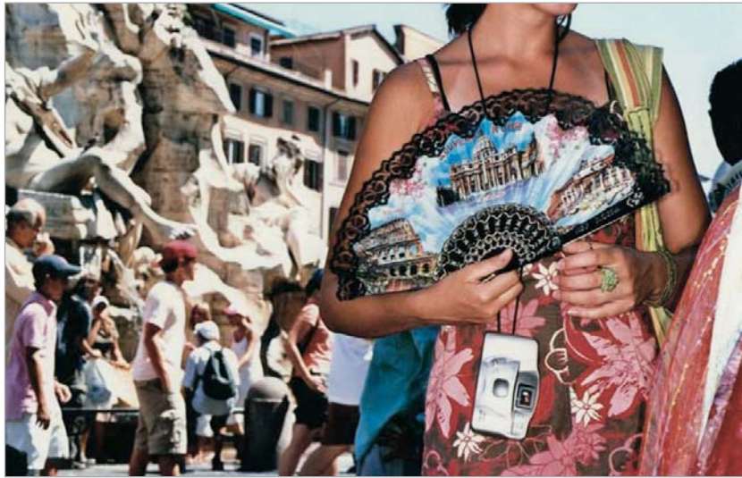
მარტინ პარის ფოტოები

დღეს აღარავის უკვირს გულზე ფოტოაპარატ ჩამოკიდებული ადამიანის დანახვა - ფოტოგრაფია, გნებავთ ფოტოხელოვნება ამჟამად ჩვენთან ისე პოპულარულია, როგორც არასდროს. არადა იყო დრო, როდესაც თბილისში ჩამოსულს მხოლოდ ერთი - იური მეჩითოვი დაგამახსოვრდებოდა. თავის ძველი თბილისური ვოიაჟის გახსენებას გიორგი პინხასოვი სწორედ მეჩითოვით იწყებს. მისმა მოგონებებმა და ფოტოებმა კი "მაგნუმის" ფოტოგრაფების მასტერკლასების პირველივე დღეს ეროვნული მუზეუმის აუდიტორიაში მოიყარეს თავი. ფოტოგრაფიით დაინტერესებულებს პინხასოვის გარდა კიდევ ორ "მაგნუმელ-