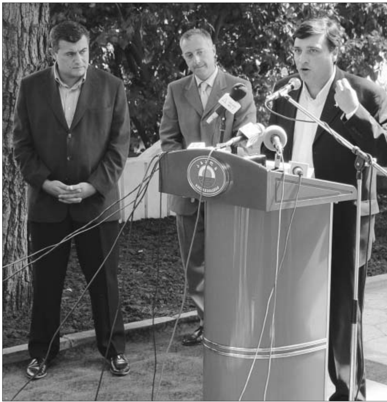
„ახლები“ პოლიტიკურ სფეროს ხსნიან.