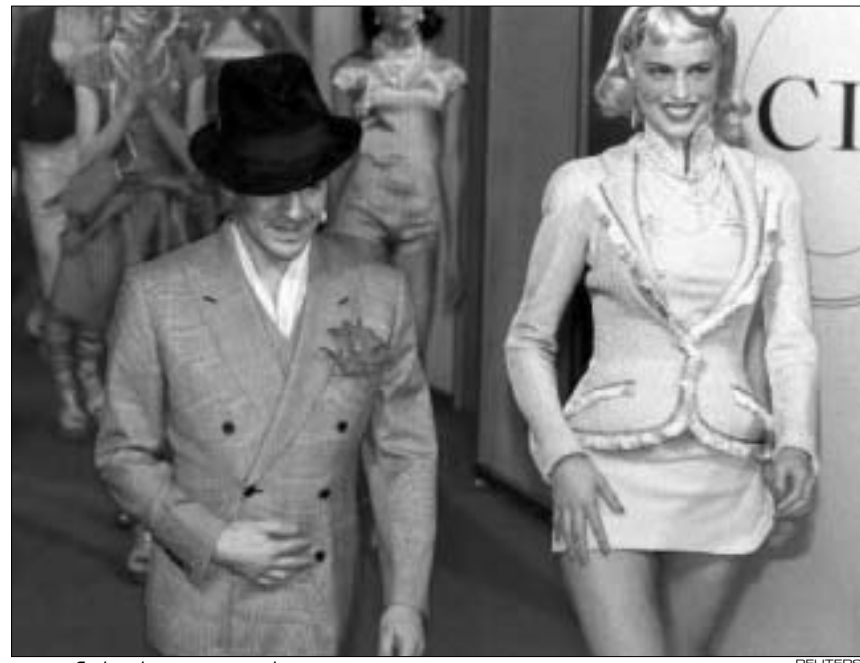
გალიანოს ახალი კოლექცია

გალიანო ყოველი ახალი კოლექციის მომზადებისას ისეთივე გულს-ყურით ეკიდება საკუთარ გარეგნობას, როგორც თითოეული მოდელის შექმნას.