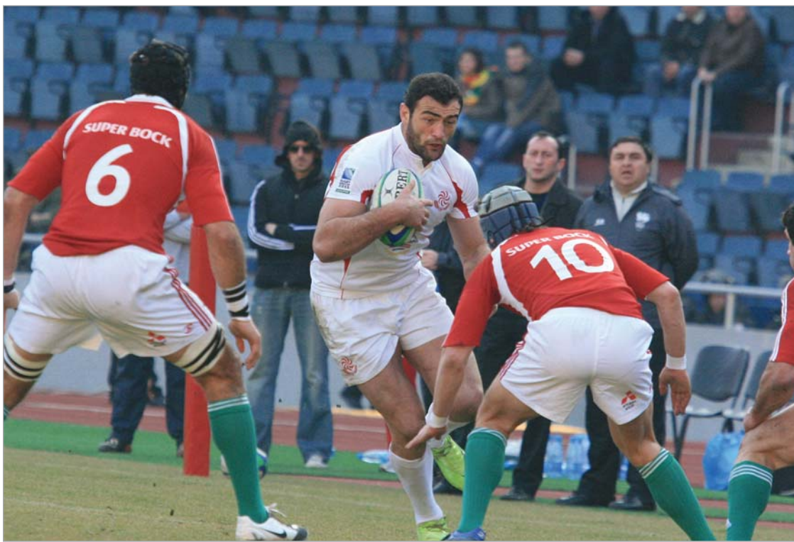
საქართველოს მორაგბეთა ეროვნულმა ნაკრებმა მსოფლიოს მე-13 გუნდის სტატუსი შეინარჩუნა.

საქართველოს მორაგბეთა ეროვნულმა ნაკრებმა მსოფლიო-