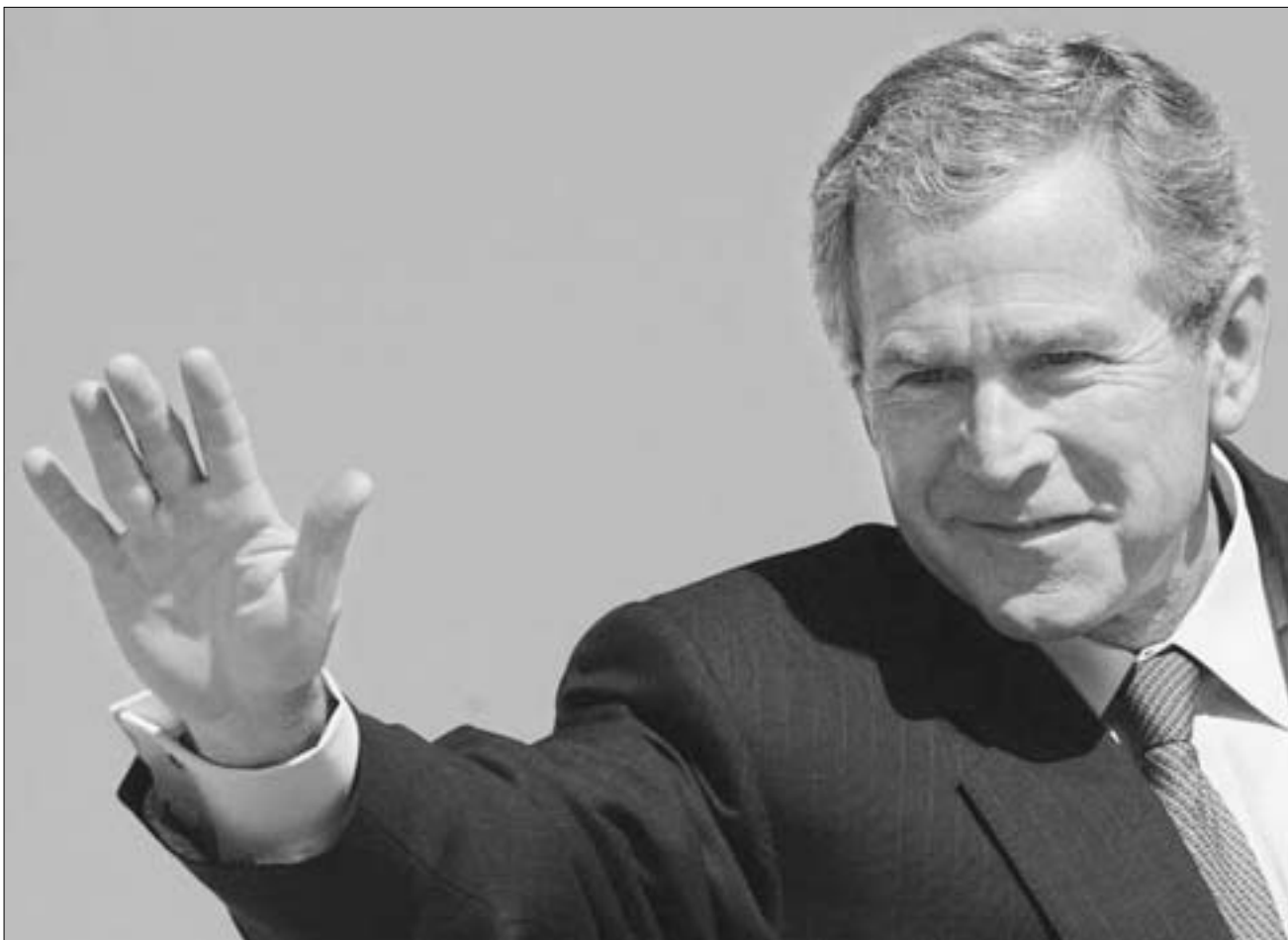
პრეზიდენტი ბუში საქართველოს მხარდგერის უხვადებს

თავის განცხადებაში ბუშმა ორი მნიშვნელოვანი განსხვავება დააფიქსირა: პირველი გახლავთ განსხ-