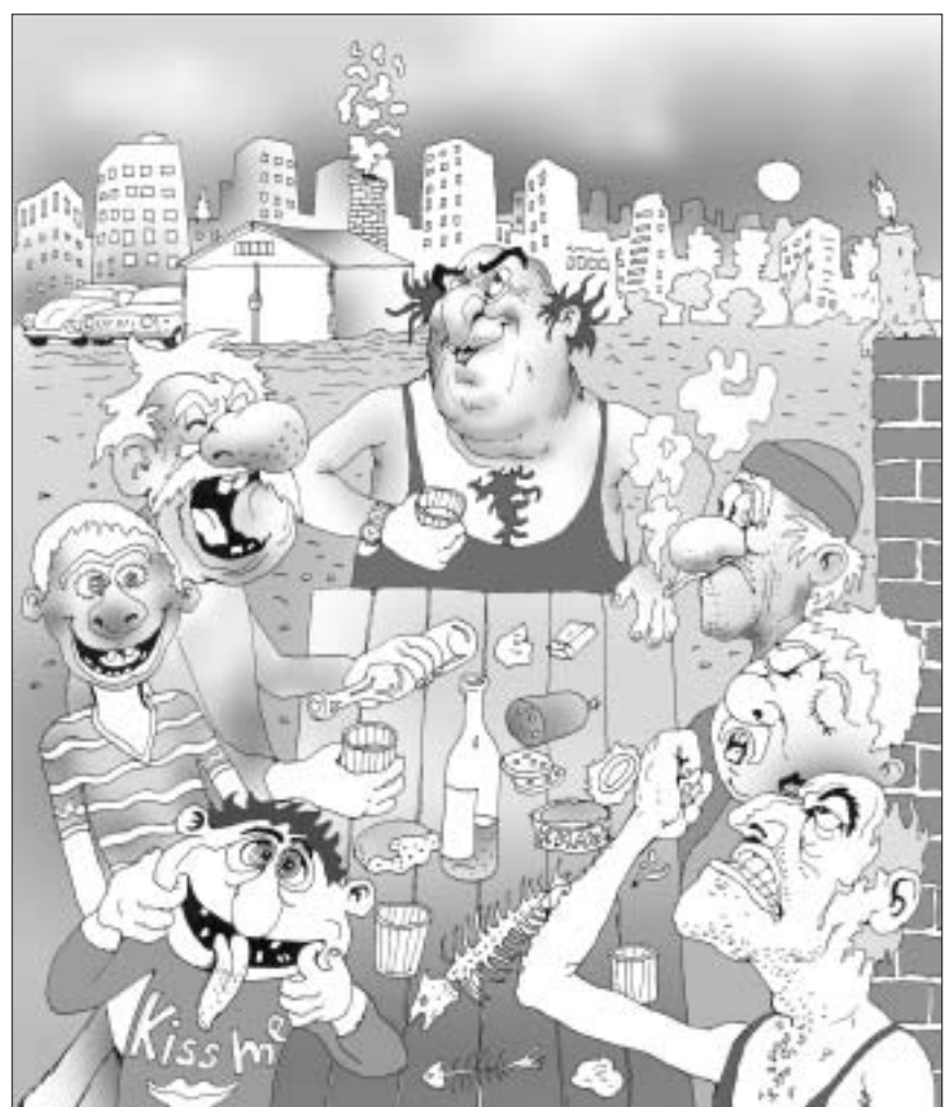
ჩანართი მოამზადა პაატა ბერიკაშვილმა.

ოპოზიციური პარტიის "კუასი-ტიტი უპირველეს ყოვლისა" ლიდერმა და ფრაქცია "სილოის ძელი გადაგვარჩენს და მალე აქ!" აქტიურმა წევრმა გუამბუმბომ უფრანოსტებს განუცხადა, რომ ყველაფერი სინამდვილასა ზღვარეულ გატანის გამო მოხდა და ამიტომ აუცილებელია, შამან-პატრიარქის პასუხისმგებლობის საკითხის დაგეგმვა. მას მხარს უჭერს შამანური ნრეები-და განკვეთილი შამან-სესენი ბასილ კაკა ვოსტრეკოვი, რომელიც დაჟინებით მოითხოვდა შამანთესუცესის საჯაროდ გაკრევისა, რომელსაც უმართს სეხელის საკურორტო ქალაქის პოლიციელმა ძლივს წაღივებს ლოს კოფებით თამაში. რაც სინამდვილეში ქვეყნის ფარგლები დასტოვებს, დაულო სპილოთაგან არც ერთს აღარ აღმოაჩნდა კოჭი.