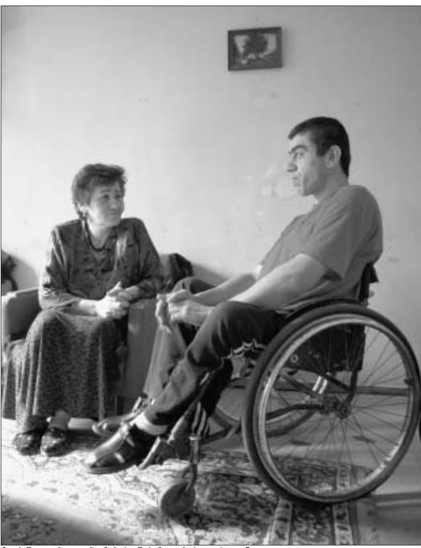
ზაქაშვილები დაპირების შესრულებას ითხოვენ

წინა კვირას აღმოჩენილი საკანალიზაციო ქსელის დაზიანებები პირველი შემთხვევა არ არის. კარგა ხანია, "თბილწყალკანალი" ჩივის, რომ ქალაქის საკანალიზაციო სისტემა მთლიანად გამოსაცვლელია, 30-40 წლის წინათ გაკეთებული თუჯის მილები ფანჯმა შეჭამა. ეს ქალაქის ხელმძღვანელობამაც, მშენიერად იცის, მაგრამ "წყალკანალის" წლებანდელი ბიუჯეტში 11