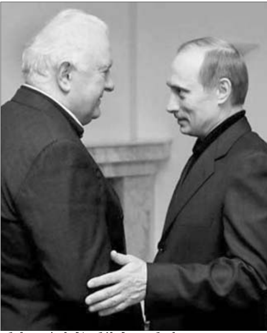
გარეგნულად თბილმა შეხვედრებმა შედეგი ვერ გამოიღო.

რი დასკვნების გამოტანაც ვცადოთ. საუბრები იმაზე, რომ შექმნილი მდგომარეობა პრეზიდენტ მევარდნაძეს შიდა დაპირისპირებებს აარიდებს, მხოლოდ მოკლევადიანი პერსპექტივისთვისაა მართებული. ხელი-სუფლებას და, პირველ რიგში, პრეზიდენტ მევარდნაძეს, დაძაბულობის ამ ტალღის გადავლის შემდეგ, ბევრ, მისთვის არასასიამოვნო კითხვაზე მოუწევს პასუხის გაცემა: როგორ სახელმწიფოს აძლებს? რა არის ამ სახელმწიფოს პრიორიტეტები - ის, რომ ჯარი და მისი მეთაურები, მათხოვრებივით, მუდმივად ფულს იხევენოდნენ და "რაგატკებზე" ოცნებობდნენ? ის, რომ თავდაცვის სამინისტრო თავისსავე ქვეყანაში დამზადებულ და მოდერნიზებულ სამხედრო თვითმფრინავებს ვერ ყიდულა? თუ ის, რომ ქვეყანას, რომელიც ომს ვიცხადებს, სტრატეგიული ობიექტები უნდა აჩუქო? და საერთოდ, შეძლო კი შევარდნაძემ მისი მმართველობის პერიოდში სახელმწიფოს ჩამოყალიბება? ამ კითხვებზე პასუხის მოსახლეობისათვის იმდენად ნათელია, რომ თითქოს აზრს კარგავს კიდევ ის არგუმენტები, რომელიც ხელისუფლებას აქვს. ამიტომაც, სტრატეგიულად, დღეს შექმნილი მდგომარეობა პრეზიდენტის პოზიციებს კიდევ უფრო ასუსტებს, რადგანაც ნათლად ნარმოაჩენს ხელისუფლების მოღვაწეობის რეალურ შედეგებს - შევარდნაძემ ვერ შეძლო, შექმნა ის მყარი ფუნდამენტი, რომ-