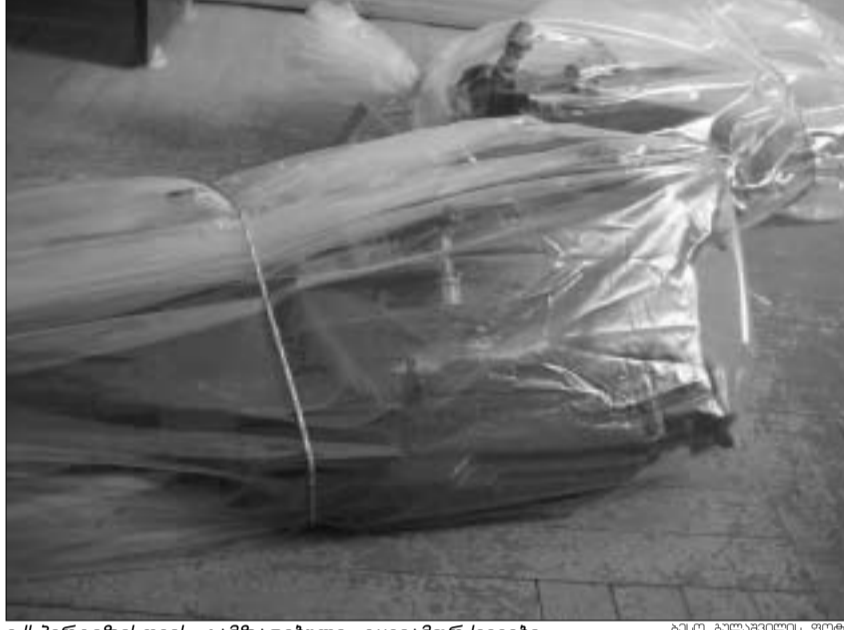
ესპროკურატურის გამზადებული ტყვიამფრქვევები

ვაზიანის სამხედრო ბაზიდან რამდენიმე თვის წინ გატანილი 12 სატანკო ტყვიამფრქვევი გუშინ თბილისის ზღვის ტერიტორიაზე მდებარე ერთ-ერთ მიტოვებულ, თითქმის დაანგრეულ შენობაში აღმოაჩინეს. ანონიმური ზარის ავტორმა სამხედრო კონტრაფაქტების სამსახურს გადასცემული დიდალი იარაღის კონკრეტული ადგილმდებარეობა მიუთითა. ოპერატიული ინფორმაციის საფუძველზე სასწრაფოდ ჩატარდა სპეცოპერაცია. დღითივე არსებობდა ვერსია, რომ შენობის მიმდებარე ტერიტორია, შეიძლება და, დანალექი ყოფილიყო. ანონიმის მიერ მითითებულ შენობაში შესვლამდე, უშიშროების სამინისტროს სამხედრო კონტრაფაქტების სამმართველოს თანამშრომლებმა ტერიტორია შეამოწმეს და სახეარსაათიანი მუშაობის შემდეგ დაადგინეს, რომ ტერიტორია უსაფრთხო იყო. მითითებულ ადგილას მისულ სამხედრო პროკურატურის ოპერატიული და საგამოძიებო ჯგუფის წევრებს დიდი ძეგნა არც დასჭირებიათ. მიტოვებული შენობის ერთ-ერთი გამოხრეულ კედელში, ყვივის ფერ პლედში გახვეული “კალაშნიკოვის” სისტემის 12 სატანკო ტყვიამფრქვევი და სხვა მონყობილობები აღმოაჩინეს. “კედლიდან ბეტონი იყო გამოხრეული, საიდანაც ერთ-ერთი