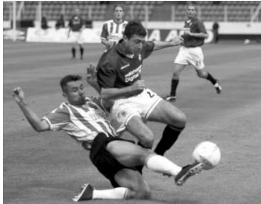
ჟიკოვი - რეინგერსი: არველაძე მღვინის ნინაძემდე