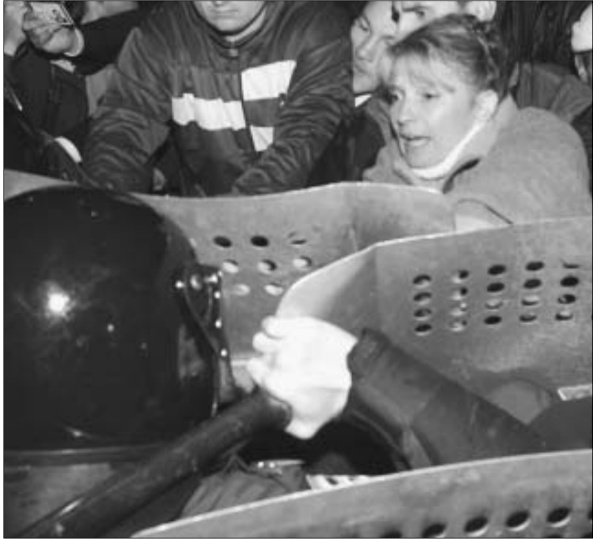
იულია ტიმოშენკო ომონ-ის წინააღმდეგ.

უკრაინის ხელისუფლებამ საპროტესტო ტალღის გაძლიერებამ სერიოზულად შეაშფოთა და იმავე დღეს განსაკუთრებულ ზომებს მიმართა. კერძოდ, კიევში ყველა დამოუკიდებელი ტელეკომპანიის მუშაობა შეაჩერეს და ქალაქის ყველა შესასვლელი საგულდაგულად ჩაქუცეს. ამის შემდეგ ხელისუფლების წარმომადგენლებმა ოპოზიციის საწინააღმდეგო განცხადებების გაკეთება დაიწყეს. მათი თქმით, ოპოზიციის პრეზიდენტზე ზენილას ახორცილებდა და უშუალოდ ხელს უშლიდა; ოპოზიციის ხელმძღვანელთა ქმედებები უკრაინის იყო და თავისუფლების აღკვეთით უნდა დასჯილიყო. ხელისუფლების მტკიცებით, აქციის მონაწილეთა ასაფრთხილები მოწყობილობებისა და ავტომობილების იყენებმა შეიარაღებული შინაგან საქმეთა მი-