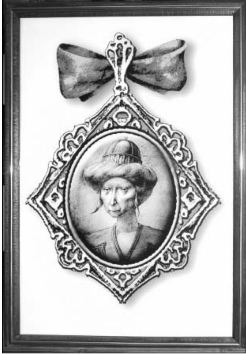
ალა მამუდაძის ხანის ორდენი.