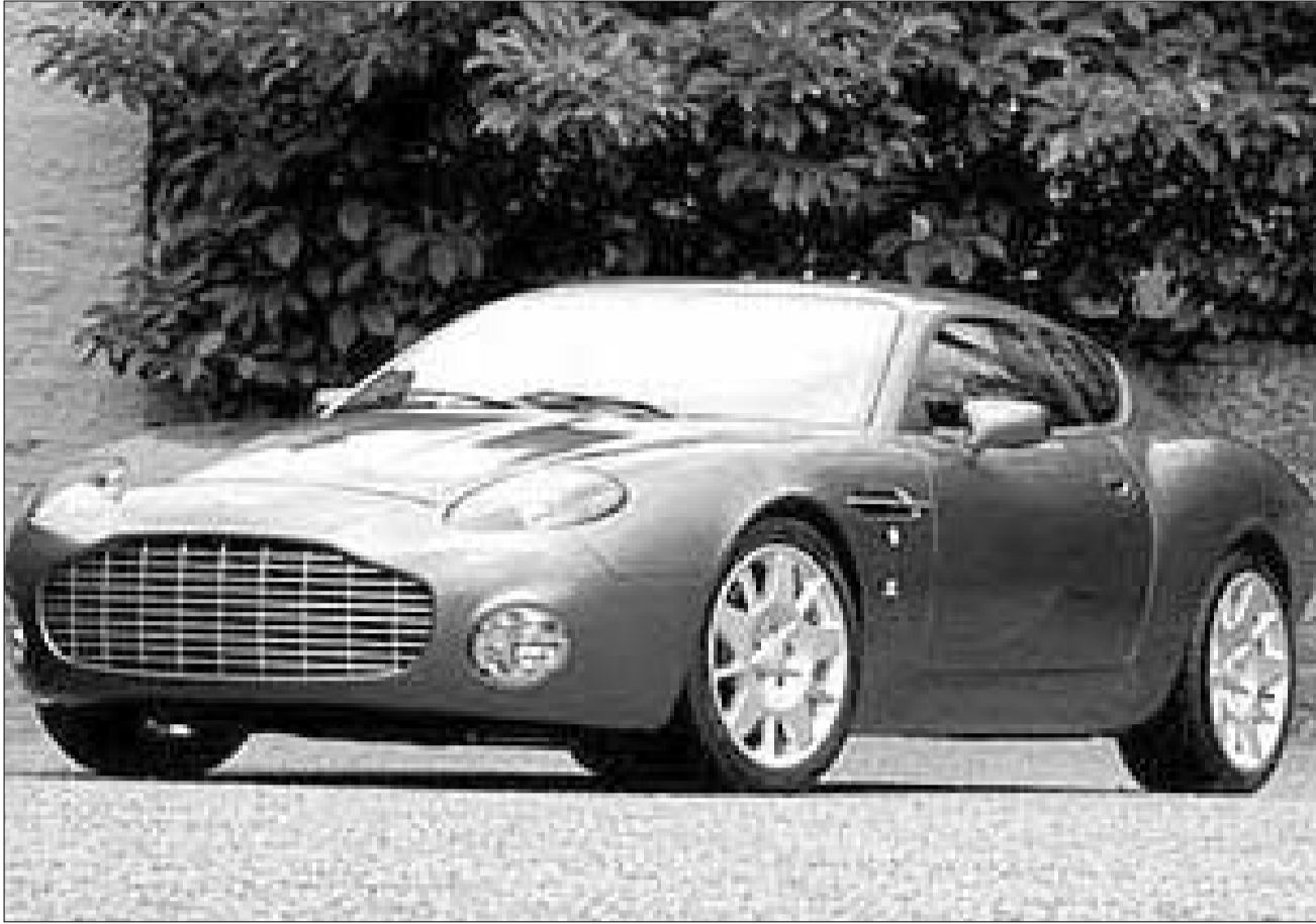
"ასტონ მარტინი"-ს ახალი მოდელი

საერთოდ, ახალი მოდელების პრეზენტაციისთვის საავტომობილო კომპანიები დიდ ავტოსალონებს არჩევენ, რათა სიახლე დებიუტშივე იხილოს პოტენციურ მყიდველთა რაც შეიძლება დიდმა აუდიტორიამ.