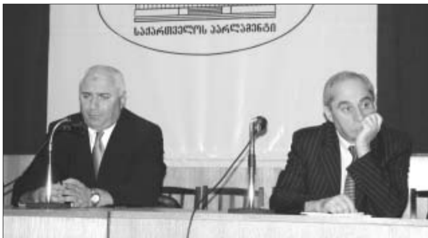
ძნელი მსჯელობა დოკუმენტზე რომელიც არ გინახავს.

აქვე ისიც უნდა ითქვას, რომ, ჩვენ ხელთ არსებული ინფორმაციით, კანცელარია ამ პროექტის მომზადების დროს არ გაითვალისწინა ანტიკორუფციული საბჭოს რეკომენდაცია ენერჯეტიკისა და კავშირგაბმულობის სამინისტროების გაერთიანების თაობაზე და ახალ პროექტში ეს ორი სამინისტრო ისევ ძველი სახით არსებობს. დღეს დისკუსია სწორედ ამ სამინისტროებისა და მარეგულირებელი კომისიების არსებობა-არარსებობის შესახებ მიმდინარეობს.