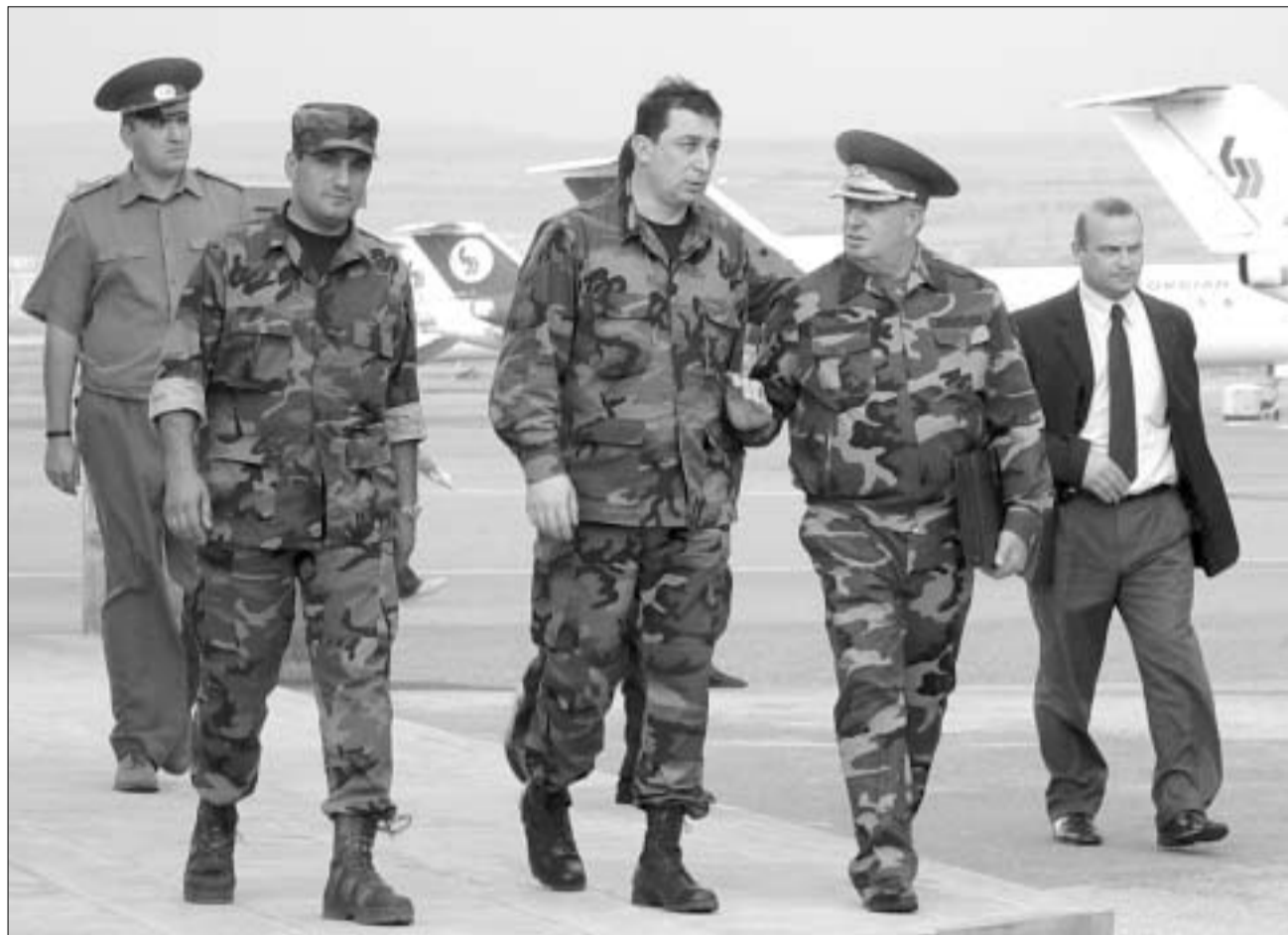
აეროპორტში ძალკვნება პრეზიდენტი დაამშვიდეს და გასცილეს.