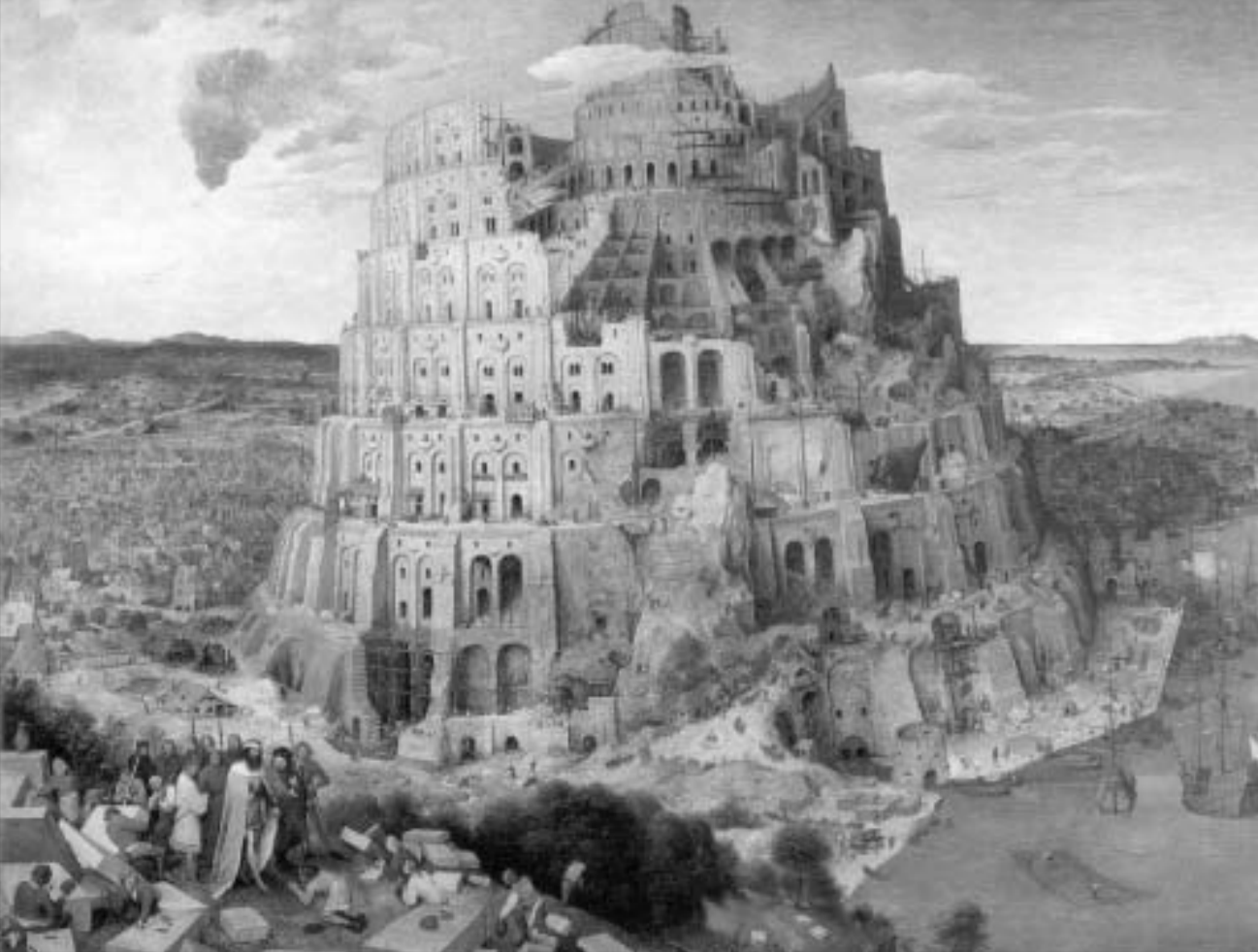
პეტერ ბრიველ უფროსი. "ბაბილონის კოდალი".

ავტორები: ნოდარ ლაბარინ ლილა ბაზარაშვილი