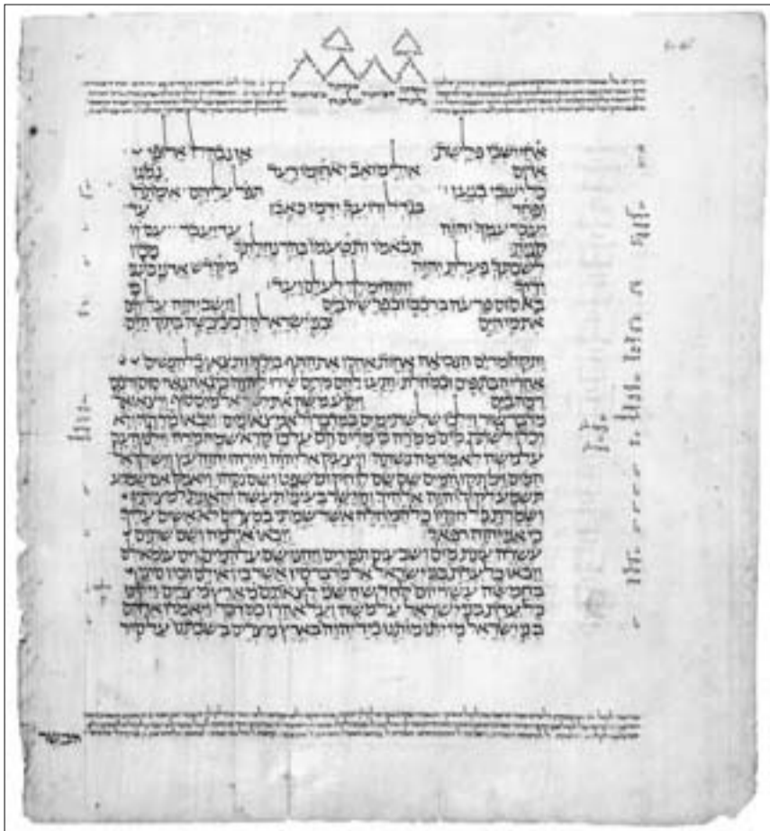
ებრაული ბიბლიის ხელნაწერი.

ჯერ ორი ამბავი უნდა მოგიტხროთ. ერთი ძველი და დაუჯერებელი, აი, მითს რომ ეძახიან, თუმცა კი ისტორიის მამის, ჰეროდოტეს ნიგანიდანაა ამოღებული.