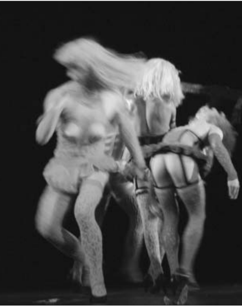
"რუსული ტანგო - მეთოჯინის მოლოდინში"

ბაზე. ხშირია (გარდაცვლილ მხატვართა ნამუშევრებზე) ფალსიფიკაციის შემთხვევებიც. რაზეც მოთხოვნილება არსებობს, ფალსიფიკატორიც იმაზე მუშაობს."