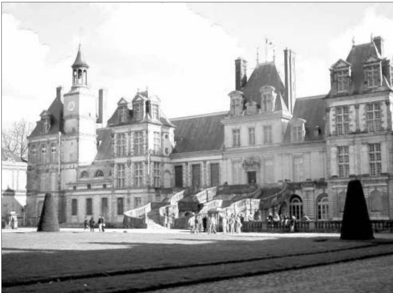
ფრენტლოს ციხედარბაზი. თეთრი ცხენის ეზო.

ძალიან დიდი დამტებით, მაგრამ მინც შეიძლება ვთქვათ, რომ კახლის ეს დარგები ისევე შეესაბამება ენათმეცნიერებას, როგორც ალქიმია — ქიმიას. ასეა თუ ისე, კახალისტურ სიბრძნეს აღქმისაზე ნაკლებად არ მოუზიდავს გვიანი შუასაუკუნეებისა და აღორძინების ხანის ევროპელი სწავლულები.