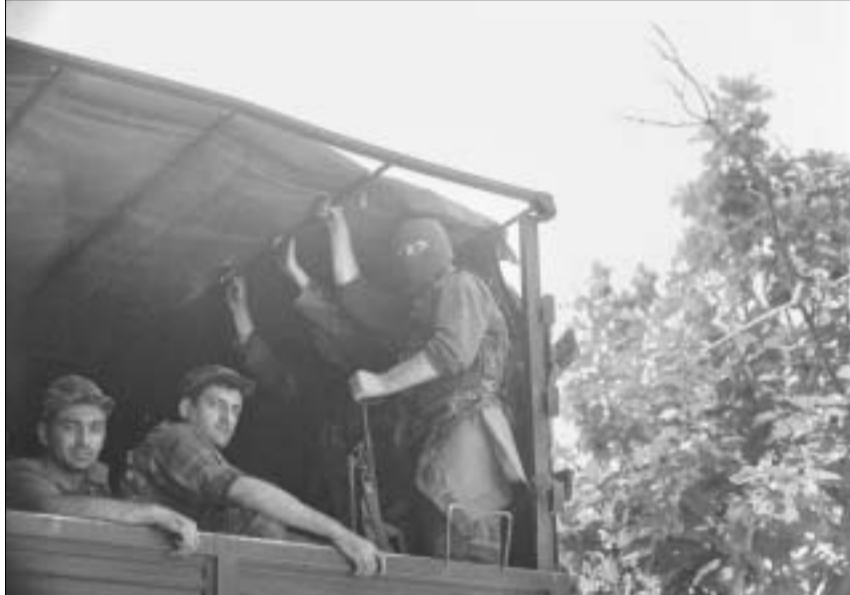
შინაგანი ტარი და სვეცრაში დილაუთუნია გადის ხალანანის ოპერაციაზე.