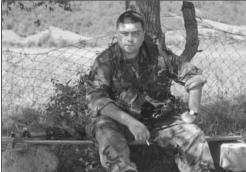
მძიმე დღის შემდეგ.