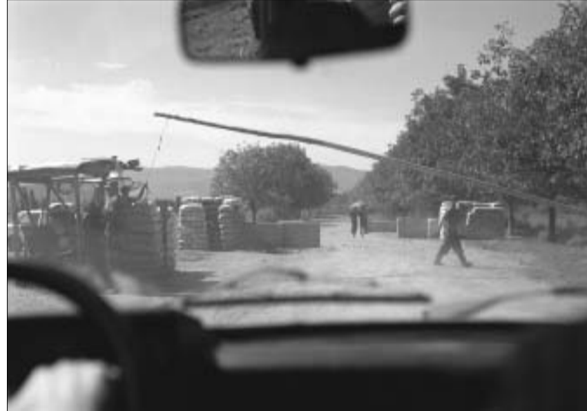
ბლოკოსტი სოფელ ხალანანში.