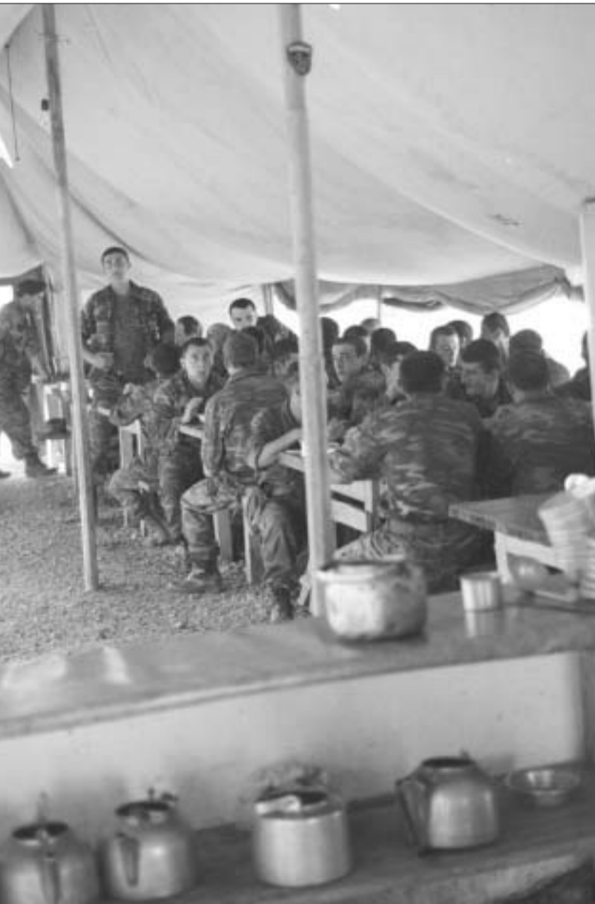
საველე სასადილო სოფელ ხალანანში.

გუშინ საღამოს პანკისის ხეობაში დამატებითი ძალები შევიდნენ. რომელ სოფელში და როდის გაგრძელდება სპეცოპერაციები და კრიმინალთა წმენდა, ჯერჯერობით უცნობია. ეს, ალბათ, გუშინ გვიან ღამემდეგ გაგრძელებულ ძალოვანთა საგანგებო თათბირზე გადამწყვეტია, რომელიც თელავის სამხარეო პოლიციის შენობაში გაიმართა და რომლის დეტალებიც გასაიდუმლოებულია.