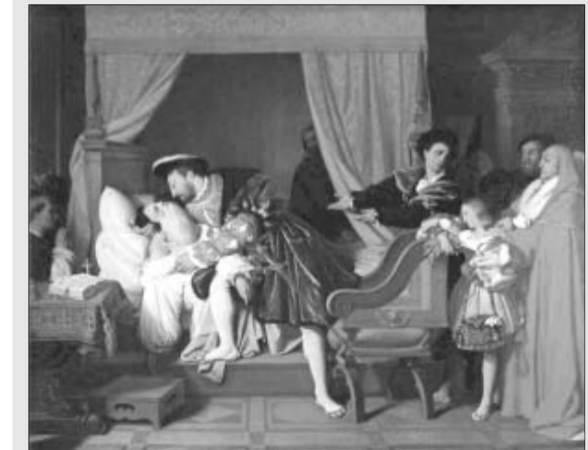
დომენიკ ენერი. ლონარდოს სიკვდილი.

ფრანსუამ მოახზადა ჟაკ კარტიეს (1491-1557) ექსპედიცია, რომელმაც გამოიკვლია ჩრდილოეთ ამერიკის სანაპირო და ფრანგული ინტერესები გაავრცელა კანადაში. მთელი თავისი ცხოვრებითა და ისტორიული როლით ფრანსუა მიჩნეულია "მეფე-მზის", ლუი XIV-ის წინამორბედად და საფრანგეთის ეროვნულ სახელმწიფოდ ჩამოყალიბების ერთ-ერთ პირველ ხელშემწყობად.