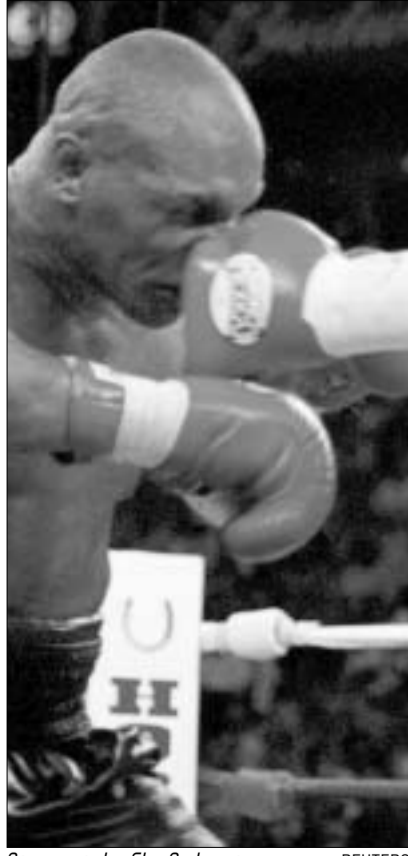
მაკი ტაისონს მოხვდა.

სპეციალისტები ვარაუდობენ, რომ დიდ პრომოუტერს, ლუისთან დაკავშირებით, თავისი გეტემბი აქვს და ამიტომ ცდილობს ბრიტანელის გზიდან ჩამოშორებას. დონ კინგი