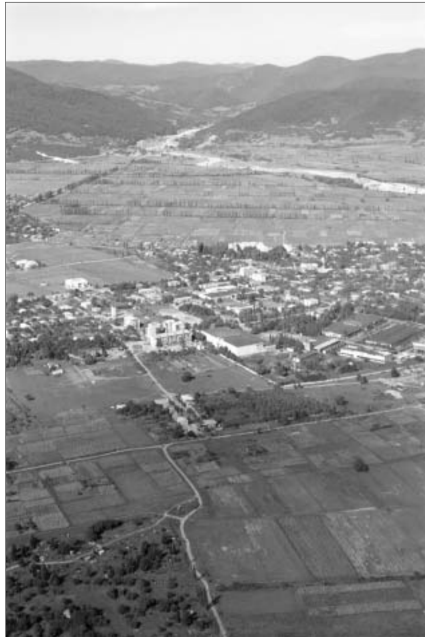
პანკისის ხეობაში ოპერაცია გრძელდება.