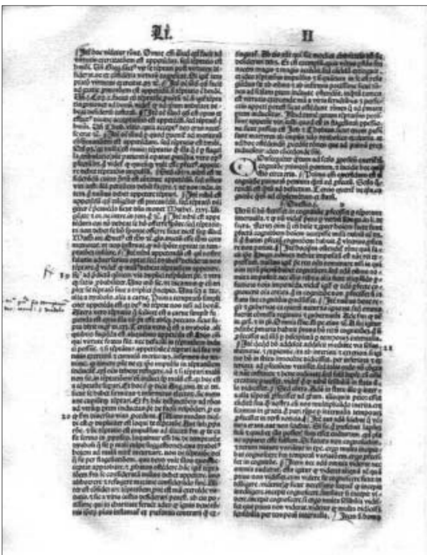
პირველი ლათინური ნახტქდი ბიბლია, 1491 წ.

შეიძლება ვთქვათ, რომ მიუხედავად პოსტელის ზოგი თვალსაზრისის აბსურდულობისა (რაც თავისთავად ბუნებრივია, რადგანაც მისი აზროვნება ნაწილობრივ მაინც მისი თანამეორევე კულტურის ჩარჩოებით იყო განპირობებული), ფრანგმა ერუდიტმა მნიშვნელოვნად გაუსწრო თავის ეპოქას, მაგრამ ამჟვე დროს ჩამორჩა კიდევ მას. ერთი