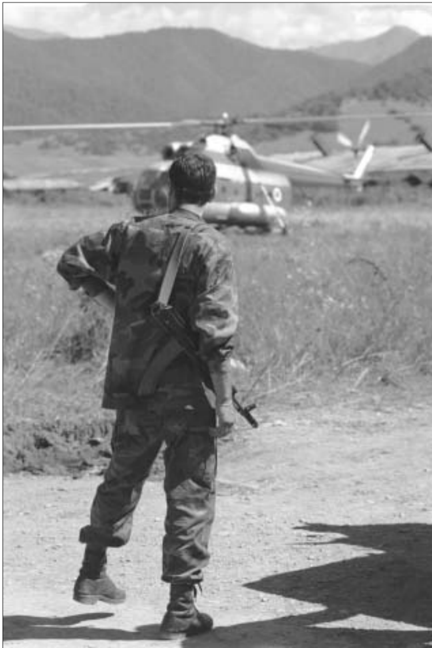
ხალანანი. საველე აეროდრომი.