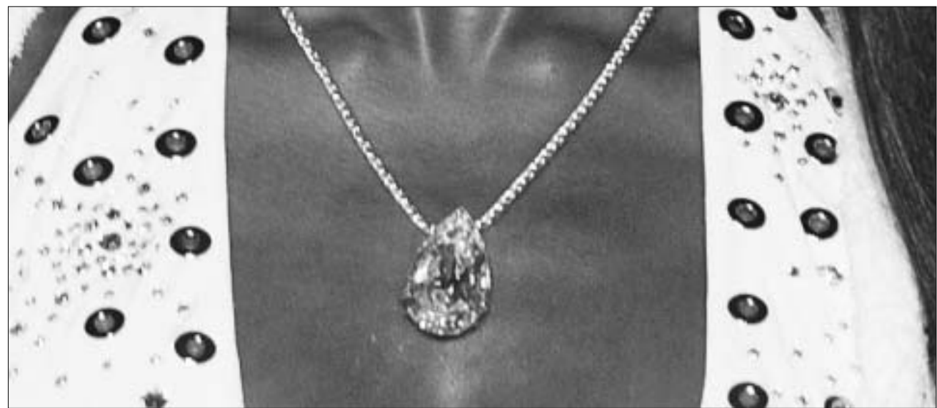
ეს ბრილიანტები ნამდვილია.

რაც შეეხება უნიკალურ და ძვირად ღირებულ ბრილიანტებს, ისინი შეიძლება, ადამიანისთვის საბედისწეროც კი გახდეს. ცნობილია ბრილიანტმა "რეგენტი" რამდენიმე ადამიანის სიცოცხლე შეინარა და ბოლოს აუქციონიდან გაიყიდა; თავისი გიჟური გატაცებით ცნობილი ვასილი კანდინსკის მეუღლე ნინა ანდრეევსკაია, რომლისთვისაც სპეციალურად კარტიე, ვანკლიფი & არპელსი ამზადებდნენ უძვირფასეს, ბრილიანტებით მორთულ სამკაულს, ერთ მშვენიერ დღეს, საკუთარ სახლში მკვდარი იპოვეს. მკვლელობა მისი 2 მილიონ დოლარად შეფასებული ბრილიანტების კოლექცია მოიპარა და კანდინსკის არცერთი სურათისთვის ხელი არ უხლბია.