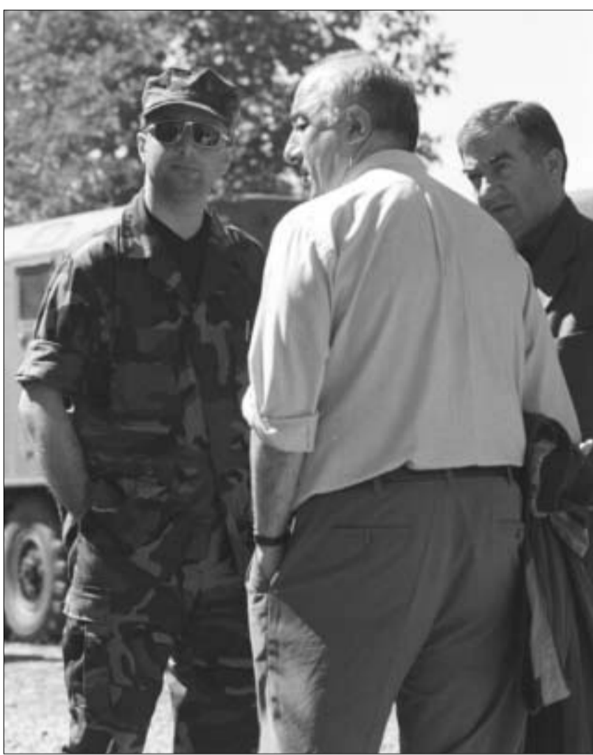
გეგმა თანხმდება უმუშროების საბჭოს მდივანთან.

“ოპერაცია, რომელიც პანკისში მიმდინარეობს, სპექტაკლი ნამდვილად არ გახლავთ. უკვე გადადგმულია სერიოზული ნაბიჯები, მონდებმა თითოეული სახლი, ყველა საკვანძო ადგილს ქართველი სამართალდამცველები აკონტროლებენ. ეს მაშინ, როცა ყოფილი ძალოვანი მინისტრების დროს პანკისის ხეობაში სამართალდამცველთა შესვლა წარმოუდგენელიც კი იყო. რა თქმა უნდა, ხელისუფლების უფასო ადვოკატობა ჩვენი საქმე არ არის, მაგრამ ამ ყველაფერს ევროსაბჭოს მაინც მოვასვენებთ. იქვე გაკეთდება განცხადება, რომ პანკისის პრობლემა რუსეთ-ჩრჩენეთა სისხლიანი კონფლიქტის შედეგია და იგი საქართველოს არ შეუქმნია. სამაგიეროდ, დღეს უკვე ყველაფერს აკეთებს მის მოსაგვარებლად”.