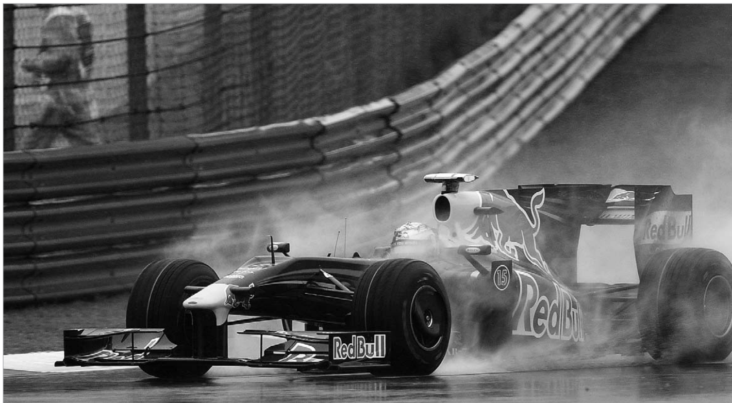
"რედ ბულის" წარმატება შანხაიში

წვიმიან რბოლაში, პოზიციის დაუკარგავად, სამეფო რბოლათა მიმდინარე სეზონის პირველ გამარჯვებას გამოჰკრა ხელი რედ ბულის გერმანელმა მესაჭემ სებასტიან ფეტელმა. ავსტრიულმა საჯინობო შანხაის ტრასაზე მრბოლთა დამსახურებით დუბლიც გაახერხა. ეს გუნდის ისტორიაში პირველი შემთხვევაა. შანხაიში განვითარებულ წმინდა სპორტულ მოვლენებს შეეგებათ და, ზოგადად, ჩინეთის დიდ პრიზთა და კავშირებულ რამდენიმე საინტერესო ფაქტზე გავამახვილოთ ყურადღება.