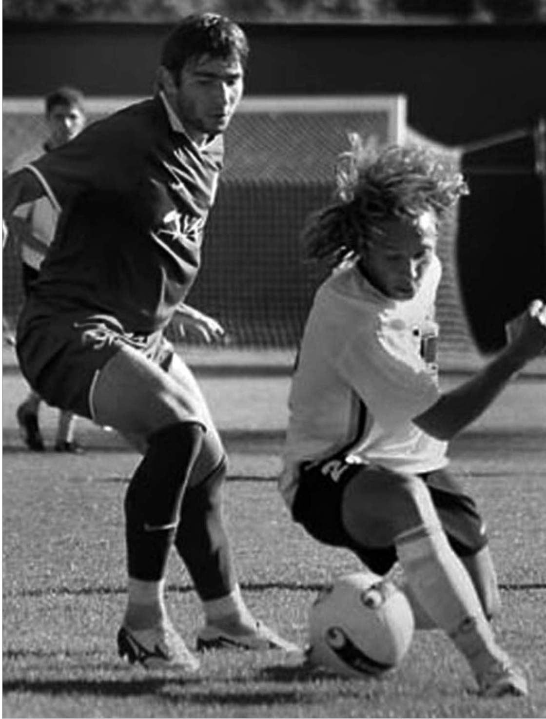
ხმალიდან გამარჯვების გოლი გაიტანა