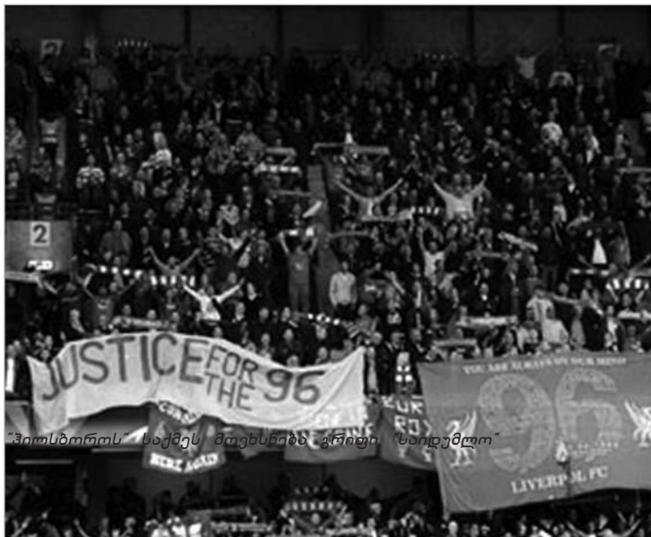
ჰილსბოროს საქმის მოხსნაზე ღრძობი “საიდუმლო”

ალბათ გახსოვთ გასულ კვირაში გამართული ჩემპიონთა ლიგის მატჩები. შეამჩნევდით, რომ ინგლისური კლუბები მინდორზე შავი სამკლაურებით გავიდნენ, რითაც პატივი მიაგეს ჰილსბოროს ტრაგედიის დროს დაღუპულებს.