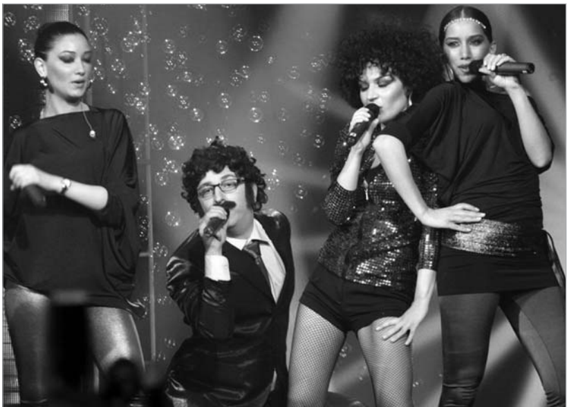
Altervision სტუდენტსა და 3G-ს მხარდასაჭერად იმართება

Tbilisi Open Air - Altervision-ისთვის მზადება უკვე გადამწყვეტ ფაზაშია შესული. ამჟამად დარჩენილია მხოლოდ რამდენიმე საორგანიზაციო და ტექნიკური საკითხი. სხვა მხრივ ყველაფერი მზადაა და ახლა მხოლოდ კარგი მუსიკისა და მსმენელის ერთმანეთთან შესახვედრად ემზადება. შეხვედრის ადგილი კი როგორც გითხარით, თბილისის იპოდრომა - სამი დღის განმავლობაში სწორედ ეს ადგილი იქნება ქვეყნის ყველაზე ხმაურიანი და კულტურულად მნიშვნელოვანი ადგილი. როგორც ფესტივალის ერთ-ერთმა ორგანიზატორმა, მუსიკოსმა ვახო ბაბუნაშვილმა აღნიშნა, იპოდ-