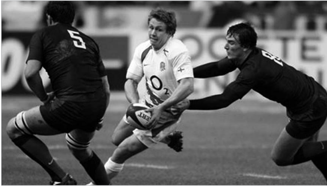
ლეგენდარული ჯონი უილკინსონი მომავალ სეზონში "ტულონის" ღირსებას დაიცავს

ინგლისის ნაკრების ლეგენდარული მორაგბე, 2003 წლის მსოფლიო თასის მფლობელი ჯონი უილკინსონი მიმდინარე სეზონის დასრულების შემდეგ "ნიუკასლიდან" ფრანგულ "ტულონში" გადავა, სადაც ქართველი მორაგბეები დათო ქუბრიაშვილი და გაილაბაძე თამაშობენ. წლიურ ჯამაგირად ინგლისელი 700 ათას ევროს მიიღებს. მასვე გადასცემენ სახლს დიდი აუზით ზღვისპირას. 30 წლის უილკინსონმა თავისი საკლუბო კარიერა "ნიუკასლში" გაატარა. გასული წლის სექტემბერში ჯონიმ მუხლის ტრავმა მიიღო, რის გამოც მთელი სეზონი გაუცდა. მის გარეშე საკმაოდ გაუჭირდა "ნიუკასლს" - ინგლისის ჩემპიონატის პლეიოფში ვერ გავიდა. "ბოლო ერთი კვირაა, ჯონს ჩვენთან არ უვარჯიშია. არ არის საჭირო მისი აღდგენითი პროცესი ფორსირებული მეთოდით დავაჩქაროთ. სირცხვილი იქნება, თუ მისი ბოლო თამაში "გლოსტერთან" შედგება, იმ გუნდთან, რომელთანაც უილკინსონმა ტრავმა მიიღო," - ამბობს "ნიუკასლს" სპორ-