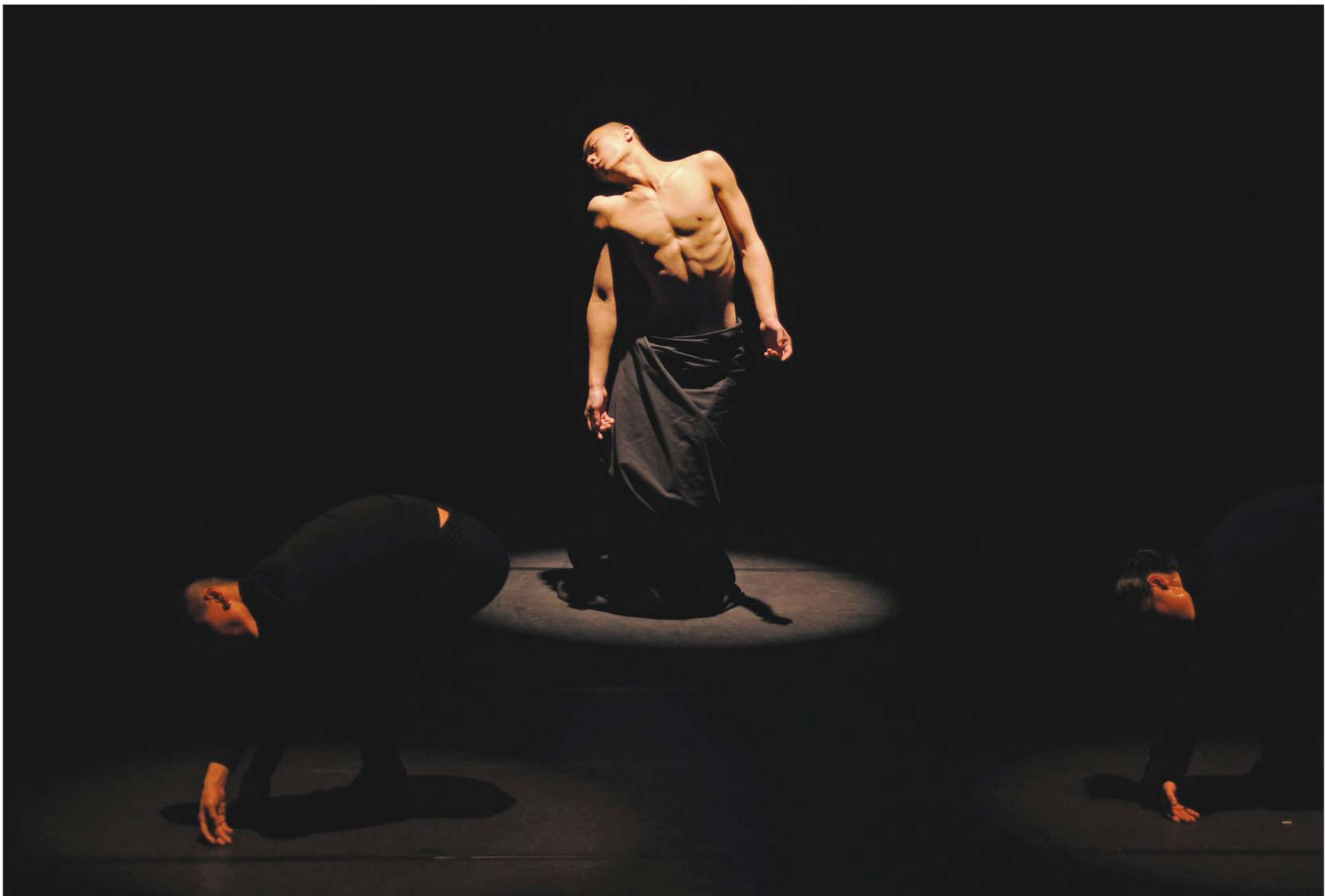
პეკინში თანამედროვე ცეკვის მეორე საერთაშორისო ფესტივალი მიმდინარეობს. ფესტივალს ადგილობრივი ქორეოგრაფიული დასები და საერთაშორისო კომპანიები აფინანსებს, რადგან ჩინეთის მთავრობამ მისთვის თანხის გამოყოფაზე უარი განაცხადა. ამრიგად ფესტივალი მთლიანად ახალგაზრდა მოცეკვავეთა და ქორეოგრაფთა ენთუზიაზმზეა დაფუძნებული. თუმცა ეს ფესტივალი უკვე მიიჩნევა ამ ქანრის ერთ-ერთ მნიშვნელოვან ღონისძიებად.