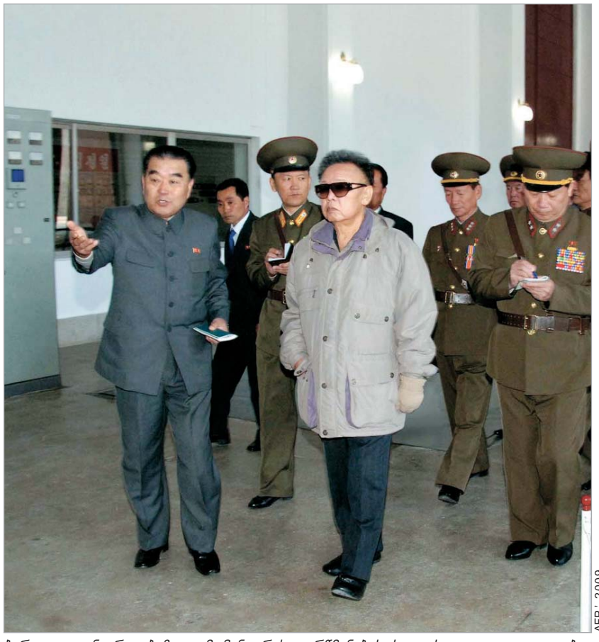
ბირთვულ განიარაღებაზე კიმ ჩენ ირის დარწმუნებას სეულის დელეგაცია ეცდება

თი დღემდე მოქმედი პროექტია საერთო კორეული ეკონომიკური თანამშრომლობის სფეროში. სხვა ყვე-