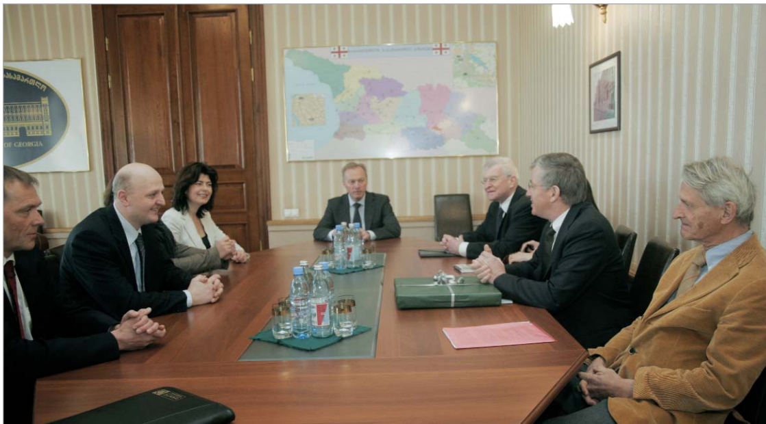
უზენაესი სასამართლოს თავმჯდომარე კონსტანტინე კუბლაშვილი ნორვეგიულ კოლეგას მასპინძლობს.

უზენაესი სასამართლოს თავმჯდომარე კონსტანტინე კუბლაშვილი ნორვეგიულ კოლეგას მასპინძლობს. ნორვეგიის უზენაესი სასამართლოს თავმჯდომარე ტორე შეი ორ მოსამართლესთან ერთად 21 აპრილიდან თბილისში იმყოფება.