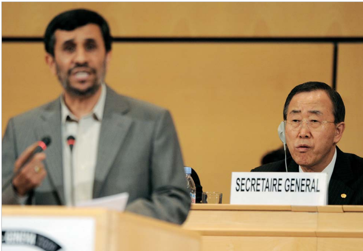
ბან კი მუნის განცხადებით, ირანის პრეზიდენტმა კონფერენციაზე სიტყვით გამოსვლის უფლებით ბოროტად ისარგებლა

თუმცა სწორედ მაშინ, როდესაც ოფიციალური თეირანი დასავლეთისთვის ახალ შეთავაზებას პაკეტზე მუშაობს, ირანმა მათთან ურთიერთობა კიდევ ერთხელ გაიფუჭა. პრეზიდენტ აჰმადინეჯადის გამოსვლა გაერო-ს კონფერენციაზე, რო-