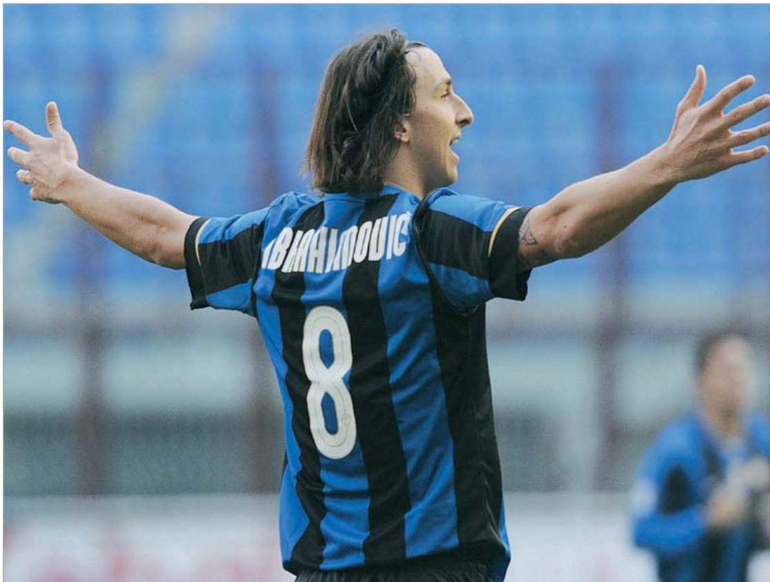
“იბრა” “ინტერში” დარჩება

ცნობილია, რომ “ინტერის” მესვეურებმა იბრაგიმოვიჩის სატრანსფერო თანხა უკვე დაასახლეს - 100 მილიონი ევრო. რა თქმა უნდა თანხა სოლიდურია, მაგრამ მთავარი პრობლემა ეს როდია, საქმე ისაა, რომ ზლატანის ხელფასი ამჟამად წელიწადში 12 მილიონ ევროს შეადგენს და თუ იტალიელ ექსპერტებს დავუჯერებთ ამჟამად ასეთი ხელფასის გადახდელი გუნდის მორძებნა თითქმის შეუძლებელია.