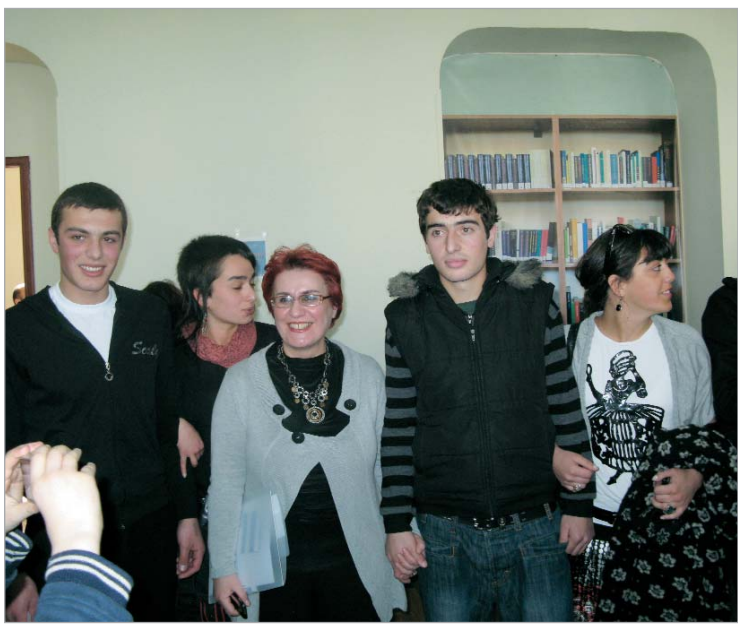
ავჭალის კოლონიაში მინანქრის სწავლება დაინერგა.

ისინი, რა თქმა უნდა, დამნაშავეები არიან და ამიტომაც იმყოფებიან ციხეში. ამ ციხეს სრულად ავჭალის არასრულწლოვანთა აღმზრდელით დაწესებულება ჰქვია, იქ მყოფი ადამიანები კი... ბიჭები არიან, რომლებიც სხვადასხვა სიმძიმის დანაშაულის გამო იხდიან სასჯელს. იქიდან გამოსული ვინ რა გზას დაადგება, პროგნოზის გაკეთება შეუძლებელია, მაგრამ ასევე შეუძლებელია იმ ფაქტის უარყოფა, რომ სასჯელალსრულების დაწესებულებებში მოხვედრილ ადამიანებს, მით უფრო არასრულწლოვანებს, ადამიანური მოპყრობა სწორედ მაკარი რეჟიმის პირობებში სჭირდებათ. ვერ გეტყვით, დღესაც რატომ იმალება საკულდაგულოდ ყველა ინფორმაცია, რაც პენიტენციურ სისტემას ეხება, მათ შორის ისეთიც, რაც ამ სფეროში წინ გადადგმულ ნაბიჯებზე მეტყველებს. არადა, ასეთი ნაბიჯები ჩვენთანაც იდგმება და ეს წერილიც ამასვე მოწმობს.