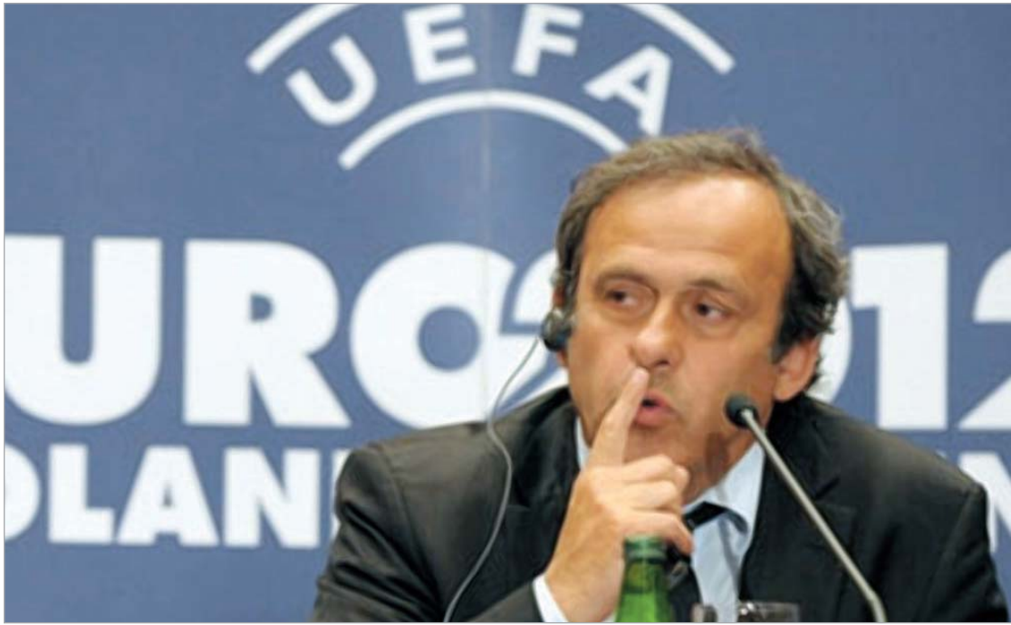
პლატინი რასიზმს ებრძვის

საეჭვოა, რომ იტალიური ფეხბურთის მამებმა ვერდიქტი შეცვალონ, მით უმეტეს, რომ ამ საკითხთან დაკავშირებით საკუთარი პოზიცია უფას პრე-