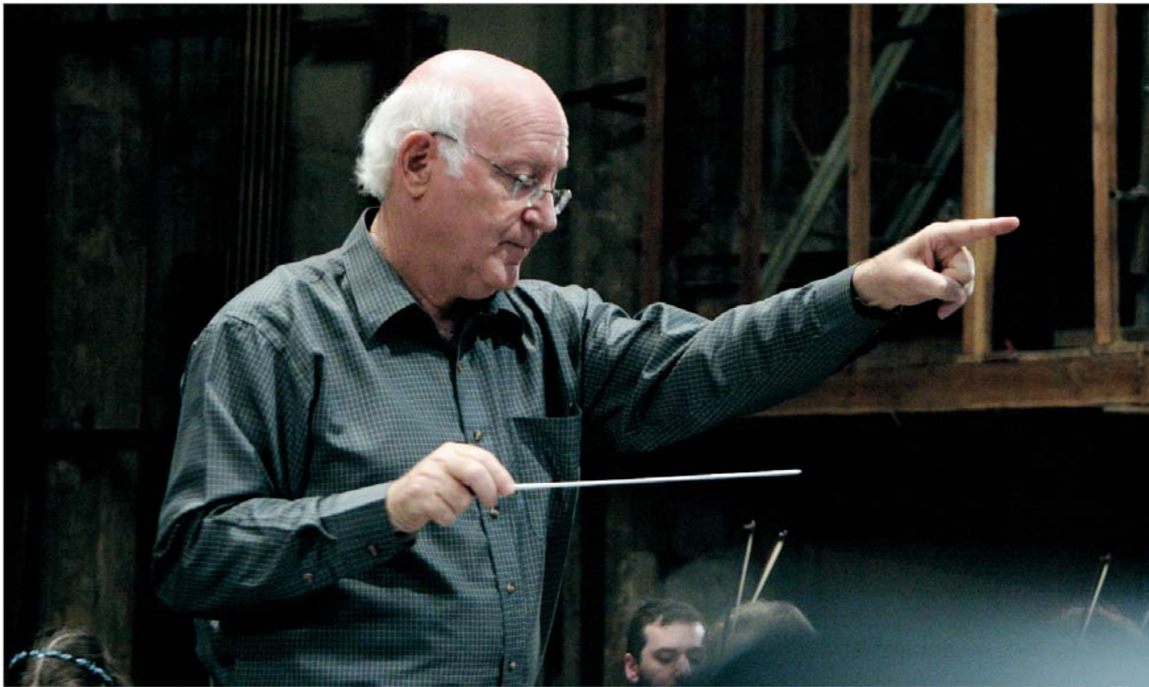
დირიჟორი ავნერ ბირონი

სულ ახლახანს კონსერვატორიის დიდ დარბაზში მსოფლიო მასეტრო ავნერ ბირონი მუსიკალური საღამოების სტუმარი გახლდათ, სოლისტი კი ირმა გიგანი... მოცარტის შესასრულებლად მოცარტისტმა დირიჟორმა სცენაზე ორკესტრის არასტანდარტული შემადგენლობა მოინვა - ორკესტრი კლარნეტების გარეშე. ამაღუსის N40 სიმფონია, რომელიც ვენაში 1788 წელს დაიწერა, ისეთი სტილით უღერდა, როგორც ორიგინალში არსებობს. ავნერ ბირონი ყოველთვის ძველ რედაქციას უბრუნდება შესასრულებლად და მასში "სიახლეებს ეძებს".