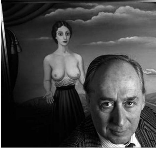
ნეთში უცხოელებისთვის მოწყობილ საკონცენტრაციო ბანაკში ცხოვრობდა. სწორედ ამ წლების შთაბეჭდილებების გამოძახილია მის მიერ 1984 წელს დაწერილი რომანი მზის იმპერია, რომლის მიხედვითაც სამი წლის შემდეგ სტივენ სპილბერგმა არაჩვეულებრივი დრამა გადაიღო. ფილმში მთავარ როლს, ბიჭუნა ჯიმ გრეკემის როლს სრულიად ბავშვი კრისტიან ბეილი ასრულებდა, ხოლო ეს პერსონაჟი მწერალმა საკუთარი თავის მიხედ-