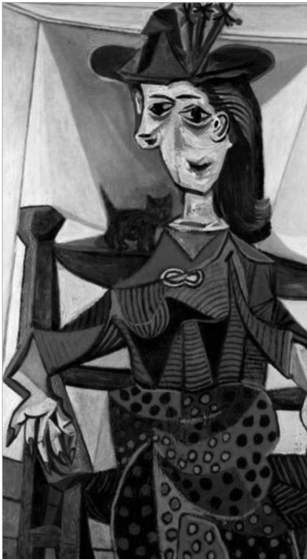
მხატვრისა და კინორეჟისორის ჯულიანა შნაბელის კოლექციის ნაწილია. შნაბელი ავტორია კინოფილმებისა: ბასკია, სანამ დაღამებულა, სკაფანდრი და პეპელა და სხვა. გასულ წელს პიკასოს ნამუშევარი ორი ფიგურა, რომელიც 1934 წელს შეიქმნა, Christie's აუქციონზე ნიუ იორკში 18 მილიონ დოლარად გაიყიდა, ხოლო ნახევარი წლით ადრე მისი 1924

წლის ნატურმორტი 12 მილიონ დოლარად. Christie's აუქციონზე გაყიდული პიკასოს ნამუშევართაგან ასევე ძვირადღირებული აღმოჩნდა ნახატი, რომელიც ცისფერ პერიოდს განეკუთვნება, მისი სახელწოდებაა ქალი გადაჯვარედინებული ხელებით. ექსპერტები ვარაუდობენ, რომ ეკონომიკური კრიზისის მიუხედავად, პიკასოს ქალიშვილის პორტრეტი განსაკუთრებულ დაინტერესებას გამოიწვევს და სარფიანად გაიყიდება. ასეთი მასშტაბის გარიგებებისას, როგორც ნესი, ძვირადღირებულ ნანარმოებთან მიყიდვების საკუთარ ვინაობას არ ასახელებენ. ამის მიზეზია ისიც, რომ არ სურთ ყურადღების ცენტრში მოექცნენ და მათი ქონება განხილვის, გენეზავთ დაკვირვების საგანი გახდეს. მით უფრო, როცა ხელოვნების ძვირფას ნიმუშებზე ნადირობა გრძელდება.