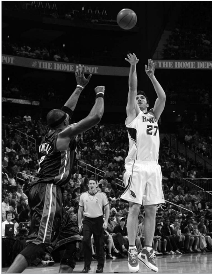
ფაჩულია მეტოქის ფარს უტევს

უკანასკნელი ორი დღე დატვირთული გამოდგა საქართველოს საკალათბურთო ნაკრების იმ მოთამაშეებისთვის, რომლებიც უცხოეთში ასპარეზობენ. ჩვენმა ბიჭებმა მეტ-ნაკლები წარმატებით ითამაშეს საკუთარი გუნდების შემადგენლობაში. საუბარს, ცხადია, დავინწყებთ ზაზა ფაჩულიას ატლანტა ჰოუქსით, რომელმაც NBA-ს აღმოსავლეთ კონფერენციის პლეიოფის პირველ რაუნდში მეორე მატჩი გამართა მაიაში ჰითთან. პირველ შეხვედრაში ჯორჯიელებმა მეტოქე პირწმინდად დაჩაგრეს, ზაზა ფაჩულიამ კი ორმაგი დუბლი მიითვალა. ზედიზედ მეორე მარცხი მაიაშელთათვის კატასტროფა იქნებოდა. ამიტომ მეორე მატჩზე ჰითის კალათბურთელები საოცარი შემართებით გამოვიდნენ. განსაკუთრებით აქტიურობდა მაიაშელთა ლიდერი დუეინ ვიდი, რომლის წყალობითაც ჰითმა სტუმრად გაიმარჯვა ანგარიშით 108:93 და სერიაში ანგარიში გაათანაბრა. ვეიდეა შეხვედრა 33 ქულით, 5 მოხსნით და 7 შედეგიანი გადაცემით დაასრულა. ის ორივე გუნდის შემადგენლობაში საუკეთესო იყო. რაც შეეხება ზაზა ფაჩულიას, როგორც მოსალოდნელი იყო, მაიკ ვუდსონმა ის კვლავ სათადარიგოთა სკამიდან ჩართო თამაშში და სულ 15 წუთი მისცა თავის გამოსაჩენად. დროის ამ მონაკვეთში ზაზამ თავის გუნდს 3 ქულა და 3 მოხსნა შეანია. ფაჩულიას მთავარმა კონკურენტმა ალ ჰარფორდმა ერთი შეხედვით კარგად ითამაშა და ორმაგი დუბლიც გაახერხა (11 ქულა და ამდენივე მოხსნა), თუმცა, თუ სტატისტიკას გადავხედავთ, ვნახავთ, რომ ჰარფორდისთვის ეს არც ისე წარმატებული მატჩი იყო. ატლანტას ძირითადმა ცენტრმა თამაშიდან ნატყორცნი 9 ბურთიდან მხო-