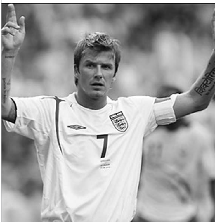
ბექჰემს სთავაზობენ მშობლიურ ქალაქში დაასრულოს კარიერა

როგორც იცით, ამჟამად დევიდი მილანში თამაშობს, თუმცა 2009 წლის ოქტომბრამდე ამერიკული ლოს ანჯელეს გელექსის კუთვნილებაა. დევიდმა სეზონი იტალიურ გრანდში უნდა დაასრულოს, ზაფხულში კალიფორნიულ გუნდს შეუერთდეს და ოქტომბრამდე ითამაშოს. შემდეგ, წესით, ისევ მილანში უნდა დაბრუნდეს და 2009-10 წლების სეზონი როსონერიში დაასრულოს. ამის შემდეგ კი ბექსის ბედი გაურკვეველია. ფეხბურთელის ასაკის გამო შესაძლოა მილანმა მასთან კონტრაქტი არ გაახანგრძლივოს. ასეთ ვითარებაში დევიდისთვის ტოტენჰემი იდეალური ვარიანტი იქნება - ფეხბურთელს საშუალება მიეცემა მშობლიურ ქა-