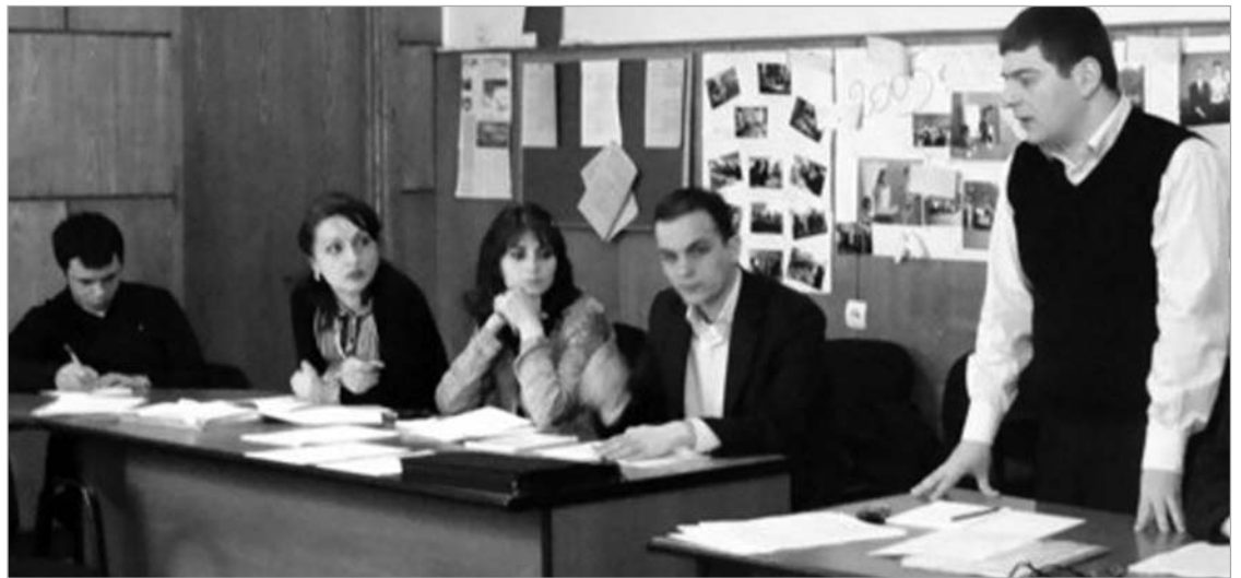
ქვემო ქართლის ბიუროების სტაჟიორებისათვის სემინარი გაიხსნა.

სემინარის ფარგლებში განიხილავენ ნორვეგიის სამართლებრივ სისტემას. ასევე, ყურადღებას დაუთმობენ აღკვეთის ღონისძიების არგუმენტების წარდგენასთან დაკავშირებული პრაქტიკული საკვანძოების შესრულებას, როგორც თანამშრომლებსა და დისკუსიებს.