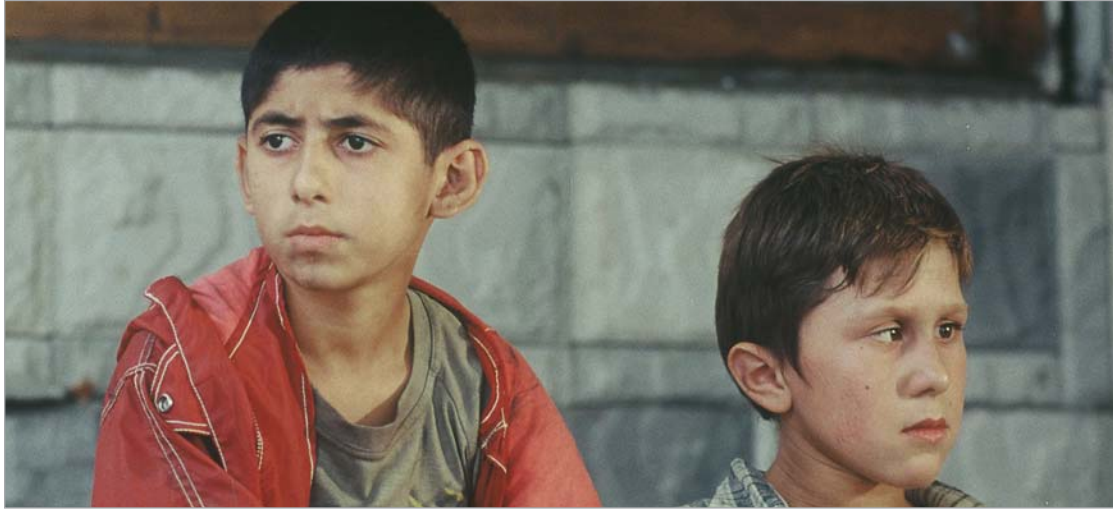
კადრი ფილმიდან "გალბა ნაპირი"