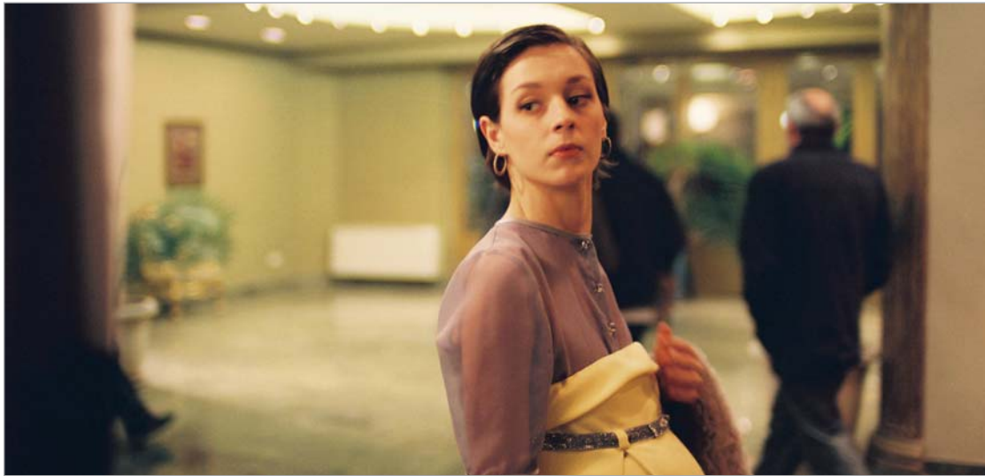
კადრი ფილმიდან "მედიატორი"