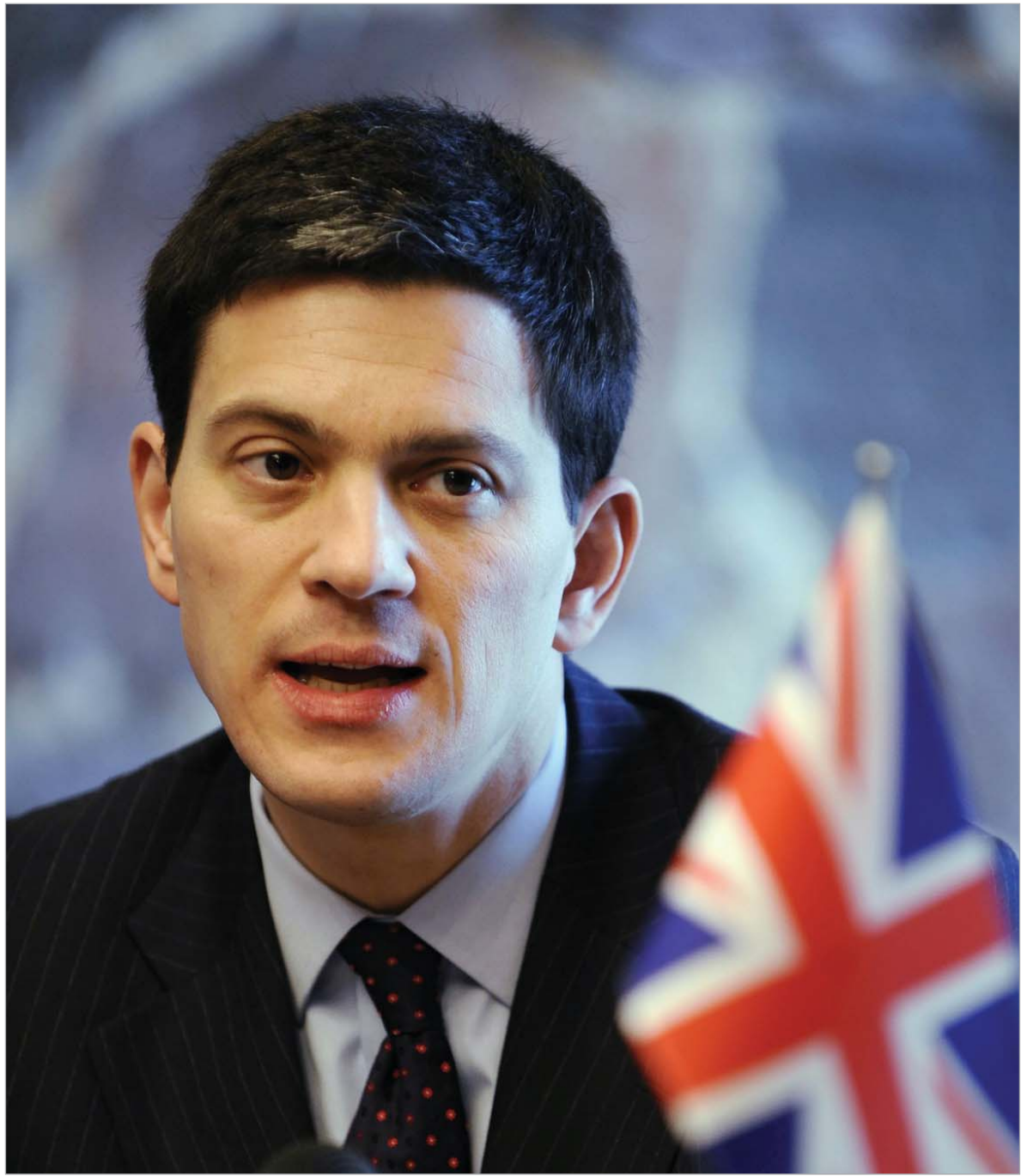
დევიდ მილიბენდი: "ნატო საქართველოს სეპარატისტული რეგიონების დამოუკიდებლობას და რუსეთის გავლენის სფეროებს არასდროს აღიარებს"