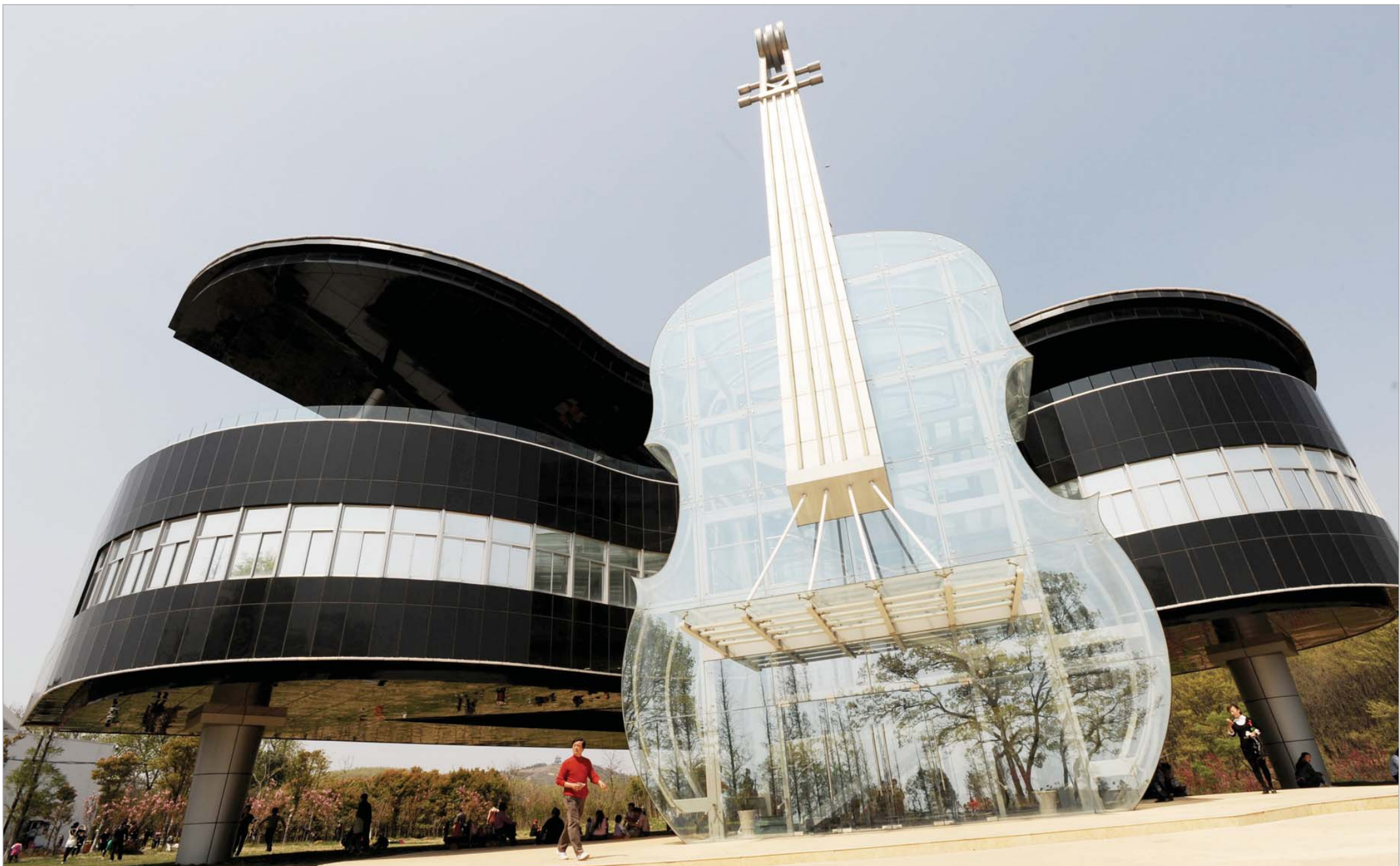
ჩინეთის ერთ-ერთი პროვინციის ქალაქ შუაინანში უნიკალური არქიტექტურის მქონე ხელოვნების მუზეუმი გაიხსნა. მას წინიდან მინის უზარმაზარი ვი-ოლინოს ფორმა აქვს, უკანა ფასადი კი შავი როიალის ფორმისაა. ეს უღამაზესი შენობა უზარმაზარ მწვანე მინდორშია აგებული და შიგთავსის გარდა ტურისტების ინტერესს ამ კონცეპტუალური დიზაინითაც იქცევს.