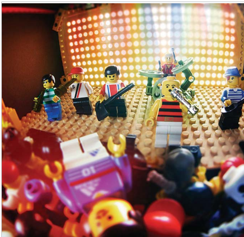
კიდევ დაემატება რამდენიმე შემსრულებელი. სხვათა შორის, ლეგო როკ ბენ-

უკვე ცნობილია ისიც, რომ თამაშში შენარჩუნებული იქნება როკ ბენდის სერიების თამაშებისთვის არსებული ყველა დამატებითი კონტროლერი - გიტარა, მიკროფონი, დასარტყამი ინსტრუმენტი და ასევე კარაოკეს სისტემაც. თამაშის დეველოპერმა კომპანიებმა ისიც აღნიშნეს, რომ ლეგო როკ ბენდი ძირითადად მოზარდ მომხმარებელზე იქნება გათვლილი და მასში შესულ სიმღერებსაც ამ ასაკობრივი კატეგორიის გემოვნებით იქნება შერჩეული. მაგალითად ცნობილია, რომ თამაშისას შესაძლებელი იქნება შემდეგი სიმღერების იმიტირება: Song 2 (Blur), Boys and Girls (Good Charlotte), So What (პინკი), The Final Countdown (Europe), Kung Fu Fighting (კარლ დუგლასი) და სხვა. ამ ჩამონათვალს ცხადია