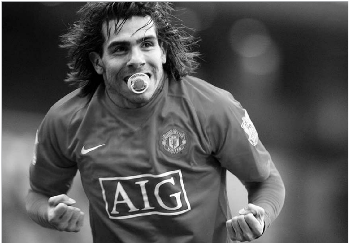
ტევესი "მანჩესტერს" დატოვებს

ინგლისის მანჩესტერ იუნაიტედისა და არგენტინის ნაკრების ფორვარდი კარლოს ტევესი მანკუნინური კლუბის დატოვებას აპირებს. ამის შესახებ ინფორმაცია ბრიტანულმა მედიამ გაავრცელა.