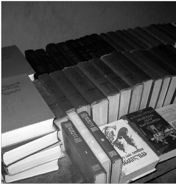
ნა ვაჟაა ვაჟაა

დოგენეს, სიესტას, ბაკურ სულაკაურის გამომცემლობის, ინტელექტისა და სხვა მეტ-ნაკლებად ცნობილი გამომცემლობების გარდა წიგნის დღეში მონაწილეობის უფლება ამ სფეროს ინდემნარმეებმა მიიღეს - ანუ მათ, ვინც საკუთარი ან სხვისი ბიბლიოთეკებიდან გამოტანილ წიგნებს ქალაქის