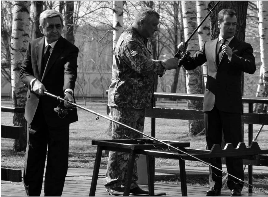
რუსულმა მედიამ მოსკოვში სერჟ სარგსიანის ვიზიტი საქართველოში დაგეგმილ წვრთნებს დაუკავშირა

თუმცა, გუმბინდელი შეხვედრის შემდეგ სარგსიანს და დემიტრი მედვედევს ამ საკითხზე საჯაროდ არ უსაუბრიათ. მათი გან-