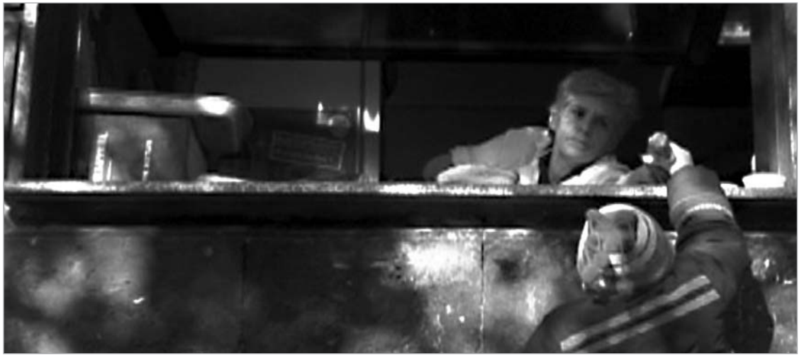
კადრი ნონა გიუნაშვილის ფილმიდან "ფანჯარა"

ნონა გიუნაშვილი: ჩემთვის ჯართოსანი უფრო სერიოზული ნამუშევარია და როდესაც ფანჯარა შეარჩიეს, დავფიქრდი, რა შეიძლება მოსწონებოდათ მასში ევროპელებს. შევცადე ფილმისთვის რამდენიმე კუთხით შემეხედა. ევროპული კინო უპირატესობას ანიჭებს იმას, რომ ყოველი წამი იყოს ემოციურად დატვირთული და იმპულსის მიმცემი მასურებისათვის და არაფერ შუაშია