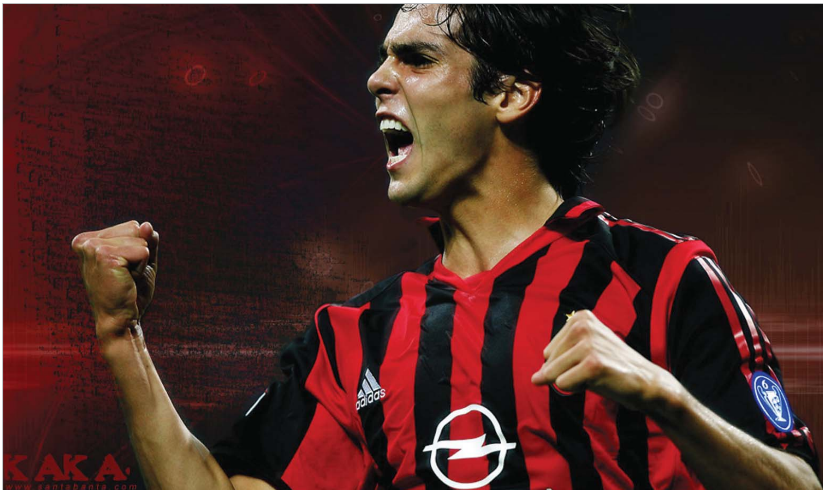
კაკა "მილანს" ერთგულებას ჰპირდება

უკვე აღარ ვიცი, რა ვთქვათ. ყოველ ჭორზე მინეეს კომენტარის გაკეთება. მგონი ჩემი საქციელით უკვე დავამტკიცე, რომ მილანის ერთგული ვარ. მეტი რაღა დავამატო. კიდევ ვიმეორებ: მომწონს კლუბი, არსად წასვლა არ მინდა. კმაყოფილი ვარ ყველაფრით, რაც მაქვს, - ამბობს კაკა.