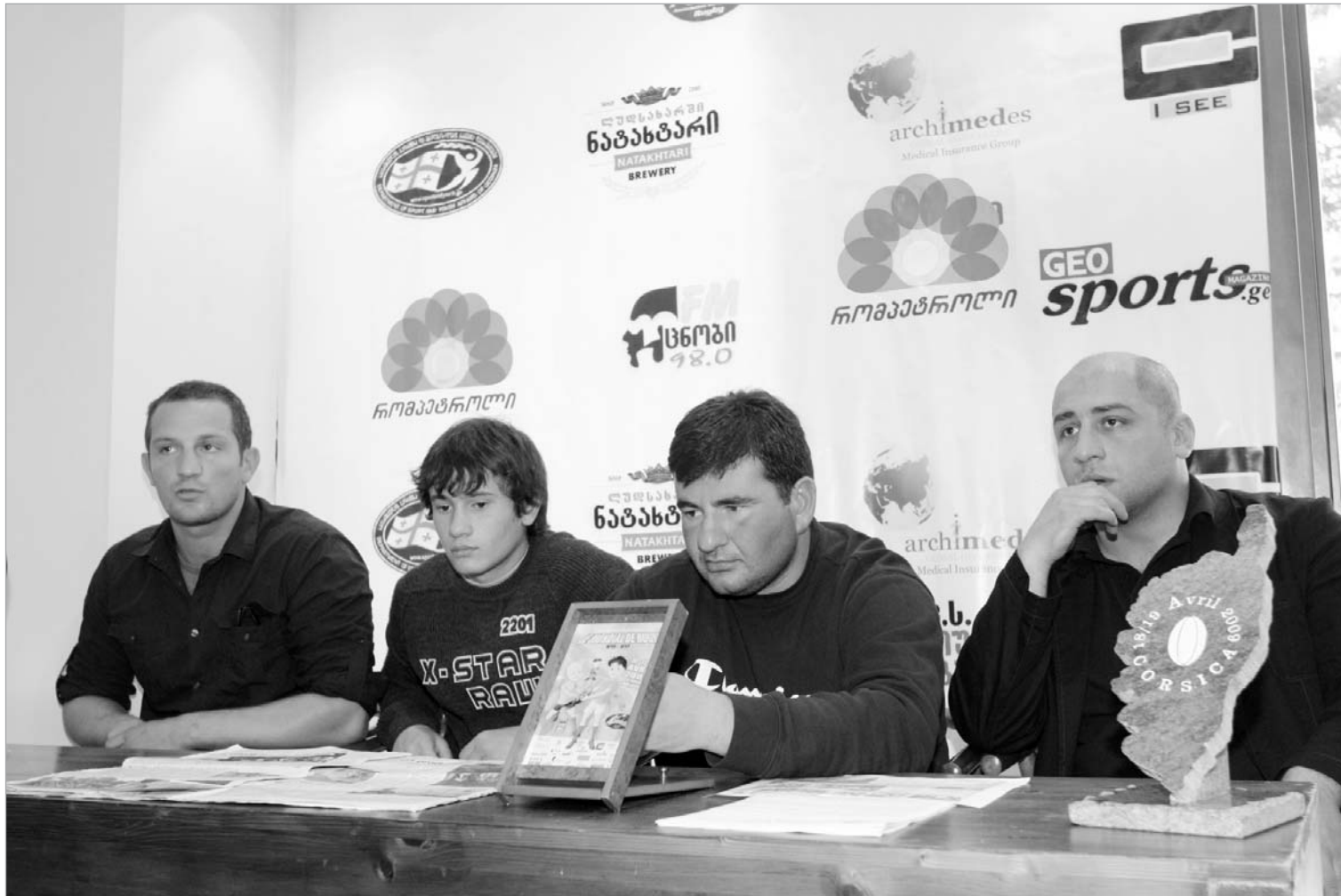
კახე დისქვერში 15 წლამდე მორაგბეთა ნაკრები დაუმარცხებელი დაბრუნდა

15 წლამდე მორაგბეთა ნაკრები დაუმარცხებელი დაბრუნდა