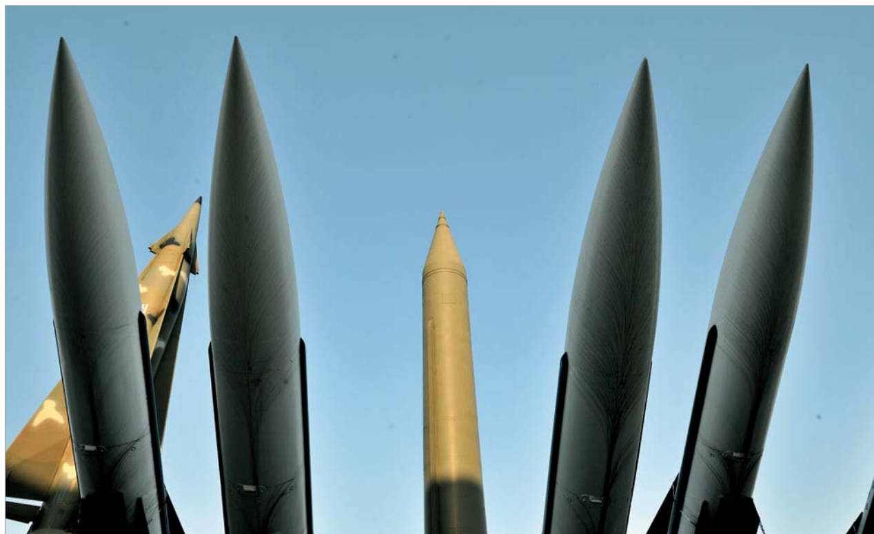
AFP - 2009

2009 წლის 5 აპრილს ჩრდილოეთ კორეამ სამხრეთიანი ბალისტიკური რაკეტა “ინხა-2” გამოსცადა. ფხენიანის ცენტრალურმა სატელეგრაფო სააგენტომ გაავრცელა ინფორმაცია, რომ რაკეტამ ორბიტაზე კავშირგაბმულობის ექსპერიმენტული ხელოვნური თანამგზავრი “კვანმენსონ-2” გაიყვანა.