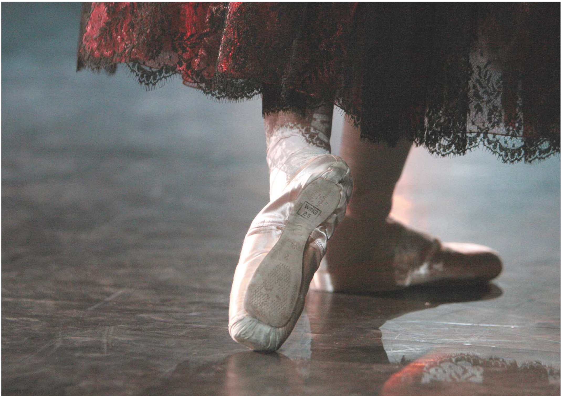
პარიზის "ოპერა გარნიეში" პარიზის საბალეტო აკადემიის აღსაზრდელებმა წარმოდგენა გამართეს. აკადემია ლუი XIV მიერ არის დაარსებული და მას შემდეგ მუშაობა ერთი დღითაც კი არ შეუწყვეტიათ. აკადემია პარიზშია და ის ერთ-ერთი ყველაზე ავტორიტეტული საბალეტო სასწავლებელია დასავლეთ კულტურულ სივრცეში. პატარა ბალეტის მსახიობების წარმოდგენა "გარნიეში" კლასიკურ რეპერტუარს წარმოადგენდა, თუმცა ტრადიციულ პროგრამასთან ერთად თანამედროვე ქორეოგრაფების ნამუშევრებსც შესრულდა. პარიზის საბალეტო სკოლის წარმოდგენა "ოპერა გარნიეში" ფრანგი ბალეტომანებისთვის წლის ერთ-ერთ საინტერესო საღამოს წარმოადგენს.