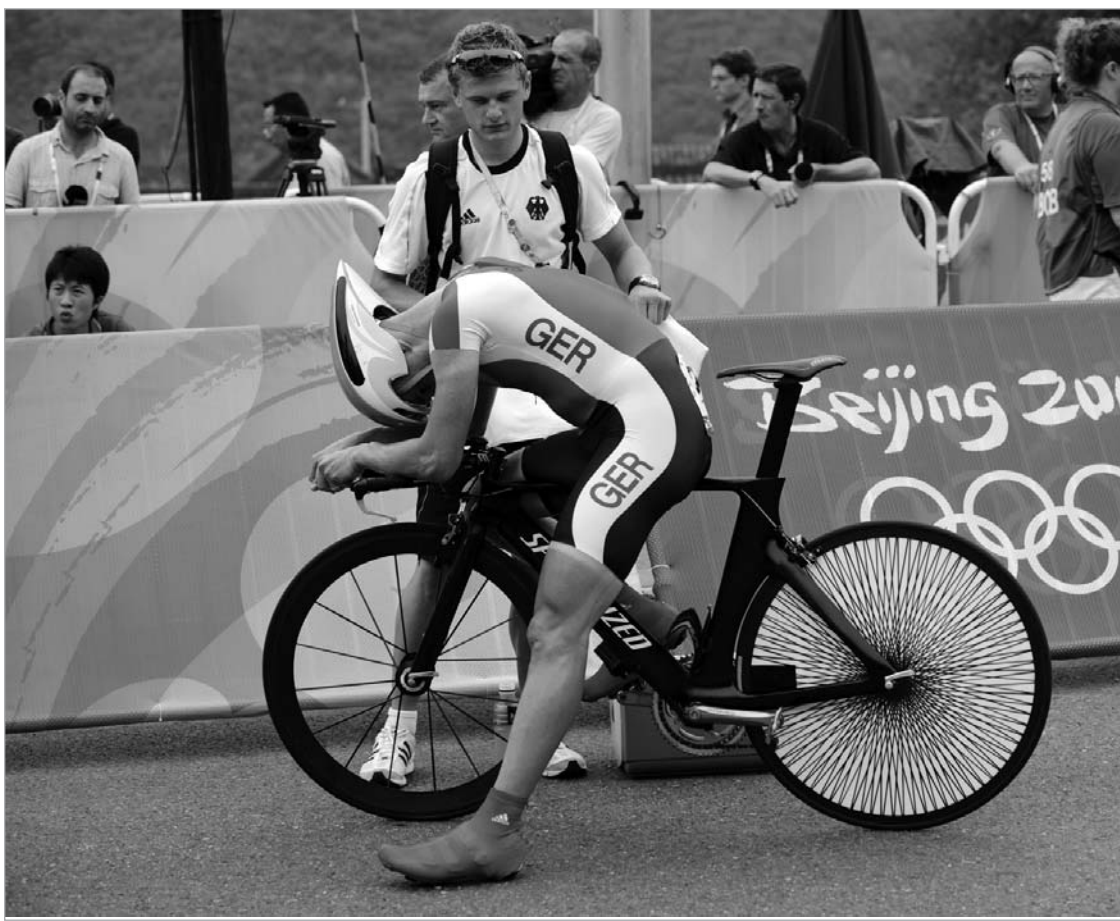
შტეფან შუმახერი ერთ-ერთი კანონდამრღვევია

გამულავნდა იმ სპორტსმენთა ვინაობა, რომლებსაც პეკინის ოლიმპიური თამაშებისთვის აკრძალული პრეპარატი მიუღიათ. ვარაუდი, რომ ექვსმა ათლეტმა დოპინგის დახმარებით მიაღწია წარმატებას, გამართლდა. ერთი სიტყვით, ბევრი რამ თავდაყირა დადგა. კერძოდ, დოპინგ სინჯი A-ს განმეორებითი შემოწმებისას აღმოაჩნდათ ახალი თაობის ერთიორთოეტივის - CERA-ს შემცველობა.