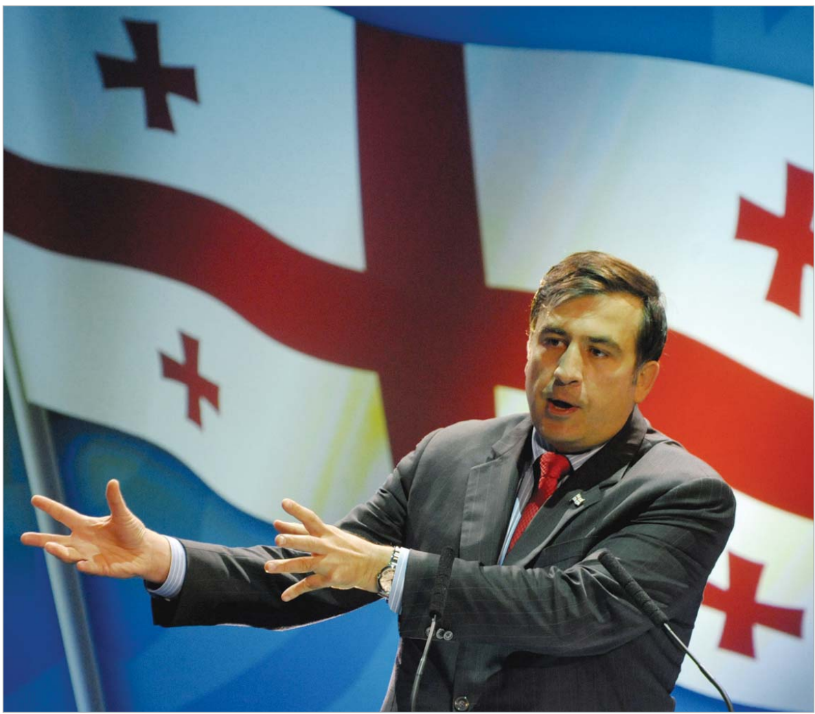
მიხეილ სააკაშვილი ვარშავის კონგრესზე