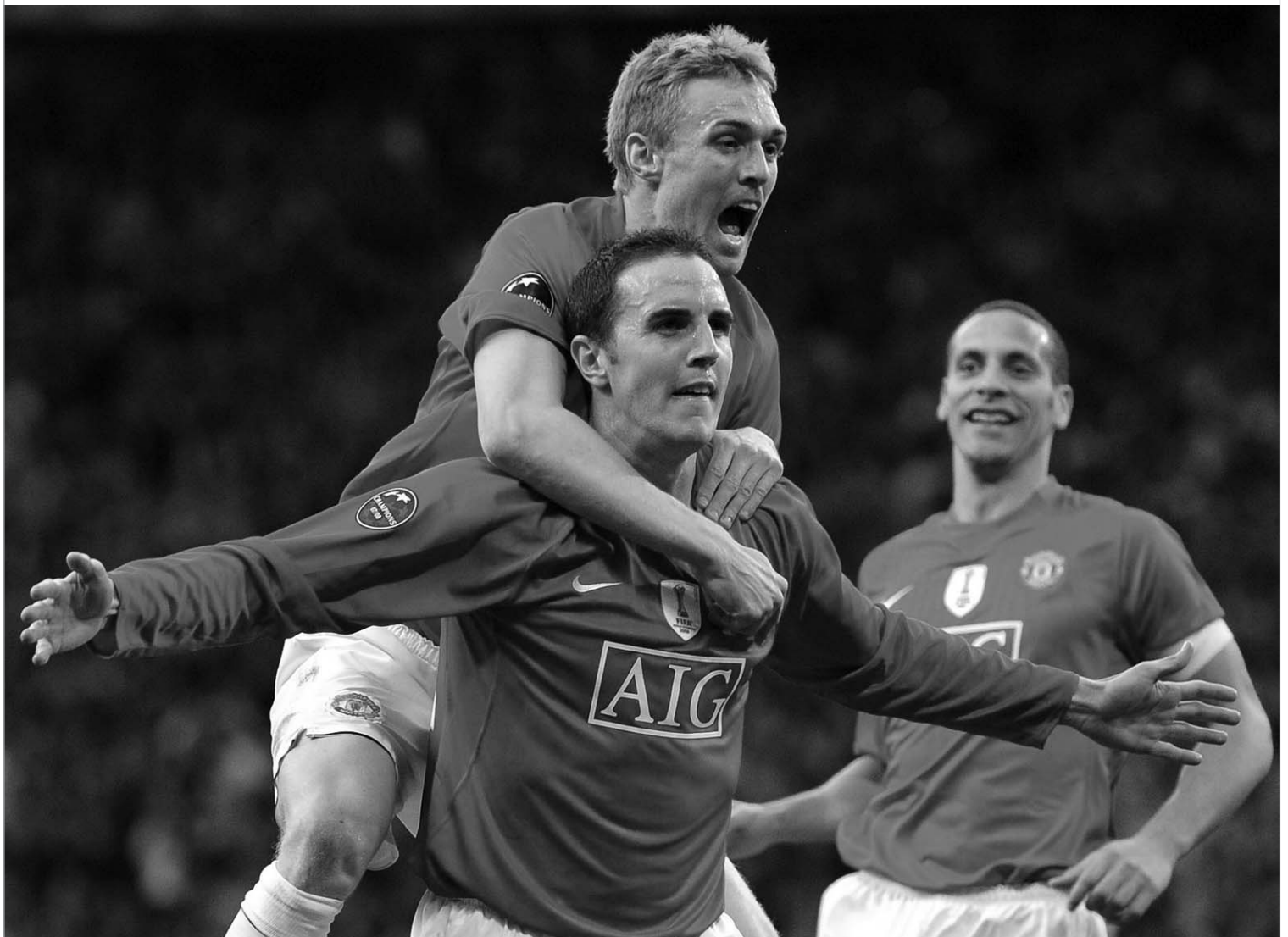
ოში თანაგუნდელებთან ერთად აღნიშნავს გატანილ გოლს

ოლდ ტრაფორდზე გამართულმა ჩემპიონთა ლიგის წმინდა ბრიტანულმა ნახევარფინალმა დაგვანახა, რომ არსენ ვენგერი არ ცდებოდა, როდესაც ამბობდა, ნახევარფინალში გასული ოთხი გუნდიდან ყველაზე სუსტი არსენალი იყო. მეთოფთა ეს სპანელი მეკარის მანუელ ალმუნის ბრწყინვალე თამაში რომ არა, მანჩესტერი ოთხშაბათსვე დაიბეჭებდა ფინალის საგზურს და ეს სრულიად დამსახურებული იქნებოდა.