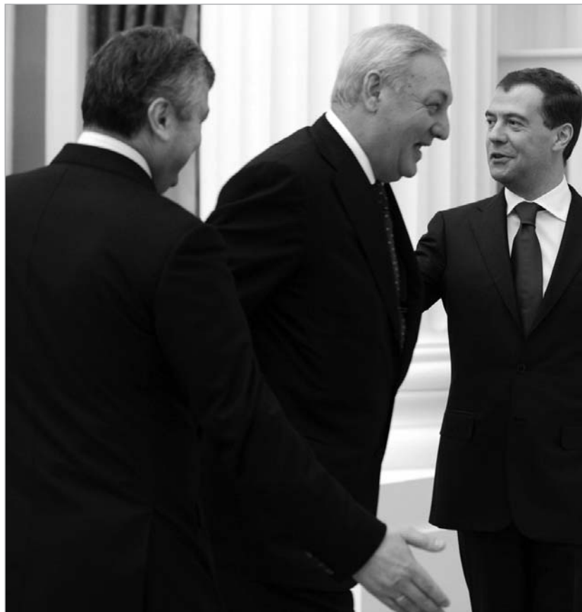
ნატოს წევრებს მედვედევი მარიონეტების სპექტაკლით პასუხობს

მისი თქმით, არ შეიძლება სწავლების ჩატარება იქ, სადაც ომი იყო". მედვედევმა ლა მუქარითაც გამოვიდა და განაცხადა, რომ შესაძლო ნეგატიურ შედეგებზე პასუხისმგებლობა გადაწყვეტილების მიმღებთ დაეკისრება. ნებისმიერი ქმედება, რომელიც შეიძლება თბილისში ქვეყნის რემილიტარიზაციისა და სამხედრო კომპონენტების უაზრო ზრდის კურსის მხარდაჭერად მიიღონ, ჩვენ მიერ შეფასდება, როგორც ზომები, რომლებიც გასული წლის აგვისტოში შეთანხმებულ ექსპუნიქტიან გეგმას ეწინააღმდეგება , - ეს განაცხადა მედვედევმა, აფხაზეთისა და სამხრეთ ოსეთის მარიონეტული რეჟიმების ლიდერებთან სერგეი ბაგაფთან და ელუარდ კოკოითთან ერთად, საზღვრების ერთობლივი დაცვის შესახებ შეთანხმების ხელმოწერის საზეიმო ცერემონიაზე გააკეთა. საქართველოს ოკუპირებულ ტერიტორიაზე საკუთარი მესაზღვრეების ჩაყენების გაფორმებისას რუსეთმა სამშვიდობო შეთანხმების დარღვევაში საქართველო აქეთ დაადანაშაულა. კოკოითთან და ბაგაფთან რუსეთის მიერ შეთანხმების გაფორმებას მწვავე რეაქცია გუშინ სწორედ ნატო-ს მხრიდან მოჰყვა. ალიანსის ოფიციალურ წარმომადგენელ ჯეიმს აპატურაის განცხადებით, კოკოითთან და ბაგაფთან საზღვრის ერთობლივი დაცვის შესახებ დოკუმენტის გაფორმება 2008 წლის 12 აგვისტოსა და 8 სექტემბერს გაფორმებული სამშვიდობო შეთანხმებების დარღვევას წარმოადგენს. ალიანსის მიმართ მუქარით რუსეთის პრეზიდენტი მას შემდეგ გამოვიდა, რაც აგვისტოს ომის შემდეგ, ბრიუსელში, რუსეთი-ნატო-ს საბჭოს პირველი სხდომა გაიმართა. საბჭოს სხდომაზე ალიანსმა კიდევ ერთხელ უთხრა უარი რუსეთის საქართველოში დაგეგმილი ნვრთნების გადაღებაზე. როგორც სხდომის შემდეგ ნატო-ს ოფიციალურმა წარმომადგენელმა ჯეიმს აპატურაიმ