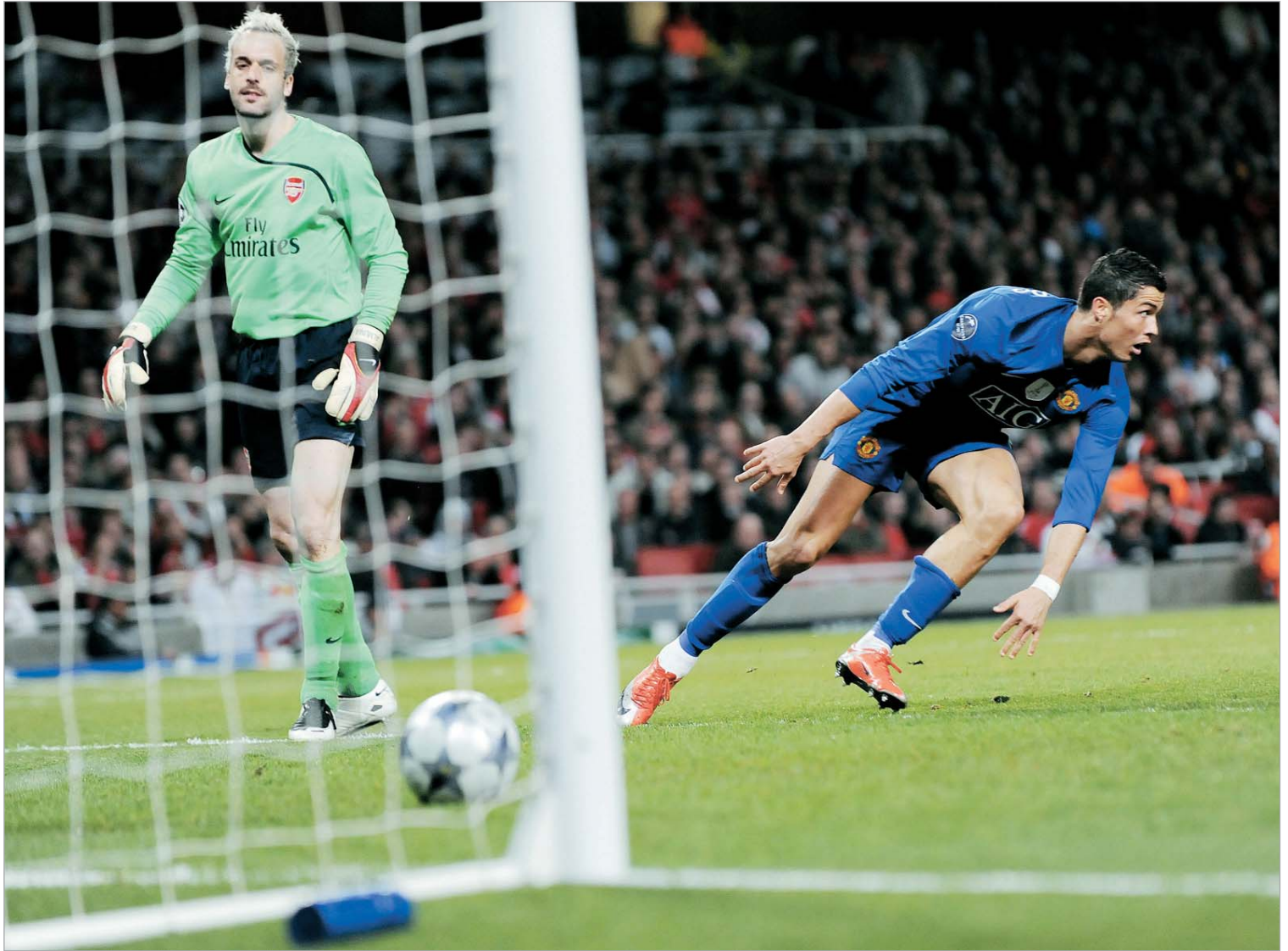
კრიშტიანუ რონალდუ “არსენალის” კარი ორჯერ დალაშქრა

“სამის მის მომავალზე ვესაუბრეთ. მასთან კონტრაქტის გაფორმება მიწოდდა, მერე კი კლუბში მწვრთნელის პოსტს შევთავაზებდი. მან ამჯობინა “ბაიერში” გააგრძელოს კარიერა. ყოველ შემთხვევაში, ეს ადამიანი მეტს იმსახურებს და მისთვის ყოველთვის ღია იქნება კლუბის კარი”, - თქვა ბენიტესმა, რომლის კომენტარი Daily Telegraph-მა გაავრცელა.