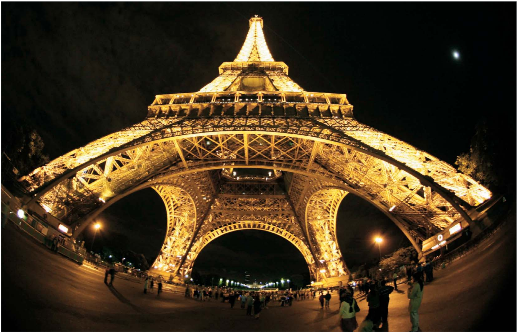
გუსტავ ეიფელის ქმნილებას, რომელიც მსოფლიოში ყველაზე ცნობილი ლითონის კონსტრუქციაა, წელს 120 წელი შეუსრულდა. მისი სიბერე ერთხანს, 2008 წელს, ლურჯმა განათებამ შენიღბა. ყოველ შემთხვევაში, ღამით ის ბრწყინავდა და თუ მის სანახავად დღის შუაზე არ გაიქცეოდით, მის არც თუ სიმპატიურ გამომეტყველებას ვერ შენიშნავდით. მაგრამ 2008 წლიდან საფრანგეთი ევროპარლამენტის თავმჯდომარე ქვეყანა აღარაა და შესაბამისად საოცრად ეფექტური განათება ძველმა, ყვითელმა შეცვალა. ამ და სხვა მიზეზებმა ქალაქის ხელმძღვანელობას საბოლოოდ გადაწყვეტინა, რომ ეიფელის კოშკის გადაღების დრო დადგა. გადაღების და იქნებ მოხატვისაც კი. ის, თუ რა შედეგს გამოიღებს მხატვართა ჯგუფის მუშაობა მოგვიანებით გახდება ცნობილი.