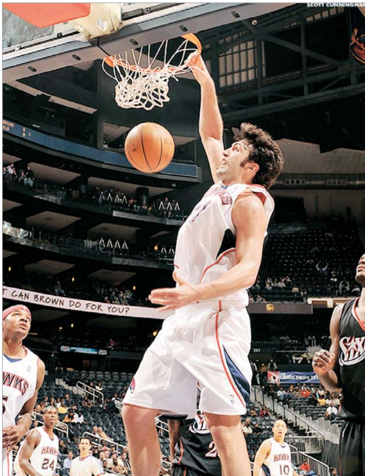
ზაზა ფაჩულია "ატლანტა ჰოქსის" აპრილის საუკეთესო მოთამაშედ დაასახელეს

ამერიკელებმა "ქორების" ქართველი ლეგიონერი აპრი-