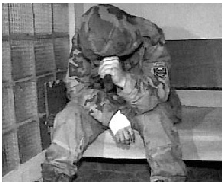
ერთ-ერთი გადაცემული ჩრეხი სტავროპოლის იზოლატორში