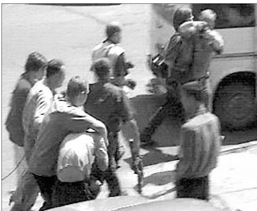
ექსტრადირებული ჩრეხი მინერალური წყლების აეროპორტში