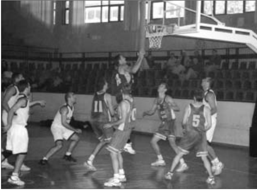
მაკაბი-აზოტის თამაშის ფრაგმენტი

“დინამოს” ამბიციები ჯერ კიდევ ჩემპიონატის დაწყებამდე, დღეუ და- დინამოს სახელობის ტურნირზე, გამოჩინდა. თბილისელებმა ყველა თამაში იოლად მოიგეს და ბუნებრივად, ჩემპიონატის პირველ ტურში საკალატბურ-