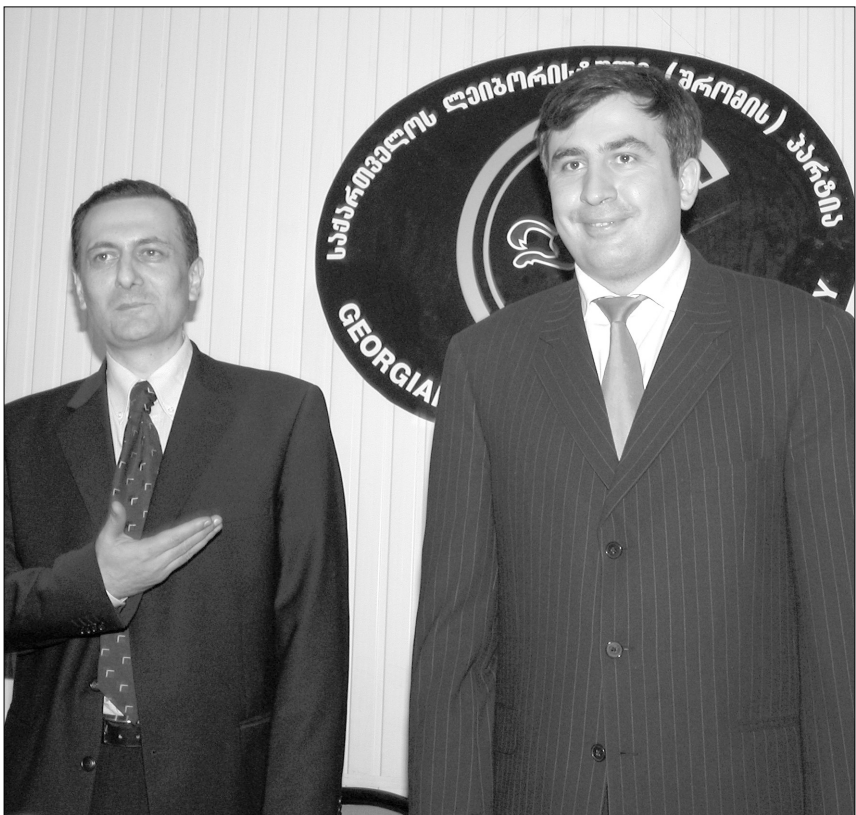
არჩევნებში გამარჯვების შემდეგ, სააკაშვილს საკრებულოს თავმჯდომარეობა პირველმა ნათელაშვილმა შესთავაზა.

“ახალი მემარჯვენეები” თბილისის საკრებულოს თავმჯდომარის პოსტზე საკრებულო კანდიდატურის გასაცხადებლად აღარ იბრძოდნენ, რადგან მიაჩნიათ, რომ “ლეიბორისტებსა” და “ნაციონალურებს” შეთანხმება მიხილს სააკაშვილის “პირველკაცობას” თაობაზე ახალი შიგთავლება, ყოველ შემთხვევაში, ახალი მემარჯვენის საკრებულოს პირველ სხდომამდე, რომელზეც მისი ხელმძღვანელები უნდა აირჩეს.