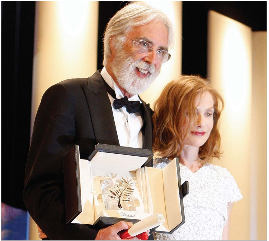
ოქროს პალმის რტოს მფლობელი, რეჟისორი მიხელოვან ჰანეკე იზაბელ იუპერი