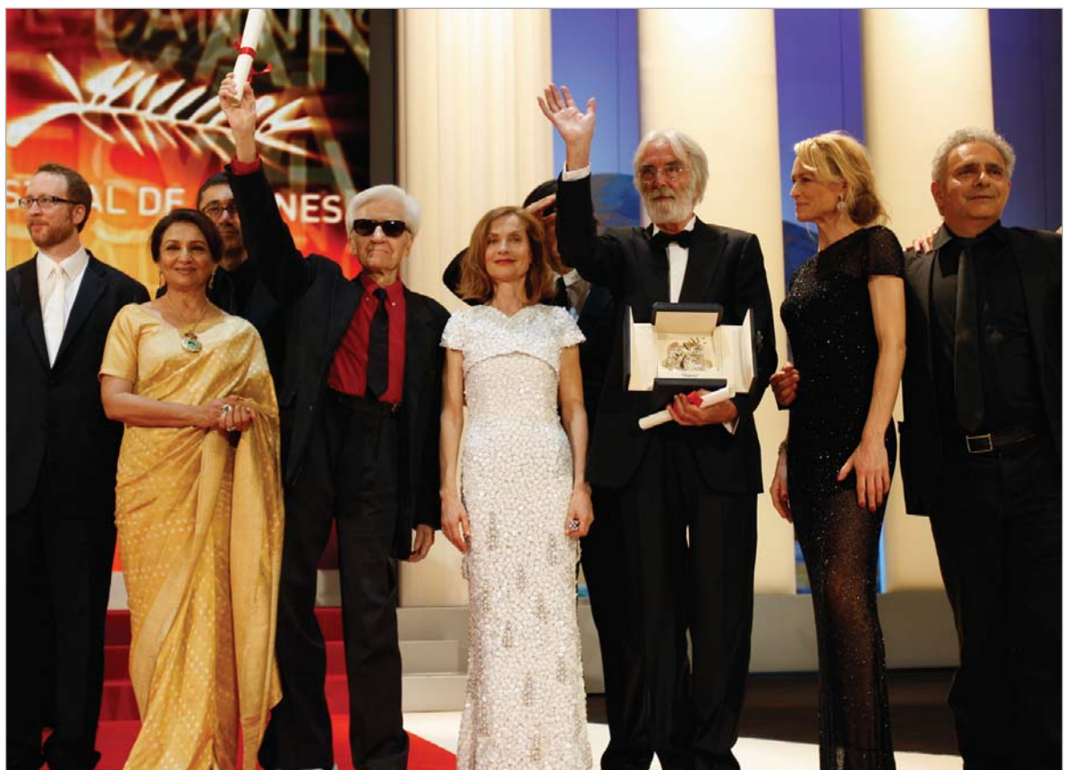
კანის ყიური და ოქროს პალმის რტოს მფლობელი, რეჟისორი მიხაელ ჰანეკე