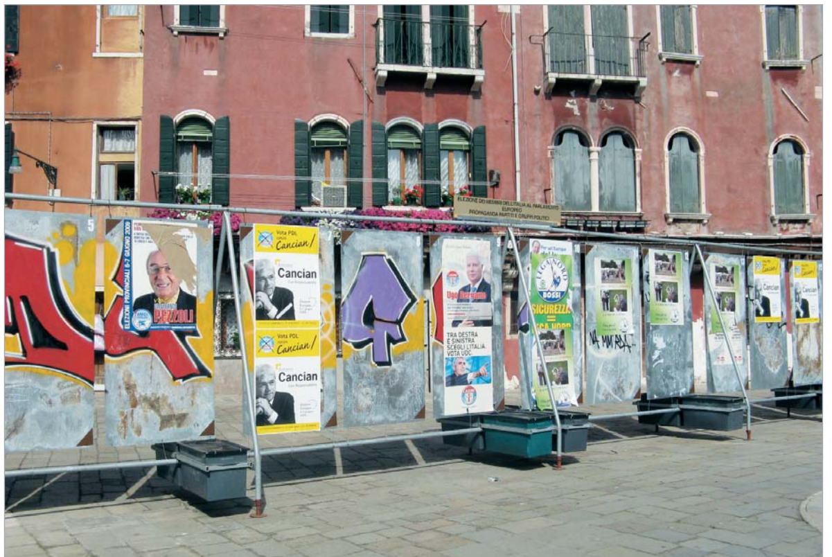
საარჩევნო მარათონის პლაკატების ვენეციური გამოფენა.