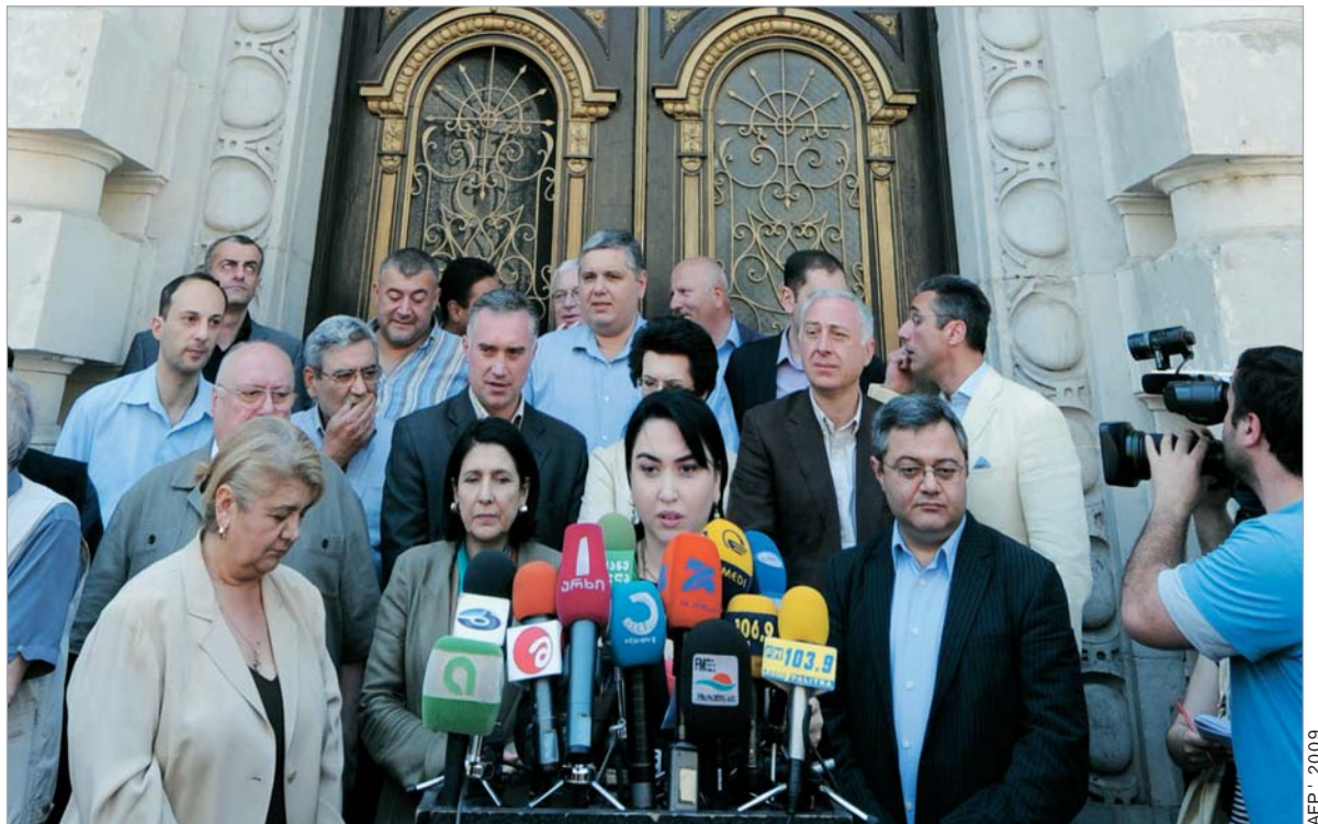
AFP - 2009