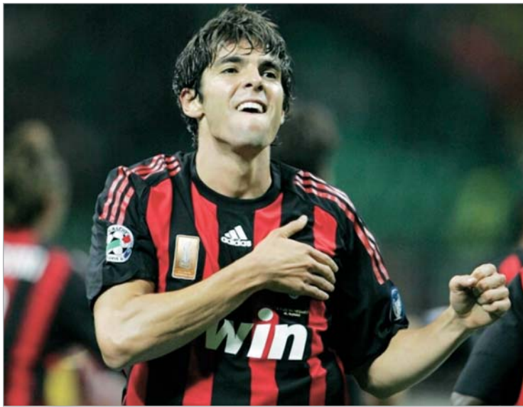
კაკა ისევ ყურადღების ცენტრშია

მაცია გავრცელდა, ამჯერად უკვე იტალიური მედიის მიერ. ეს ინფორმაცია შესაძლოა სანდოც იყოს. საქმე ის არის, რომ როდესაც საუბარია კაკას ტრანსფერზე, ესპანურ და იტალიურ მედიას შორის რადიკალური განსხვავებაა. ესპანელი ჟურნალისტები ირწმუნებიან,