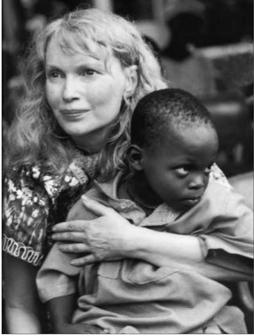
მია ფეროუ ნიგერიაში

მანამდე ბევრელი ჰილსში გატარებული ბავშვობა "ზღაპრული" იყო. ის პოლიომელოზის სამეფო ოჯახში დაიბადა: დედამისი პოინერი კინოსახიობი იყო (მან შეასრულა ჯეინის როლი 30-ანი წლების "ტარზანში"), ხოლო მამა, კარგად ცნობილი მწერალი და რეჟისორი ჯონ ფეროუ, ჯონ ვეინთან მუშაობდა მის სახელგანთქმულ ვესთერნებზე. მია ბედნიერი ოჯახის შვილიადა მესამე შვილი იყო. მისი მეცხერი დაბადების დღე უზრუნველყო ბავშვობის დასრულების მაკულტურული გამოდგა. როცა თამამის დროს ამხანაგმა ბურთი ფეხბურთში მოარტყა, მია მოცულობით დაეცა. დამფრთხალმა მშობლებმა ბავშვი ლოგინში ჩაანვიწყეს, მაგრამ მეორე დღეს, მისივე სიტყვებით: "მე არ შემეძლო ფეხზე დგომა. მთელი ოჯახი ლოცულობდა, რომ არ მოეკვდარიყავი. მოგვიანებით საავადმყოფოში გადამიყვანეს. აღარ მეგონა, რომ დღემდე სახლში დავბრუნდებოდი". მის პოლიომელოზი აღმოაჩნდა. კოლაფსიდან რამდენიმე კვირის