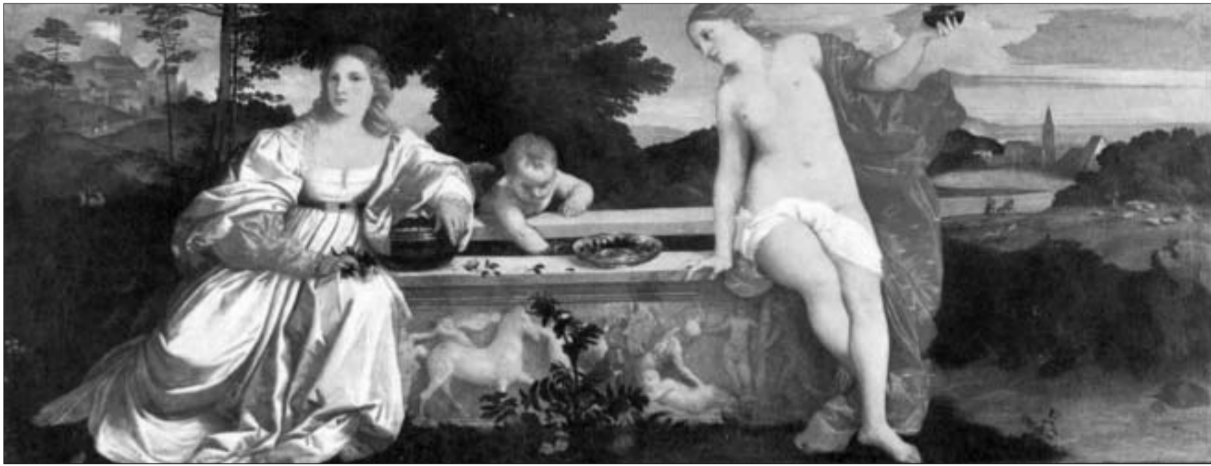
ლუკრაციას პორტრეტი არაერთ მხატვარს აქვს შექმნილი, თუმცა ტიციანის "მინიერი და ზეციერი სიყვარული" სიორჯუეს გალერეაზე ყველაზე უფრო გამოხატავს მის წინააღმდეგობრივ ბუნებას