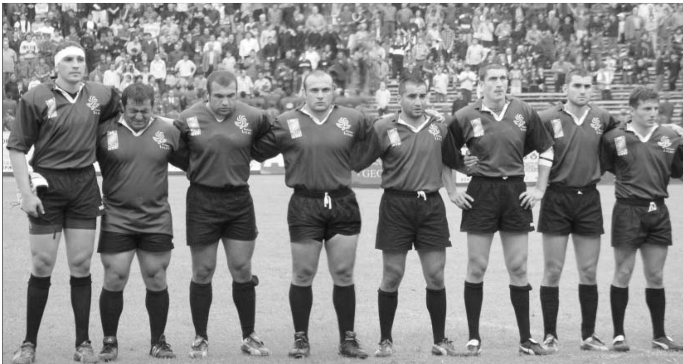
შეხვედრის დანების წინ, საქართველოს ჰიმნის შესრულებისას.