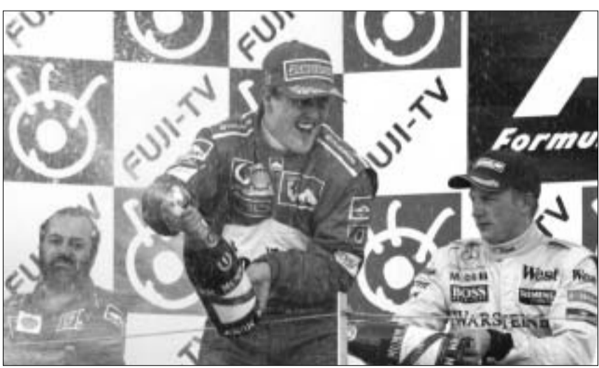
მიხაელ შუმხაერი მსოფლიოს ხუთეზის ჩემპიონია

რამდენიმე წრის შემდეგ ტრასი-დან გადავარდა "მინარდის" პილოტი ალექს იონვი. "რენოს" იტალიელმა პილოტმა იარნო ტრულომ კი პიტს-ტოპებს დაულო სათავე. 21-ე წრეზე ბოქსში რბოლის ლიდერმა, მიხაელ შუმხაერმაც შეიარა. ერთი წრის შემ-დეგ მას თანაგუნდელიც მიჰყვა. "მაკ-ლარენისა" და "უილიამსის" მექანი-კოსებს ბოქსებში საკმაო გარჯა მოუ-ხნიათ, ხოლო, "ჯორდანის" საჯინბომ ყველაფერი გააკეთა იმისათვის, რომ, რაც შეიძლება სწრაფად გაემართათ ადგილობრივთა კერპის, ტაკუმი სა-ტოს ბოლიდი. 28-ე წრეზე უნიშვნე-ლო შეცდომა დაუშვა ჯორდანისვე იტალიელმა მრბოელმა ჯანკარლო ფიზიკელამ, ხოლო მასთან მოაპერე-კანადელი ფაკვილენვი ("ბარი"- "პონ-და") იძულებული გახდა, ასპარეზობა შეეწყვიტა და ბოქსებში შესულიყო. ათი წრის შემდეგ ტრასიდან იტალი-