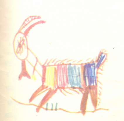
თხა" — ნახატი ნინო შუშანიასი. 4 წლის.