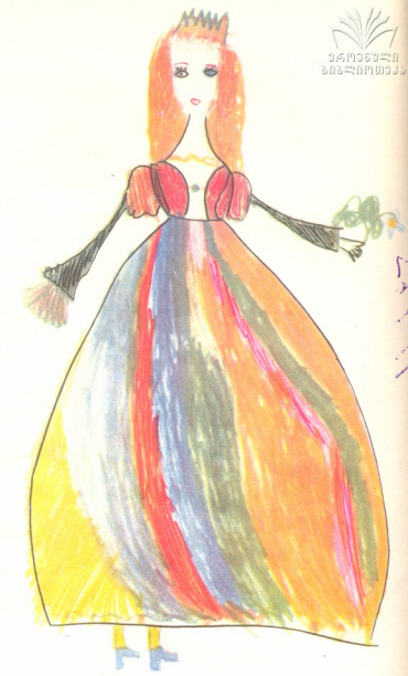
"გოგონა" — ნახატი ეგა ხომეროკისა.