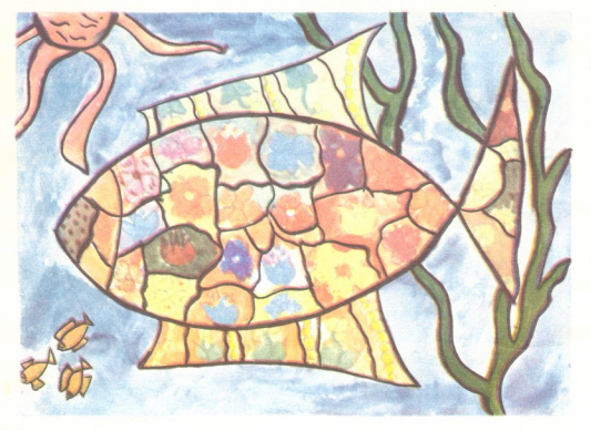
"თევზი" — ნახატი მარინა კალანდიასი.