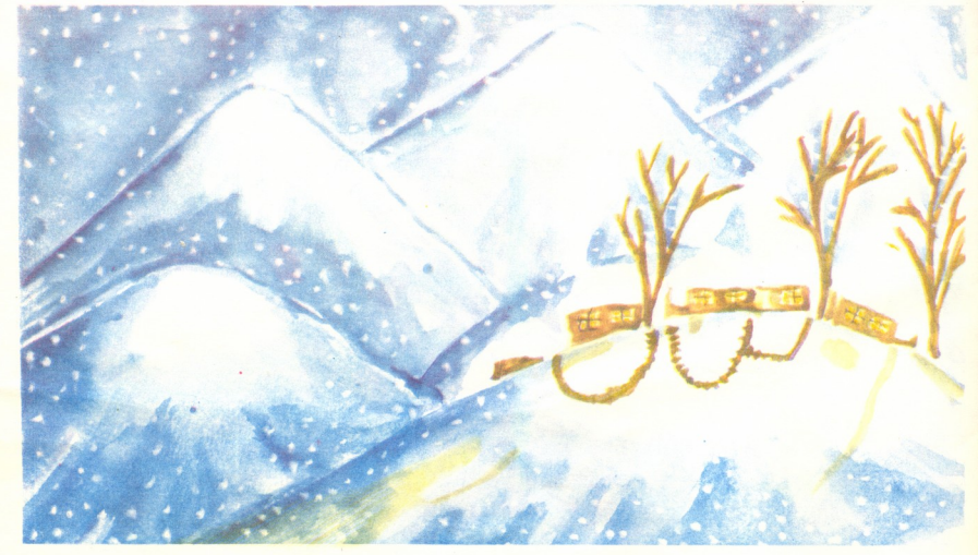
"ზამთრის სურათი" — ნახატი ლეილა კალატოზიშვილისა.