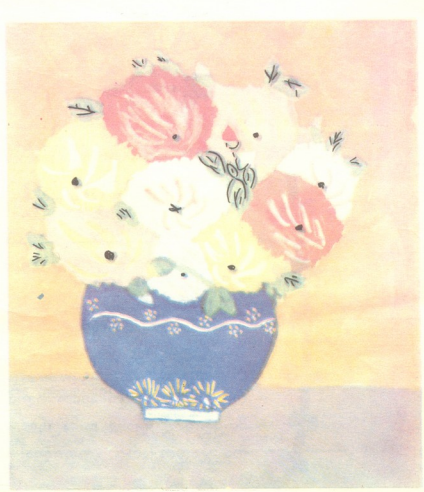
"ნატურმორტი"—ნახატი მარინე აფციაურისა.