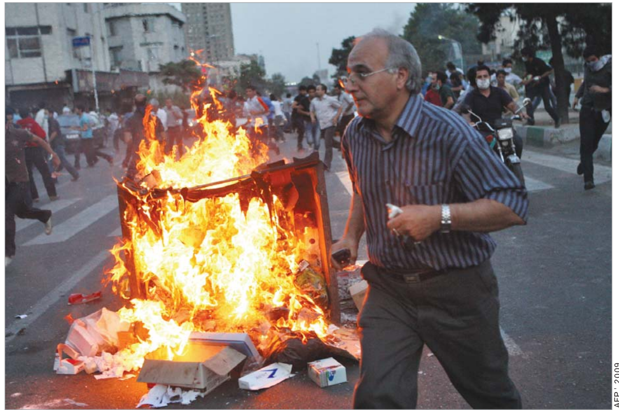
AFP - 2009