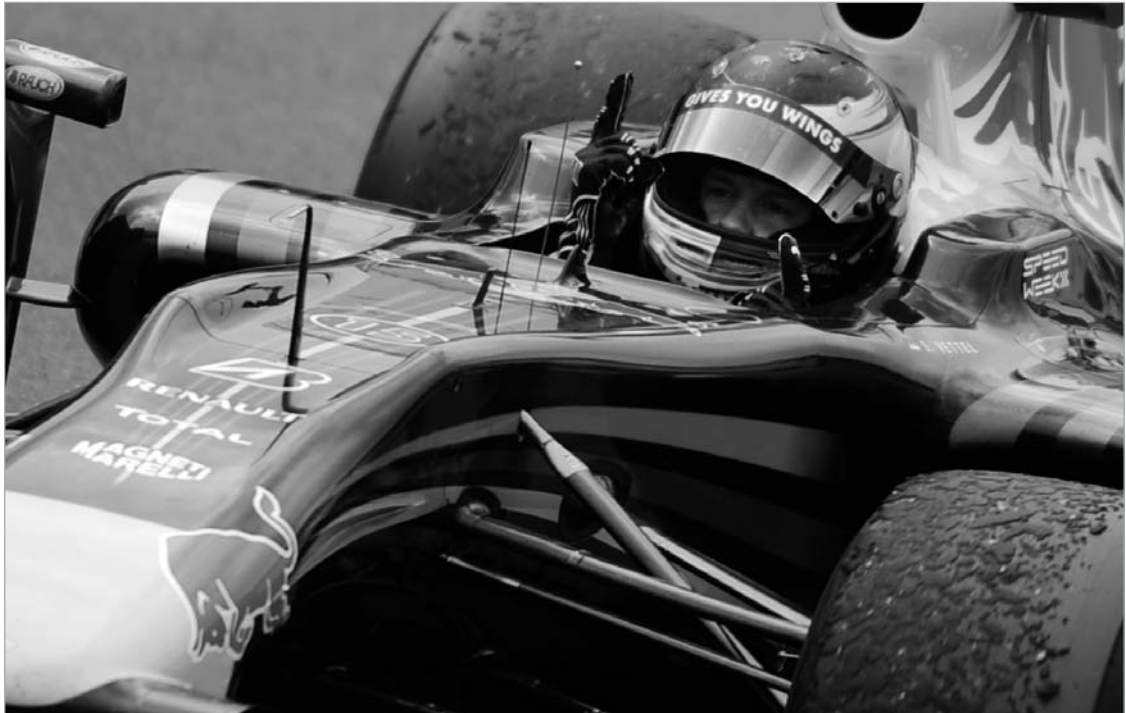
სეზონის ფეტელმა სეზონის მეორე გამარჯვება მოიპოვა

სეზონის ფეტელმა დიდი ბრიტანეთის დიდი პრიზი მოიგო, ხოლო მისმა თანაგუნდელმა მარკ უებერმა სილვერსტოუნზე მეორე შედეგი აჩვენა, რაც იმას ნიშნავს, რომ რედ ბულმა დუბლი შეასრულა. ბრაუნელმა რუბენს ბარიკლომ საკუთარ საჯინიბოს მესამე ადგილი მოუტანა, მისმა მეწყვილემ და ჩემპიონატის მოწინავე ჯენსონ ბატონმა კი შინაურ კედლებში მეექვსე საფეხურზე დაასრულა რბოლა. მსოფლიო ჩემპიონმა, მაკლარენელმა ლუის ჰამილტონმა კი მეთექვსმეტე გადაკვეთა ფინიშის ხაზი. კვირას სილვერსტონი დიდი ბრიტანეთის დიდ პრიზს მასპინძლობდა.