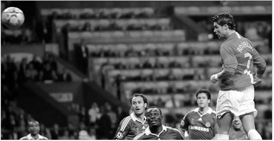
რონალდუმ მანჩესტერიდან ნასკელის მიზეზები დაასახელა

რონალდუს კი სულ სხვა მიზეზები ამოძრავებდა. როდესაც სამეფო კლუბის შეთავაზება მიიღო, პორტუგალიელი არ მალავდა თავის ამბიციებს. ეს არც ამჯერად გაუკეთებია. ბრიტანელ ჟურნალისტებთან