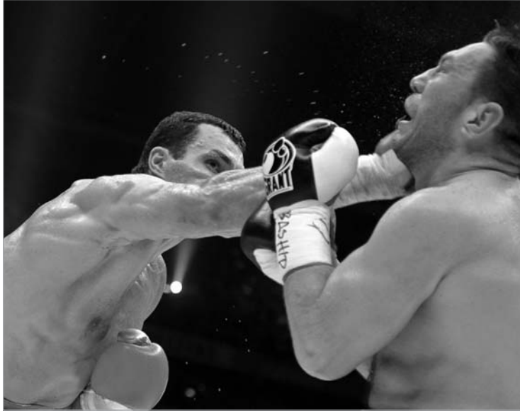
ვლადიმერ კლიჩკომ ჩაგაევს ბანაკს თეთრი პირსახოცი გადმოაფინა

ამერიკელებისთვის ძნელი შესაგუებელია ის, რომ მძიმე წონის ვერობლები, ამ შემთხვევაში უკრაინელი ძმები - კლიჩკოები განაგებენ. მართალია, დრო, როდესაც ამერიკელები მძიმე წონის ფავორიტები იყვნენ, გაცილებით შთამბეჭდავად გამოიყურებოდა, მაგრამ რეალობა ისიც, რომ სიმძიმის ცენტრმა ბებერ კონტინენტზე გადამოინაცვლა. ვეროპას კი ყოფილი საბჭოეთის ბანაკის მოჩხუბრები განაგებენ. ამერიკაში ვლადიმერ კლიჩკოს ტიტულები არ