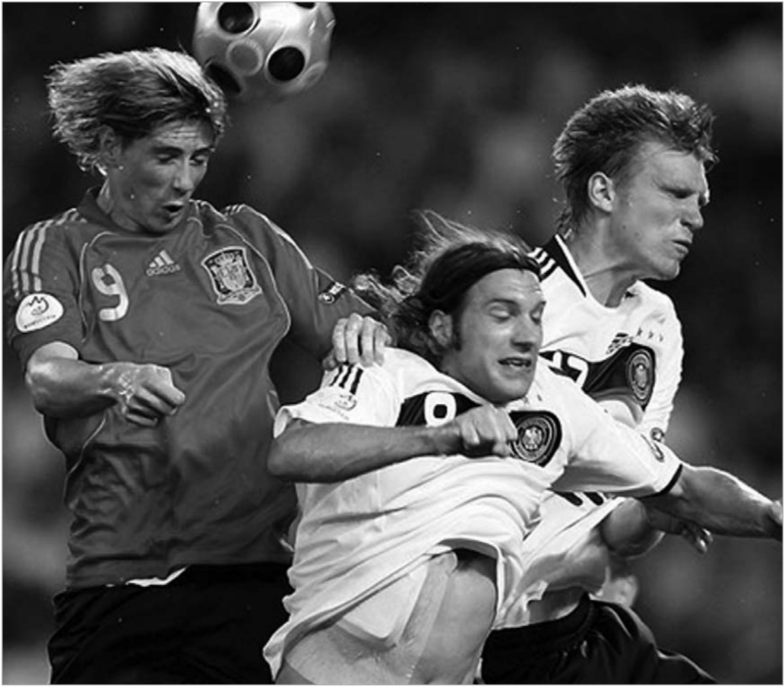
აბრამოვიჩი ტორესში 50 მილიონ გირვანქას იხდის

ცხადია, ასეთი ვითარება აბრამოვიჩისთვის დამამცირებელია - ბოლოს და ბოლოს, ტიტულებით თუ არა, სატრანსფერო ბაზარზე ფულის ხარჯვით მაინც ხომ უნდა დაგვამახსოვროს თავი. და აი, ხანგრძლივი დუმილის შემდეგ მისტერ აბრამოვიჩი საქმიანობას უბრუნდება - უახლოეს მომავალში ჩელსი სენსაციურ ტრანსფერს შემოგვთავაზებს.