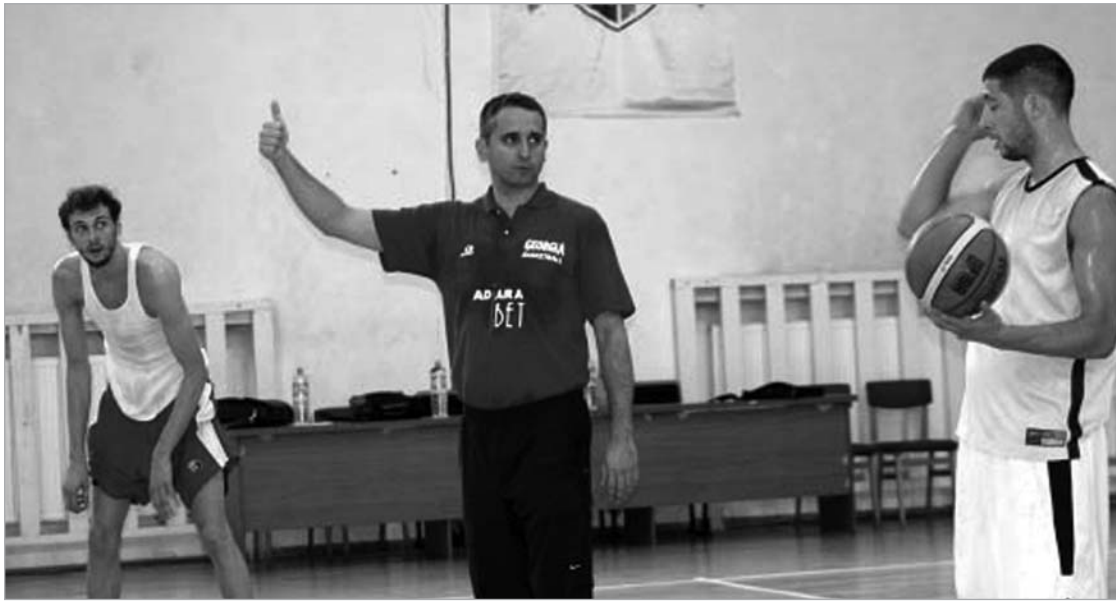
კოკოშკოვი გუნდს ელიტური დივიზიონისთვის ამზადებს

ცხადია, ამ მატჩებისთვის უკეთ მოსამზადებლად გუნდს შეკრება სჭირდება. საქართველოს კალატბურთის ფედერაცი-