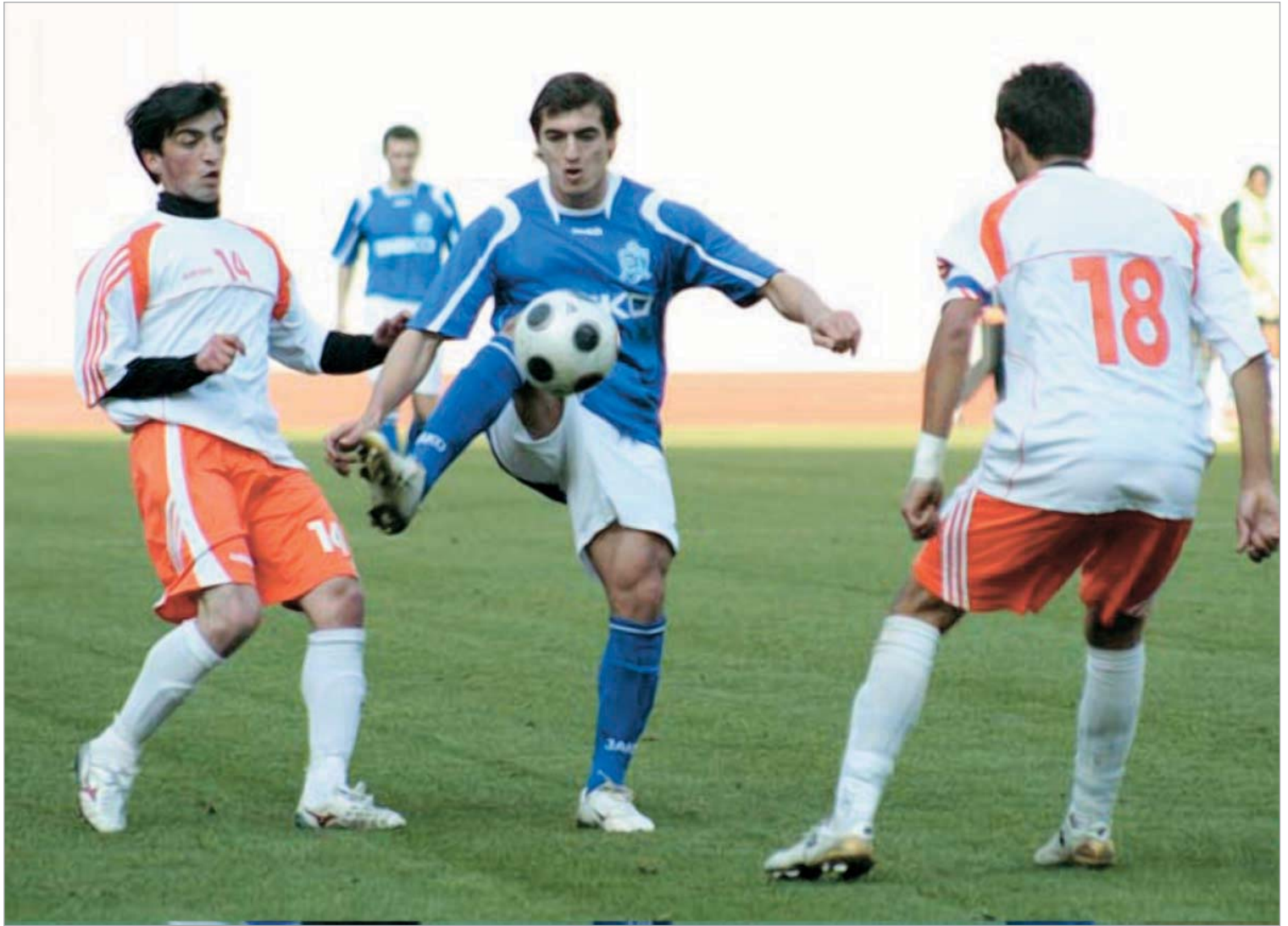
მერეპაშვილმა "ზელბის" გაუტანა