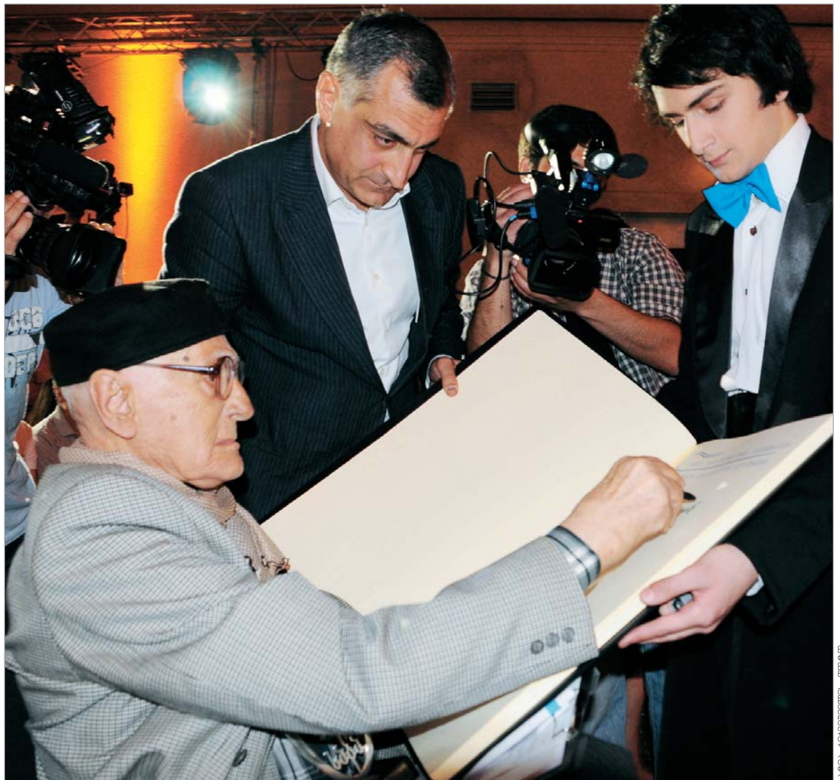
ბაზრძალაბა ავანიონილს ფორმ