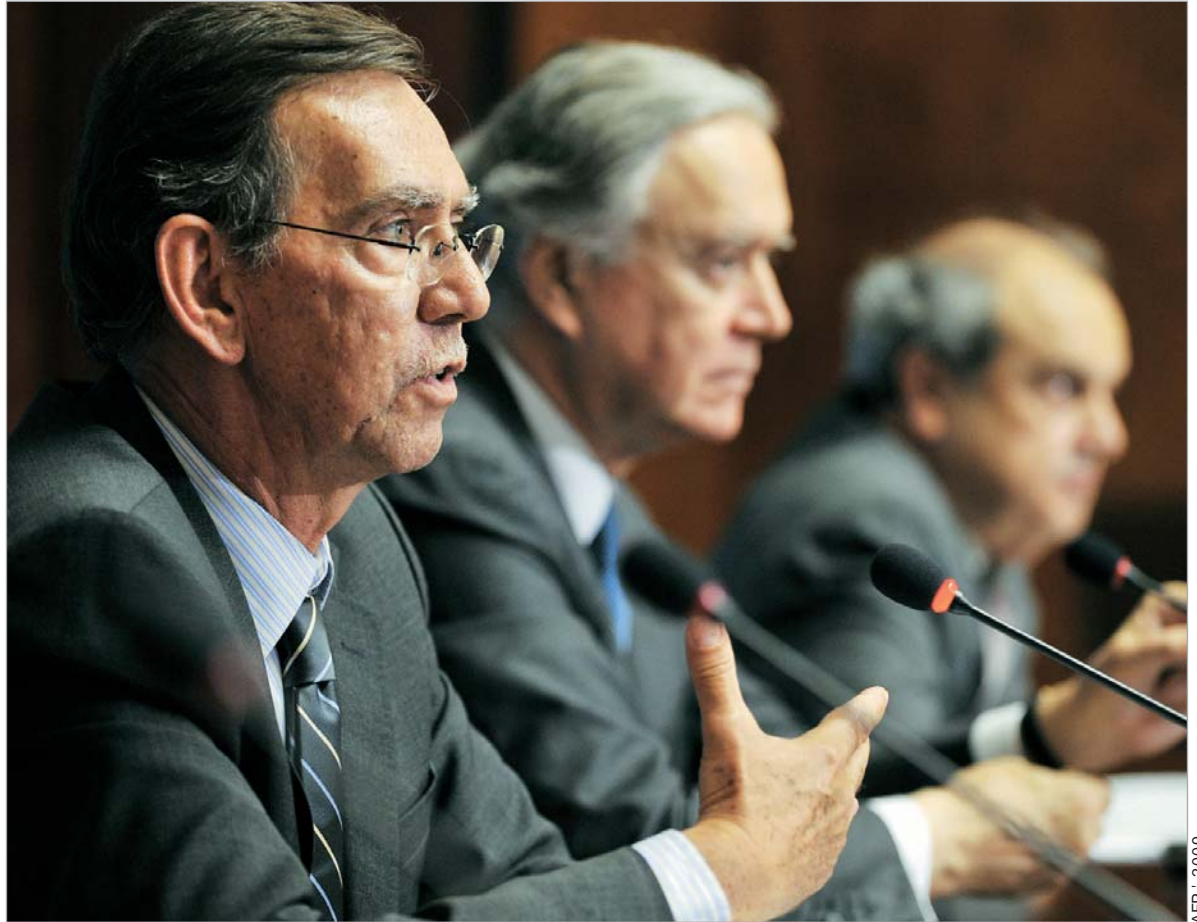
ყენევის მოლაპარაკებებზე პოზიტიური ძვრა შეინიშნება