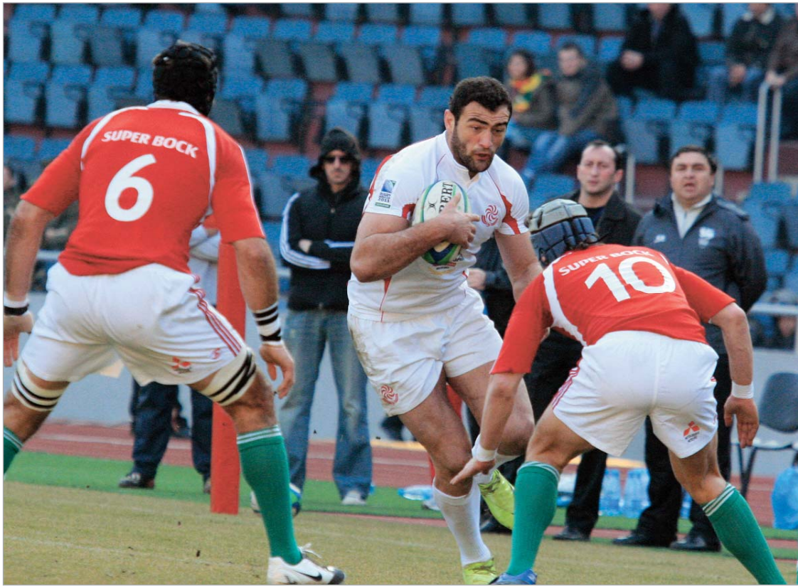
პორტუგალიაში თებერვალში ჩავდივართ

2010 წელი ქართველი მორაგბეებისთვის მნიშვნელოვანი იქნება. "ერთა თასის" მორიგ გათამაშებაში "ბორჯღალოსნები" ფავორიტებად ითვლებიან და ჩვენმა ბიჭებმა სპეციალისტთა პროგნოზი უნდა გაამართლონ. მომავალ ერთა თასის მნიშვნელობაც აქვს, რომ ამ თამაშების შემდეგ გაირკვევა იმ გუნდების ვინაობა, რომლებიც 2011 წელს რაგბის მსოფლიო თასზე ითამაშებენ. "ერთა თასის" მეორე წრის კალენდარი საბოლოო სახე მი-