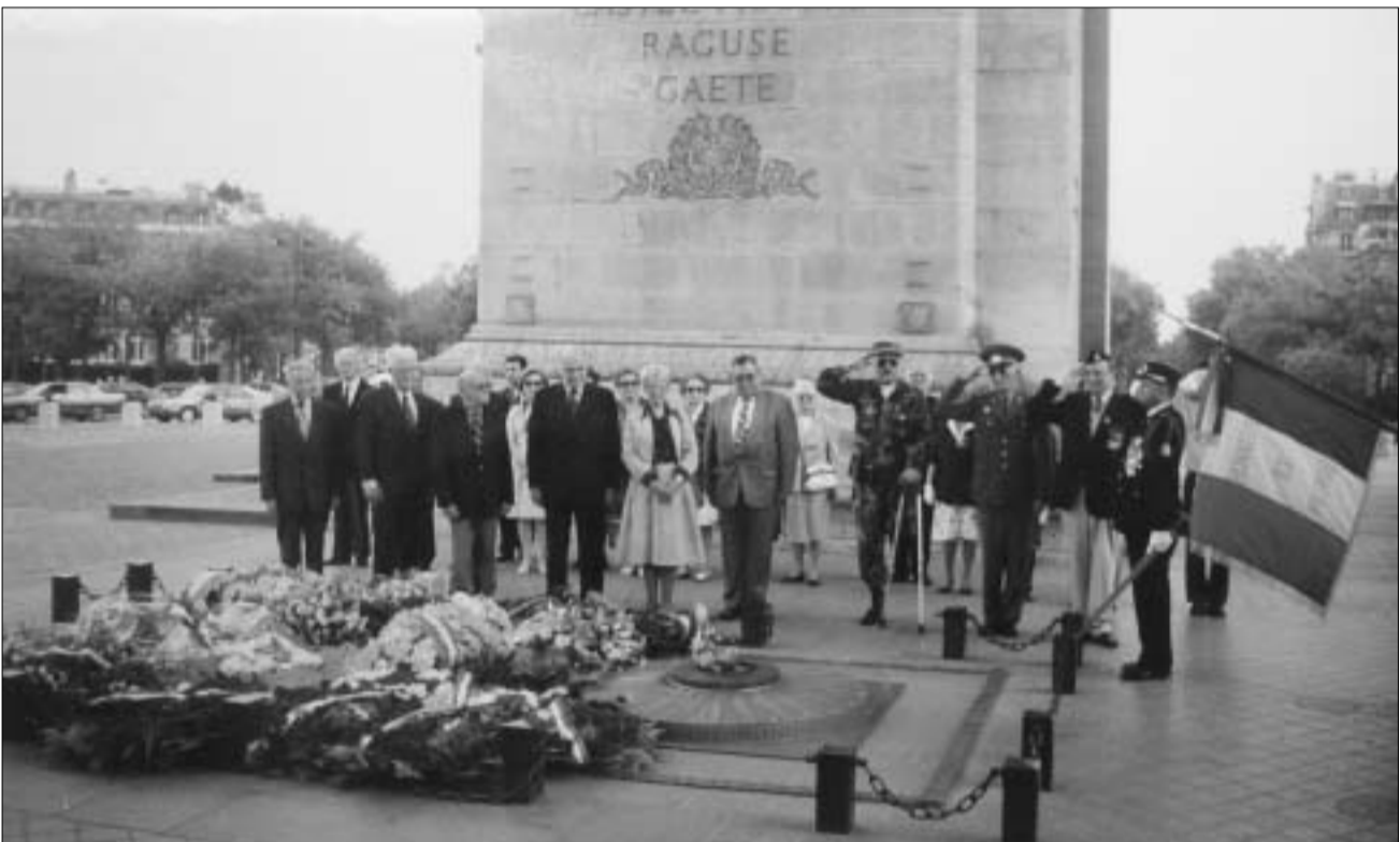
საზეიმო ცერემონიალი ტრიუმფალური თალის ქვეშ