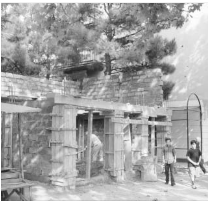
კანონი მშენებლობა ვაჭა-ფშაველას N69-ში.

ამყვამდე მშენებლობა შეერებულა. ხალხი გამოვიდა, "პრარაბასა" და ხელისუფლებს მუშაობა აუკრძალა და მან გაუშვა. დღეს ისინი მიხიელი სააკაშვილსაც ჩააყენებენ საქმის კურსში. შესაბამის ექსპერტებსაც