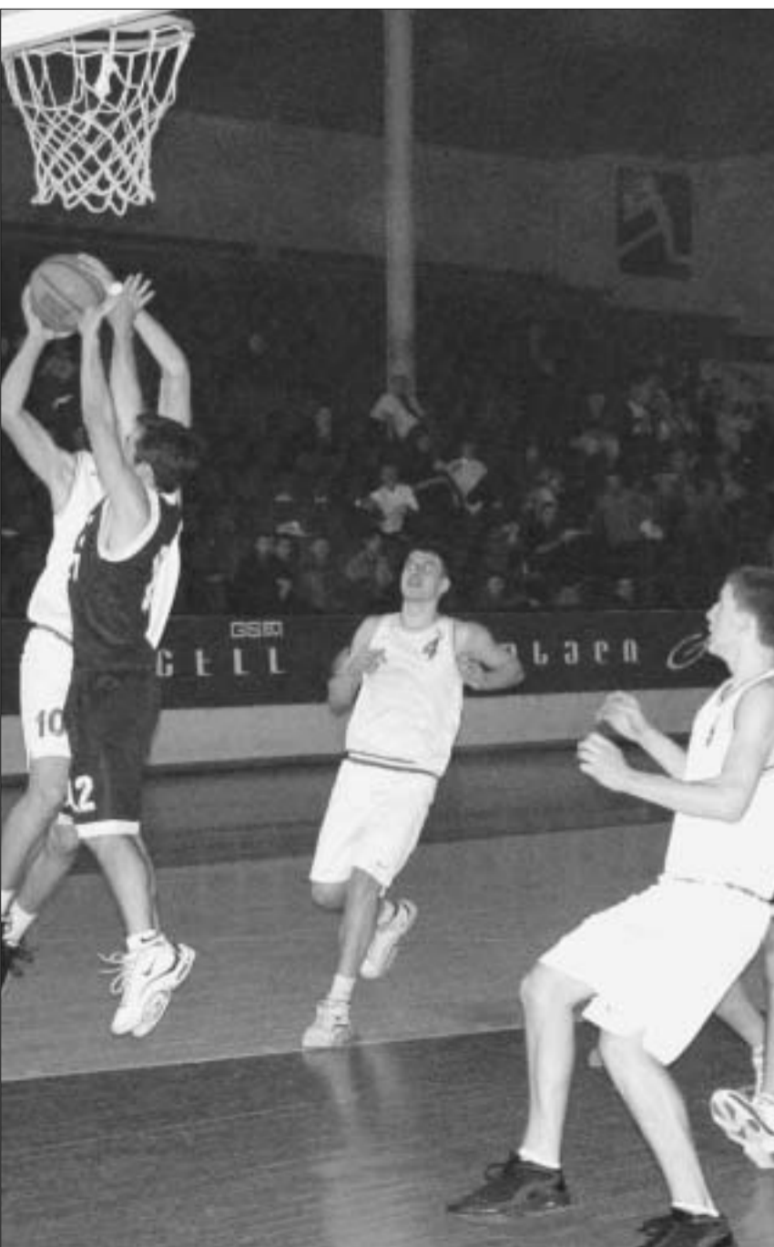
„ახოტი“ - „კადემია“. შეხვედრის მომენტი

საქართველოს ეროვნული ჩემპიონატი კალათბურთში თანდათან ძალას იკრებს. გუშინ მუხთეთ ტურის ბოლო შეხვედრები გაიმართა. ტურების დანომერა პირობით ხასიათს იძენს. იმის გამო, რომ ჩემპიონატში ცხრა გუნდი მონაწილეობს, ყოველ ტურში თითო გუნდი ისვენებს. ასე რომ, ხუთი ტურის შემდეგ ზოგს ხუთი, ზოგს ოთხი, ხოლო ზოგს სულაც სამი მატჩი აქვს ჩატარებული.