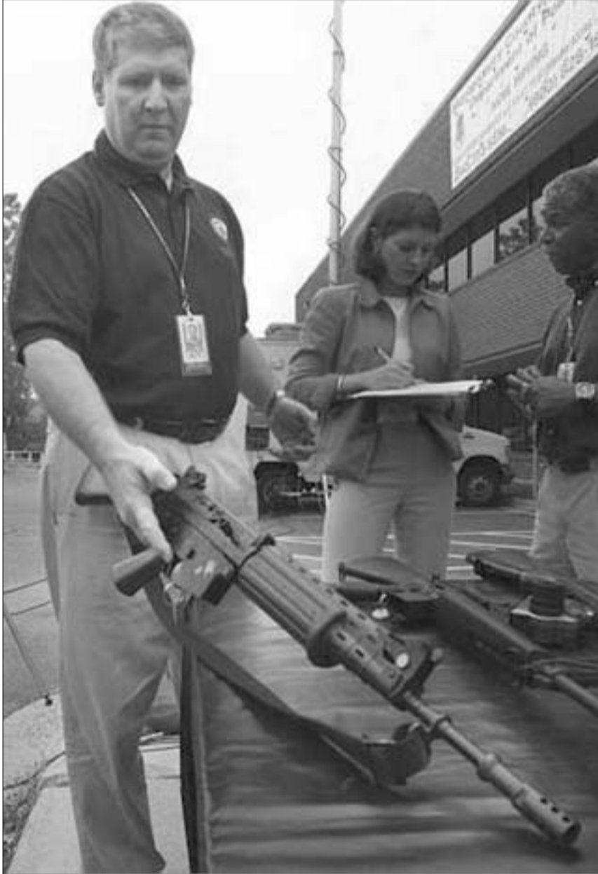
სნაიპერის სავარაუდო იარაღი.