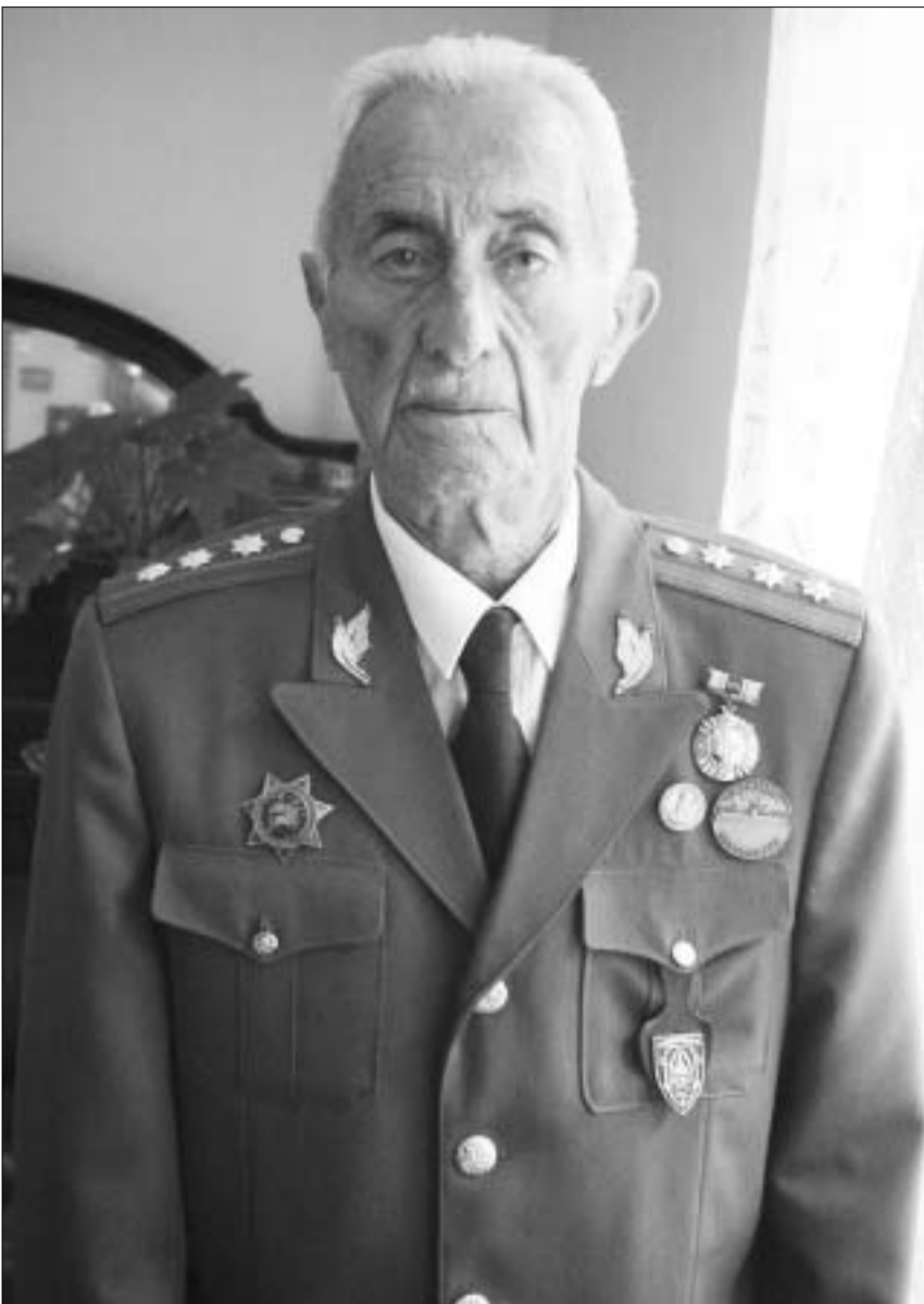
პოლკოვნიკი ჟორჟ ქაჯანია

პოლკოვნიკ გიორგი ქაჯაიას მიერ სიკვდილს გადაარჩენილი 31 ადამიანი კაბერძნულთა გაამგზავრეს, და მათი სხედი თითქოს დაიკარგა. ისინი მხოლოდ მაშინ გამოჩნდნენ, როცა ომის დამთავრების შემდეგ საფრანგეთთან ქართველები მოღვაწეობა მიერ მოტყუებით ჩამოყვანილ პოლკოვნიკ ქაჯაიას მიუყვანეს მუსლი 58-18. "სამშობლოს მივალაბუს" დახვრება