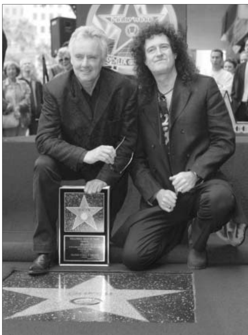
როკერ ელვორი და ბრიანი მეი "ქუინის" ვარსკვლავთან.

პარასკევს, ჰოლივუდის ყველაზე ცნობილ ქუჩაზე, ე.წ. "ვარსკვლავები ბულვარზე" როკ ჯგუფ "ქუინის" ვარსკვლავი ჩაიდგა. "ბითლზთან" ერთად, "ქუინი" ის იქვითი გამონაკლისი გახდა, რომელიც ამერიკელმა ჰოლივუდის ტროტუარში უკვდავყვეს. ლამის კლუბ "აივარის" წინ ვარსკვლავის გახსნას ჯგუფის წევრები ბრაიან მეი და როჯერ ტილორი დაესწრნენ. მალე ისინი, 1991 წელს დალუპული მერკურის გარეშე, ჯგუფის 30 წლის იუბილეს აღნიშნავენ.