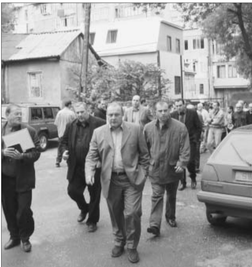
ქალაქის მერი ათვალიერებს დაზარალებულ ქუჩებს.

გარკვეა ისიც, რომ ძალში, მით უმეტეს, უპატრონო, ჩვენს მოსახლეობას მეგობრობას ვეღარ გაუწევს, რადგან ქვეყანაში ცოფის საწინააღმდეგო ვაქცინის მარაგი ამოიწურა. ამ ვაქცინას საქართველო რუ-