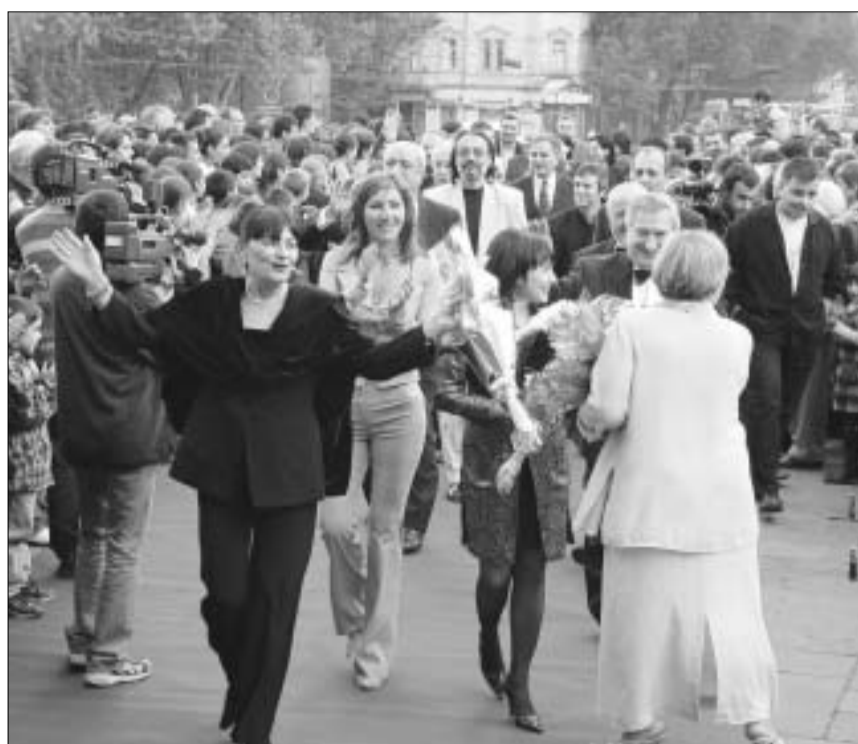
"ივერიელები" ვარსკვლავის გახსნას აღნიშნავენ.

ანსამბლი "ივერია" 35 წლის იუბილეს ზეიმობს