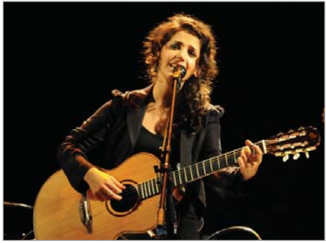
ფაქალიამ კონტრაქტი ოფიციალურად გააფორმა