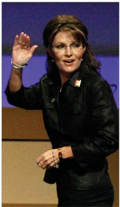
რესპუბლიკური პარტიის ვიცე-პრეზიდენტობის ყოფილი კანდიდატი სარა პეილინი.

პოლიტოლოგთა ნაწილი არ გამოიხატავდა, რომ პეილინი საერთოდ წავა პოლიტიკური არენიდან. როგორც ერთმა კომენტატორმა აღნიშნა, შეერთებულ შტატებში, დაახლოებით, 160 მილიონი ადამიანია, ვისი ასაკიც 36 წელზე მეტია ანუ აქვე უფლება, 2012 წელს არჩეულ იქნენ პრეზიდენტად, მაგრამ თამამად შეიძლება ითქვას, რომ მათი 99,999 პროცენტი ასეთს არაფერა გეგმავს. იქნებ პეილინიც მათ რიცხვშია? ამ კითხვაზე გარკვეული პასუხი ჯერჯერობით არავის აქვს, შეიძლება თვით სარა პეილინისაც კი, მაგრამ გასულ უიკენდზე მან ნათლად მიანიშნა, რომ დიდი პოლიტიკიდან წასვლას არ აპირებს. პეილინი გუბერნატორის პოსტს