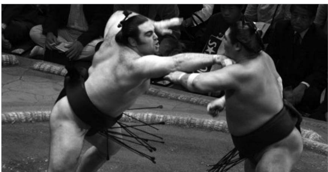
ქართველებმა ბაშოზე მეორედ გაიმარჯვეს ერთად

ასპარეზობის მესამე დღეს კოკაი დასაუღეთის მეცხრე მაიგაშირა ტოჩინონადას დაუპირისპირდა და მეტოქე უვატენაგეს ილეთით დასცა დოპოზე. გამოცდილ თანამემამულეს მხარი აუბა ტოჩინონაში - აღმოსავლეთის მეზიდე მაიგაშირა ტოჩინონა ასევე უვატენაგეს ილეთით დაამარცხა. მორიგი გამარჯვებები მითვალეს ჰაკუშომ და ასოშორიუმ. მათ სამ-სამი მოგება დაუფროვდათ.