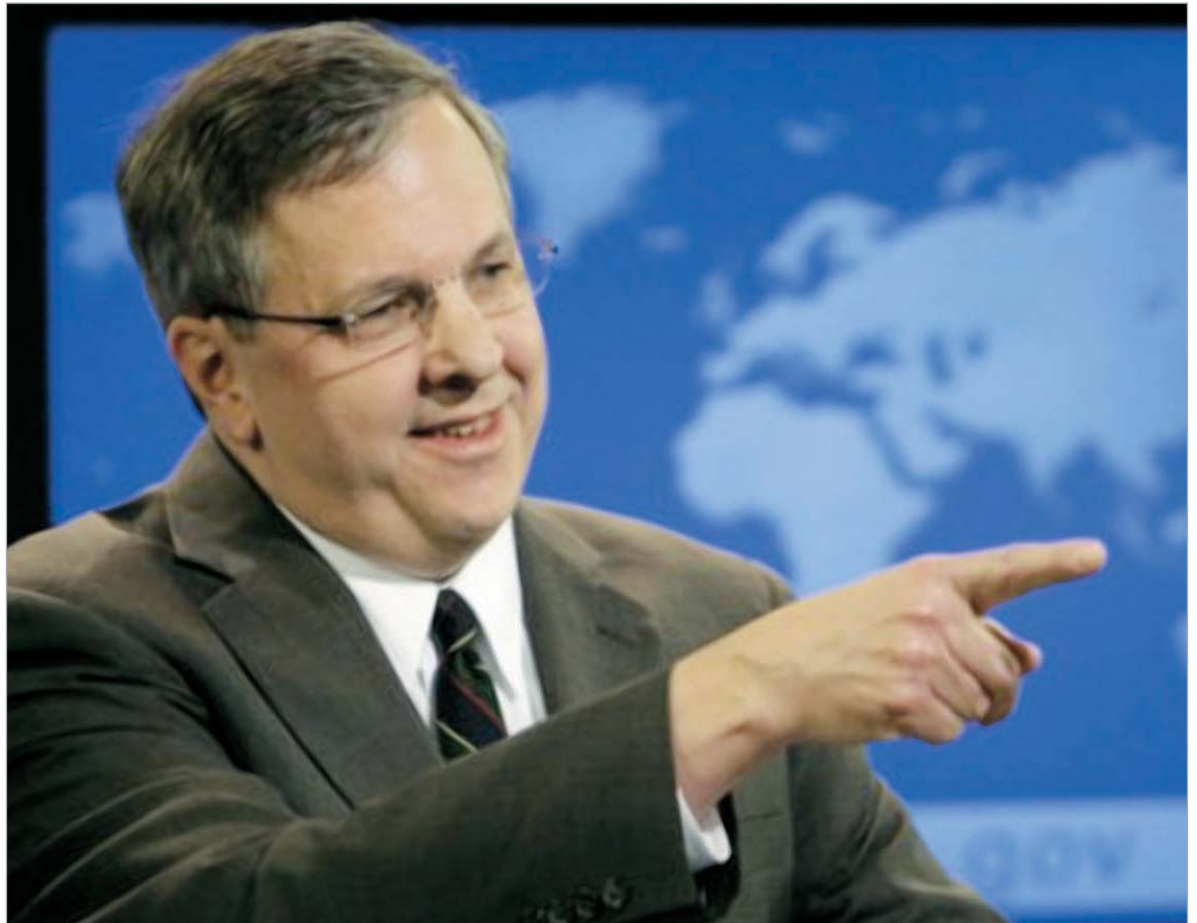
იან კელი: "დიდი შვიდეულის" ქვეყნები, ევროკავშირი და ნატო არ ცნობენ აფხაზეთისა და სამხრეთ ოსეთის დამოუკიდებლობას.