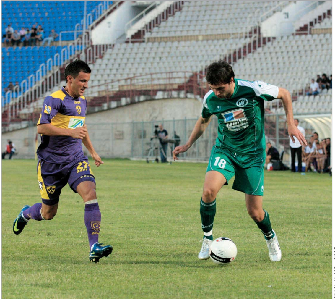
კვარაცხელიას აქტიურობამ შედეგი ვერ გამოიღო.