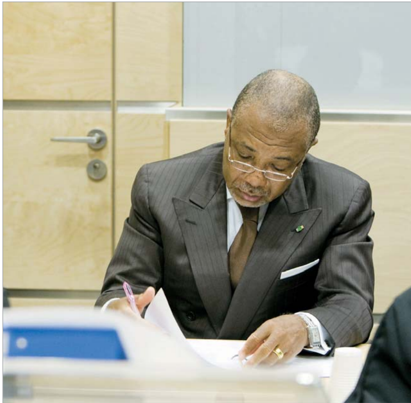
ლიბერიის ექს-პრეზიდენტი ჩარლზ ტეილორი ჰაბის სამხედრო სასამართლოს დარბაზში.

მაისში სასამართლომ არ დააკმაყოფილა ადვოკატების თხოვნა მტკიცებულებათა არარსებობს გამო ტეილორის გათავისუფლების