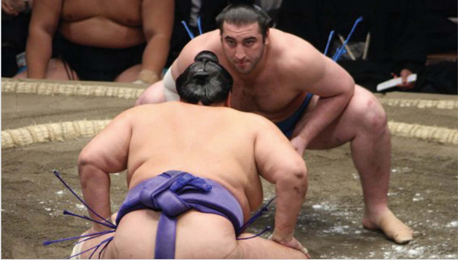
ტოჩინოშინმა მეშვიდე პაექრობა მოიგო