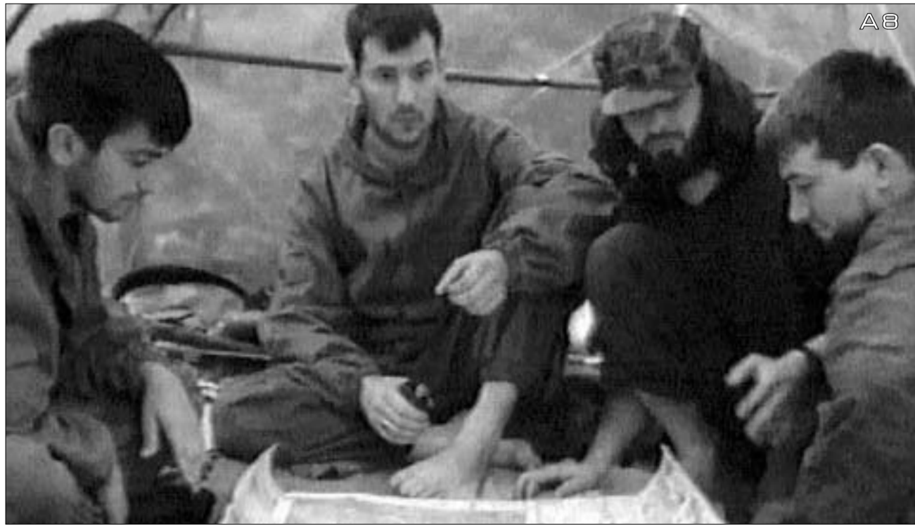
მოსკოვში მარავენი (მარცხნიდან მორე) თანამებრძოლებთან ერთად.

მოსკოვში მძევალთა აყვანამ ბევრი შეკითხვა უპასუხოდ დატოვა