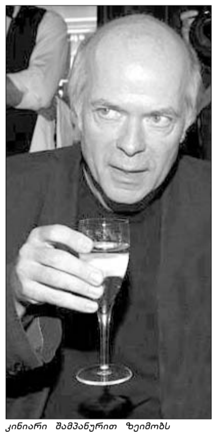
კინიარი შამპანურით ზეიმობს

რამდენიმე დღის წინ საფრანგეთის მთავარი ლიტერატურული ფილოსოფი, "გონკურის" მფლობელის ვინაობა გაირკვა. კრიტიკოსებმა გამარჯვებული ავტორის პასკალ კინიარის "მოხეტიალე ჩრდილები" მიაუთუნეს იმ ნაწარმოებთან რიგს, რომელიც აუცილებლად წასაკითხია.