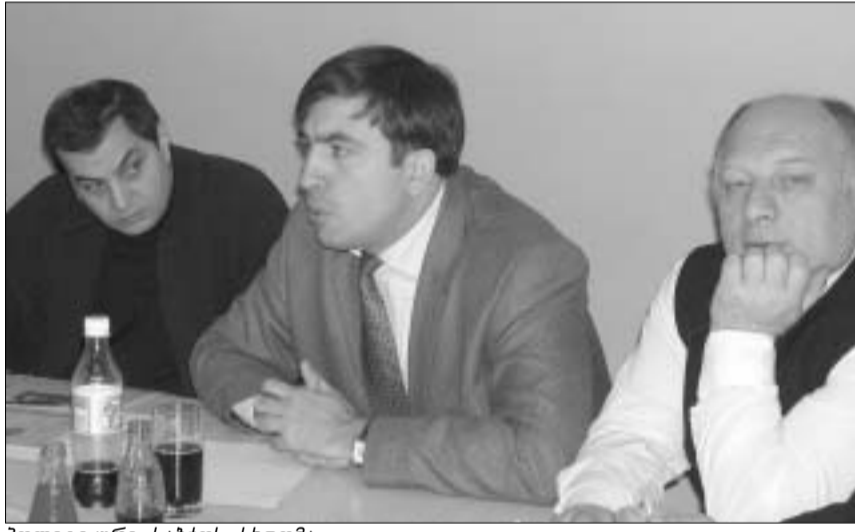
პოლიტიკური საბჭოს სხდომა

გუშინ "ნაციონალურმა მოძრაობამ" პოლიტიკური საბჭოს ღია სხდომა გამართა. ძირითადი საკითხი, რაც მიხილს საკავშირის საკუთარ თანაგუნდელებთან განხილვა, შევარდნაძის იმპიჩმენტი გახლდათ. "ნაციონალური" "აღორძინების" მიერ შედგენილ პრეზიდენტის საიმპიჩმენტო დოკუმენტს ხელს არ მოაწერენ. "ნაციონალური მოძრაობა", ბათუმური ალიანსის საპირისპიროდ, საკუთარ დოკუმენტს აწვადებს. პრეზიდენტის გადასაყენებელი დოკუმენტის მომზადება საკავშირის პარტიის იურისტებს უკვე დაავალა.