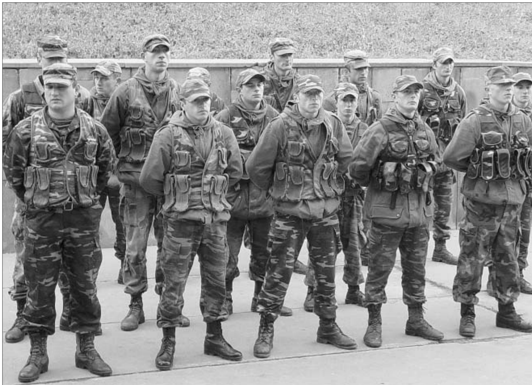
ნატო-ს სტანდარტებთან ყველაზე მიახლოებული შენაერთი - კოჭრის ბრიგადა.