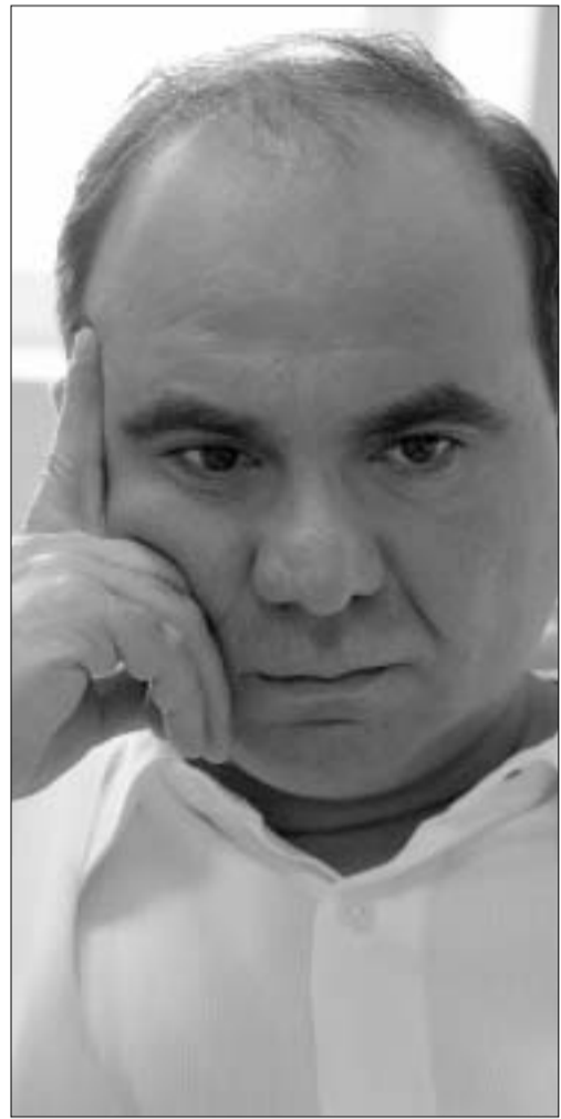
ნამი ბოლო ათი წლის მანძილზე განვითარდა. რა მოუვლია დემოკრატია ამ პერიოდში, საით წავიდა?