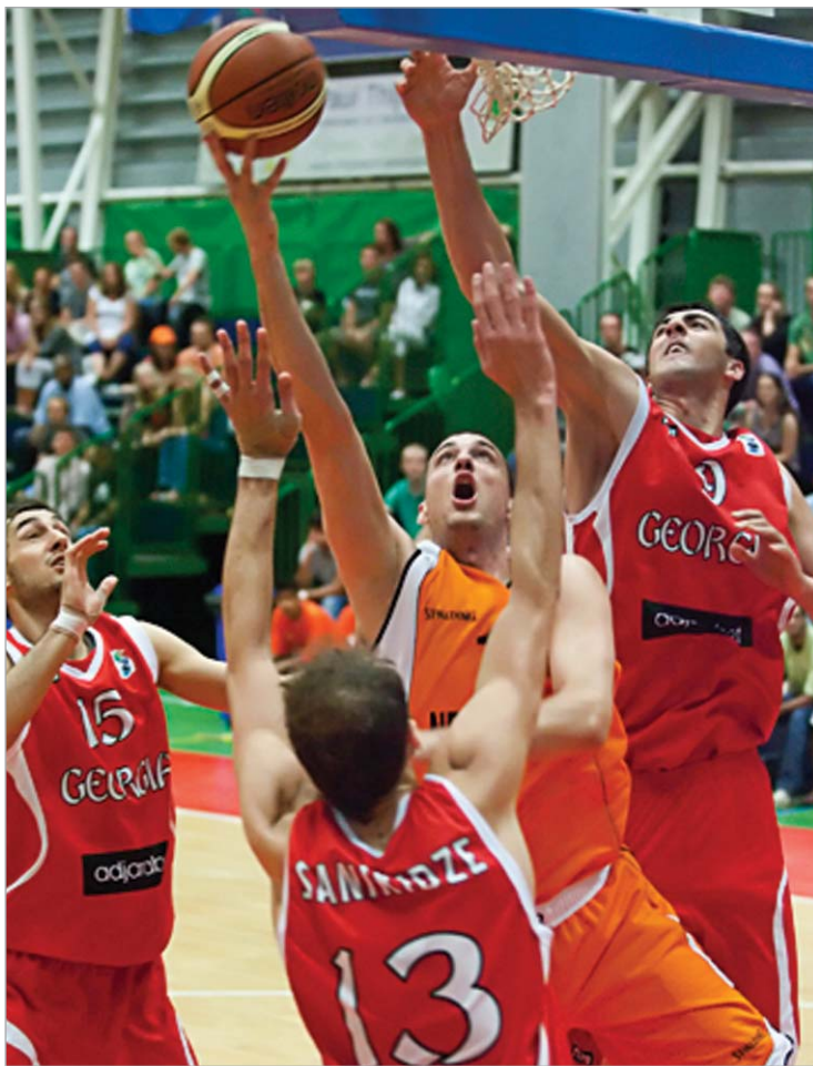
ქართველთა გარემოცვაში მოქცეულმა ჰოლანდიელმა მე-300 გამარჯვება იუბილა

პირველი მეოთხედი საქართველოს ნაკრებმა დამაჯერებლად მოიგო, თუმცა მეორეში მეტოქე დანინაურდა. ჰოლანდიელებს განსაკუთრებით კარგად გამოსდოდათ ფარქვეშ თამაში. მათი ცენტრები - ვან პასენი და ჰენ ნორელი შედეგიანები იყვნენ. მესამე მეოთხედი ჰოლანდიელებმა 20:14 მოიგეს და დაამყვეტ პერიოდს 7-ქულიანი უპირატესობით შეხვედრენ. ქართველებმა მოახერხეს მეტოქესთან 2 ქულით მიახ-