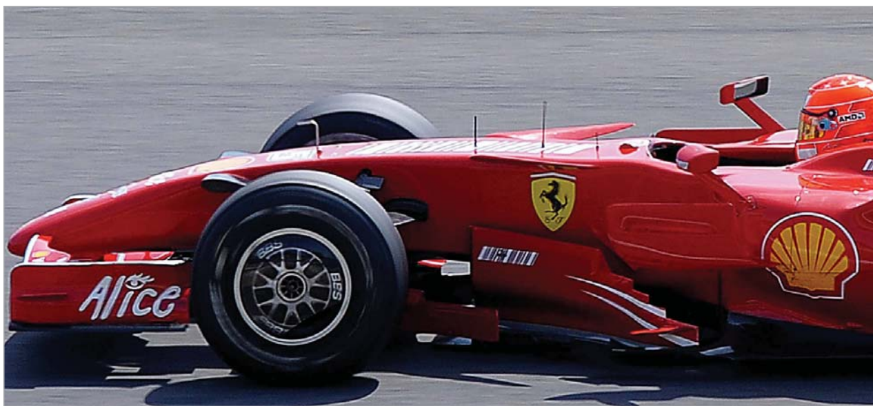
მიხაელ შუმახერს მიუქელის ტრასაზე F60-ის ტესტირების უფლება მისცეს

მაგრამ სანამ ეს მოხდება, გერმანელი პილოტი მუჯელის ტრასაზე დაქირავებული "ფერარი F2007-ით" განარძობს ინდივიდუალურ მზადებას. გუშინ მან 67 წრე გაიარა. პირველი სატესტო დღის განმავლობაში მისი საუკეთესო